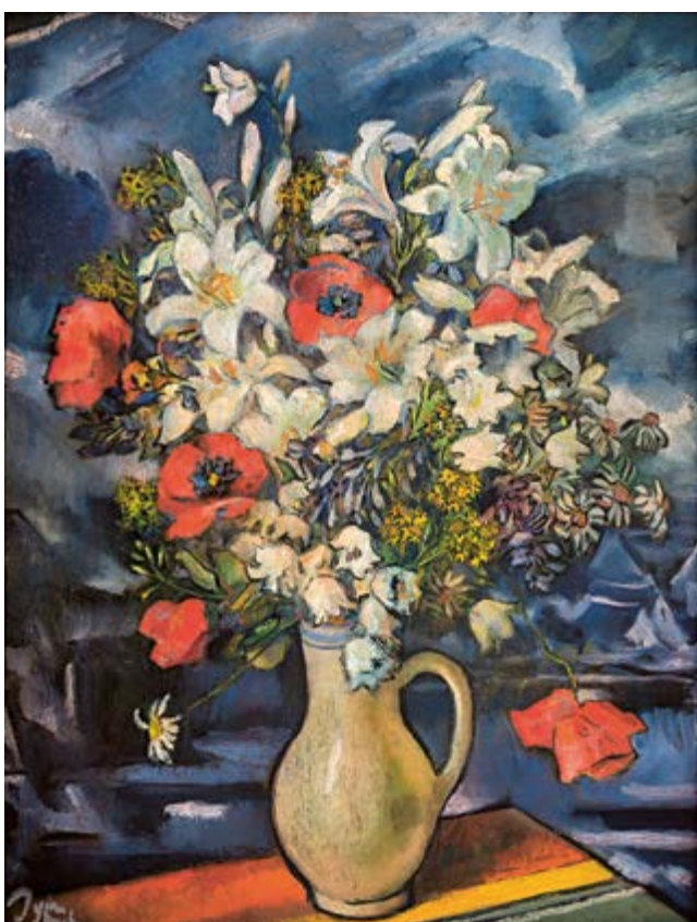
Kytice polních květin na modrém pozadí, 1954, olej na kartonu, 48 × 63,5 cm