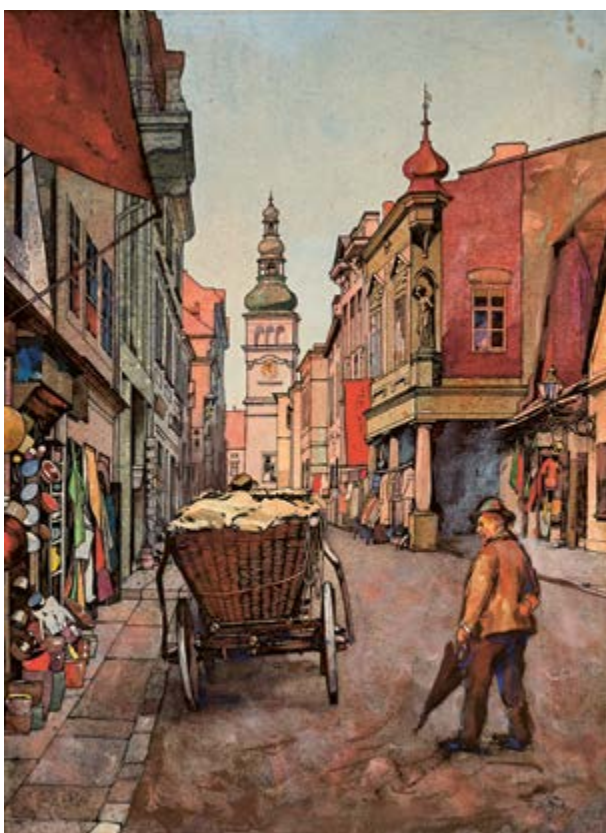
České Budějovice, 1908, perokresba, akvarel a kvaš na papíře, 22,5 × 30 cm