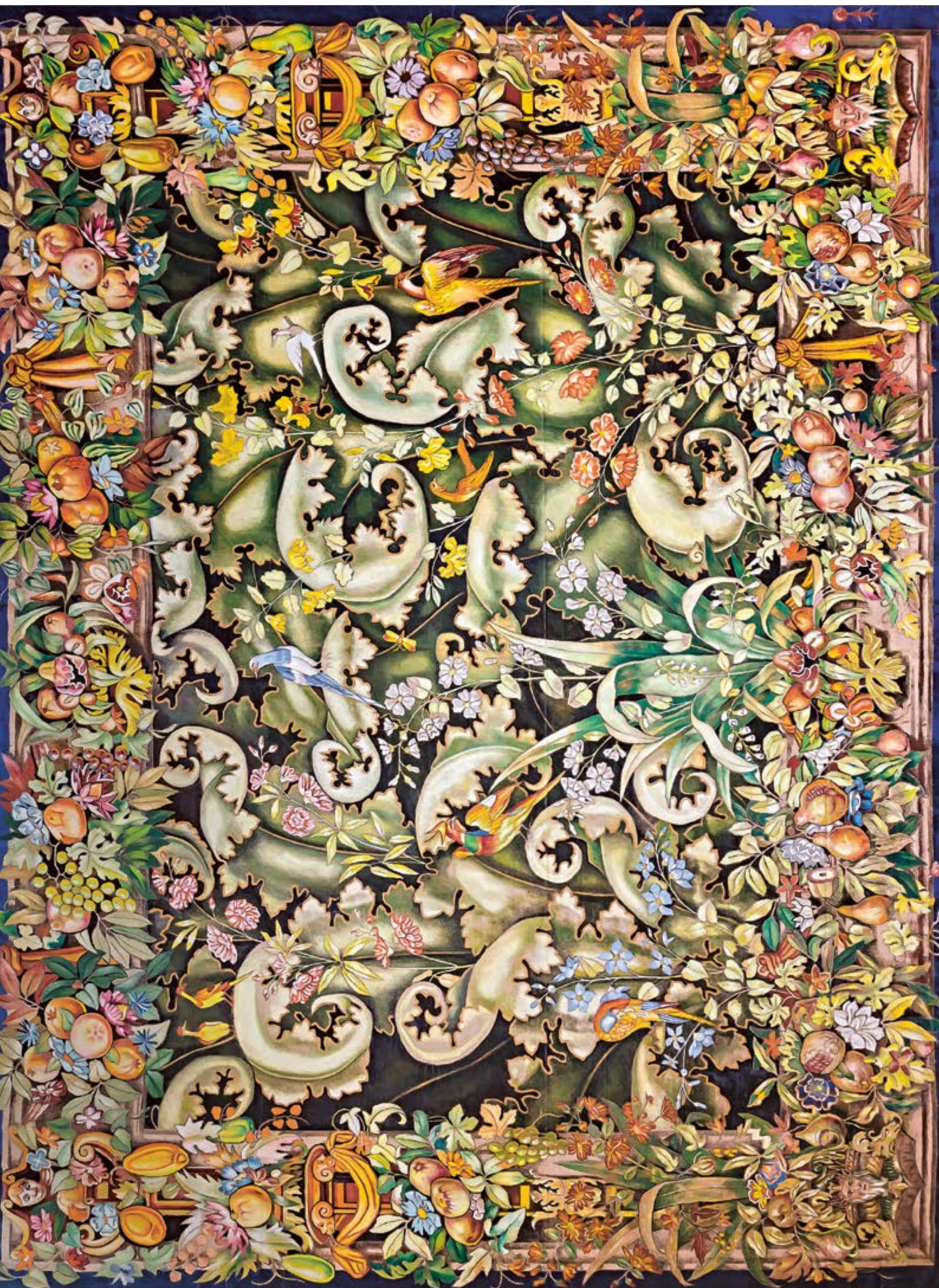
Gobelín, 1927, olej na tkanině z ovčí vlny, 300 × 225 cm

V pozůstalosti dnes zcela zapomenutého malíře Jana Křížka (1887–1961) se nachází zajímavé dílo vymykající se svým charakterem i rozměrným formátem, které nyní připomíná výstava ve formátu Opus magnum. Jde o volnou malovanou kopii ornamentálně pojaté renesanční tapiserie z 16. století s verdurou z belgické manufaktury Grammont, nacházející se ve vídeňských císařských sbírkách na zámku Schönbrunn. Křížek ji vytvořil v roce 1927 olejovými barvami na tkaninu z ovčí vlny imitující materiálův charakter předlohy; jako jakýsi prototyp interiérové dekorace, v jehož duchu nejspíš zamýšlel vytvářet podobné. Příležitost za tímto účelem Gobelín vystavit se Křížkovi naskytla v expozici uměleckého řemesla v pavilonu Werkbundu der Deutschen in der Tschechoslowakischen Republik (Svaz německého díla v Československu) na Výstavě soudobé kultury v Československu v Brně v roce 1928. Německý spolek založený v roce 1925 v Liberci v reakci na aktivity Svazu československého díla sdružoval německy hovořící designéry, umělce a průmyslníky žijící v Československu a mezi jeho aktivity kromě osvětových přednášek, vydávání tiskovin a zřízení vzorkové expozice patřila i výstavní činnost. Křížkův Gobelín tak byl vystaven vedle porcelánu Michaela Mörtla, skleněných váz z Nového Boru (Haida) nebo stříbrných mís podle návrhu Viktora Oppenheimera. Jeho umístění do německé expozice bylo nejspíše zvoleno z důvodu Křížkových úzkých vazeb