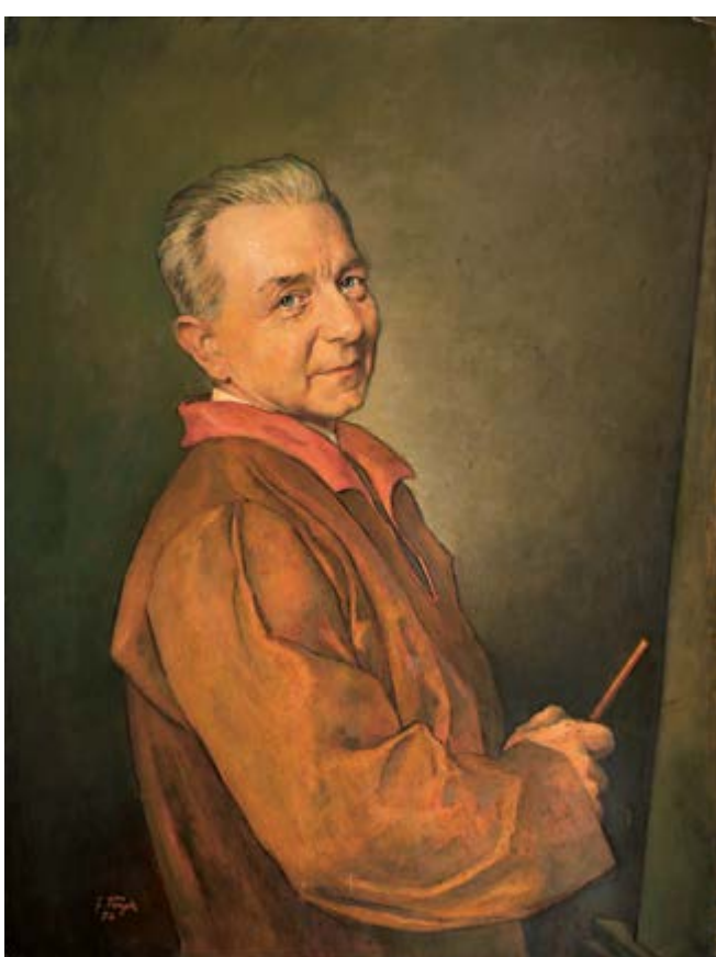
Autoportrét, 1952, olej na kartonu, 68 × 76 cm