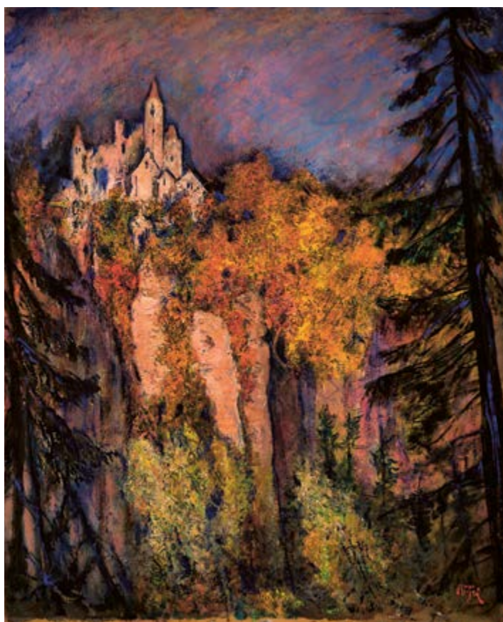
Krajina s hradem, asi 50. léta 20. st., olej na kartonu, 37 × 46 cm