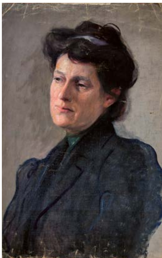
Portrét ženy v černých šatech, 10. léta 20. stol. (?), olej na plátně, 40 × 62 cm