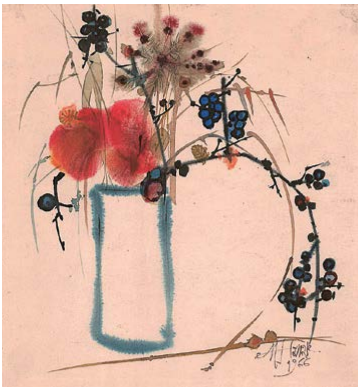
Podzimní kytka VI, 1966, akvarel na papíru, 26×24 cm