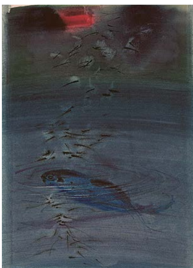
Noční lipan IV, 60. léta, akvarel na papíru, 33×24 cm