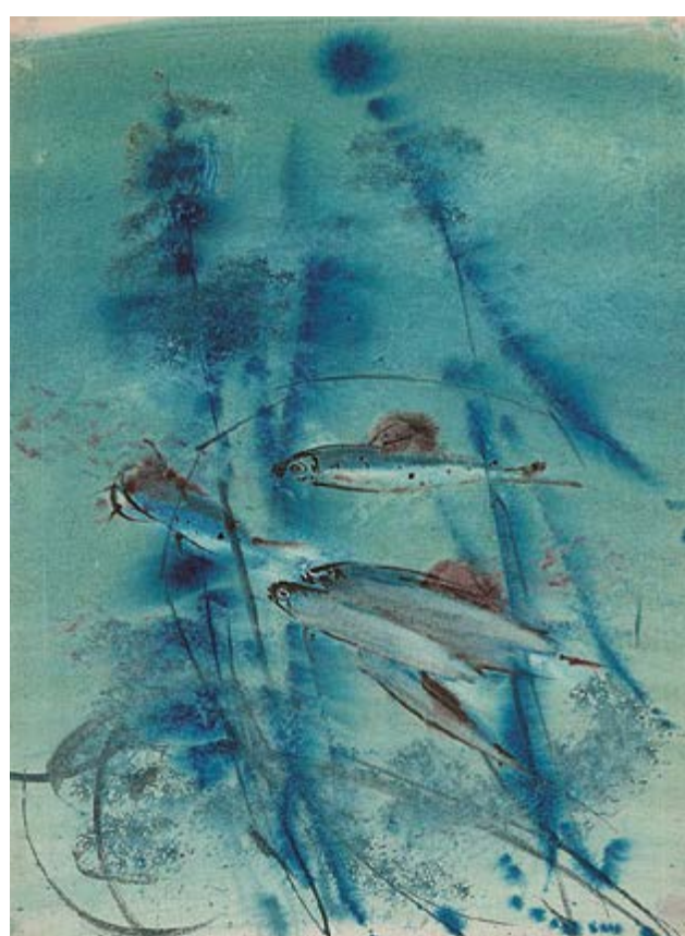
Lipani, 60. léta, akvarel na papíru, 33×24 cm