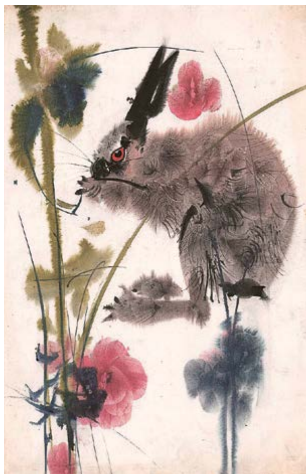
Zajíček, nere realizovaná varianta ilustrace ke knize Zvířátka z lesa, před 1968, akvarel na papíru, 50×32,5 cm