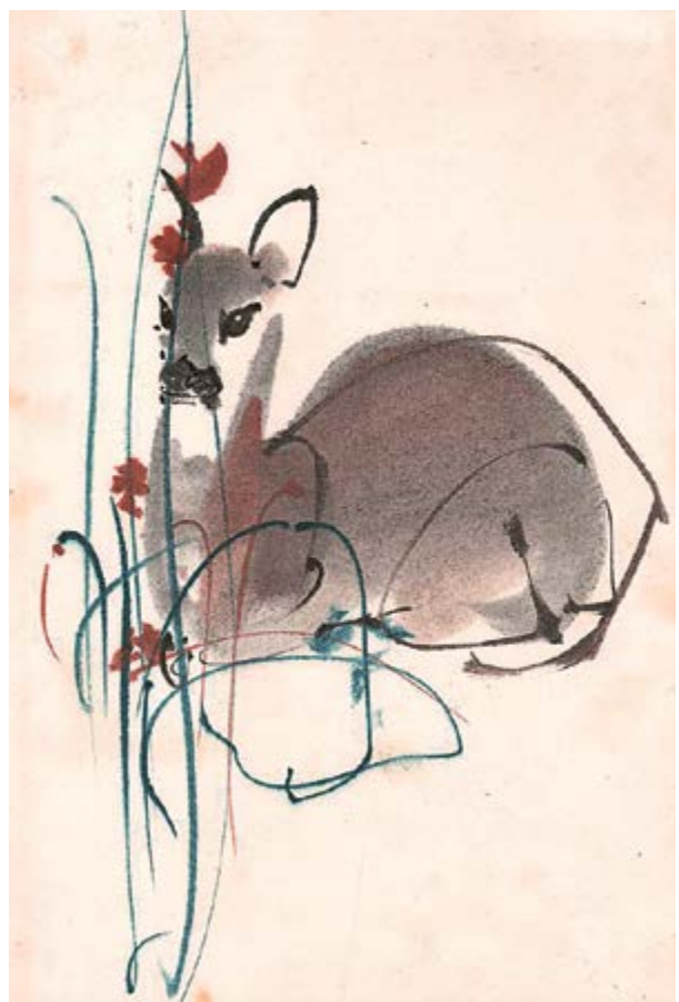
Podzimní srna, 60. léta, akvarel na papíru, 37,5×28,5 cm