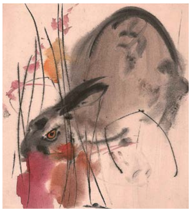
Zajíc, 60. léta, akvarel na papíru, 26×24 cm