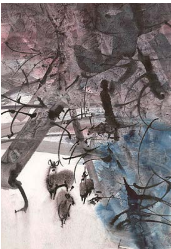
Srňky v podzimním lese, 60. léta, akvarel na papíru, 32,5×23 cm