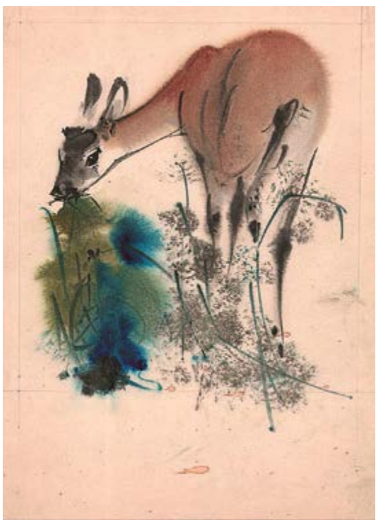
Srňka, 60. léta, akvarel na papíru, 33×24 cm