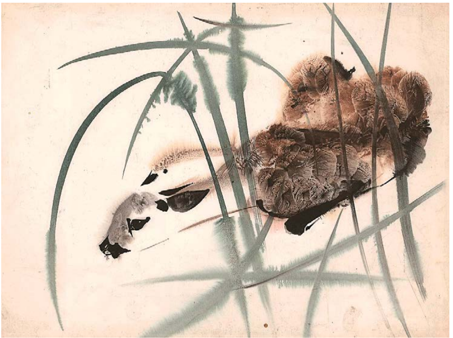
Kološek, 60. léta, akvarel na papíru, 33,5×44,5 cm