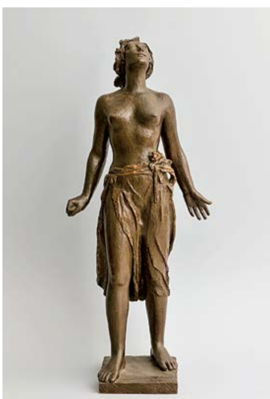
Otakar Švec, Nadšení , 1938, bronz, v. 94 cm, Galerie Klatovy / Klenová