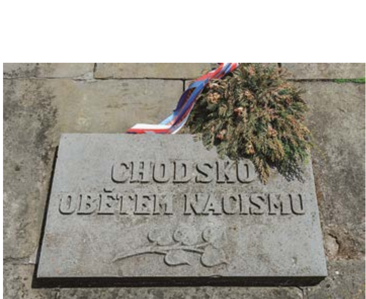
Detail nápisové desky, beton

Na obálce: Otakar Švec, Jaromír Krejcar, Pomník obětem nacismu v Domažlicích, 1948 (s použitím starší sochy z roku 1938), bronz, v. 275 cm (bez soklu)