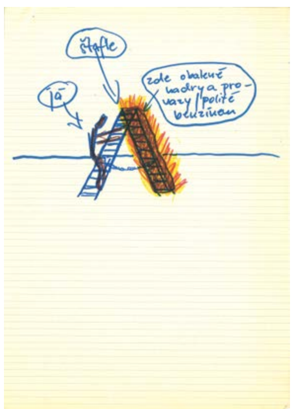
Skica k performativní instalaci, nedat. (80. léta), archiv Vladimíra Meistra / Sketch for a performative installation, undated (1980s), archive of Vladimír Meister