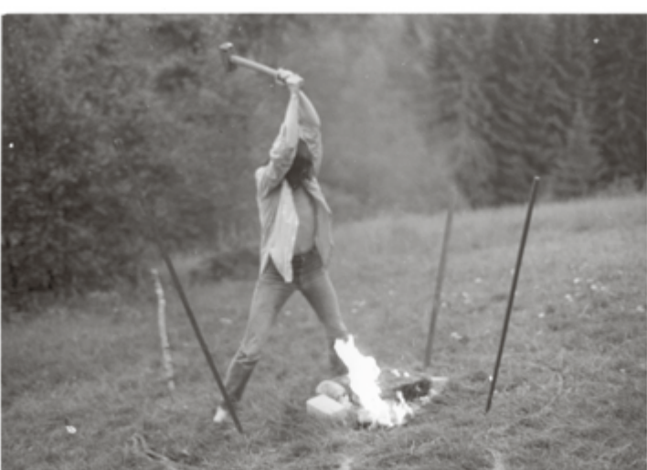
Tříštění kamene, Šumava, 8. 8. 1980, / Stone-Breaking, Bohemian Forest, 8 August 1980