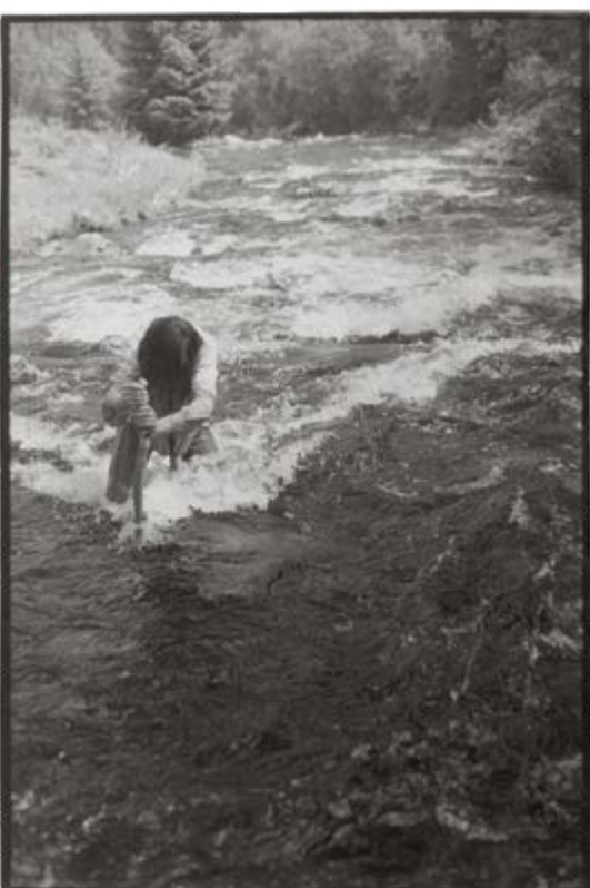
Chůze proti proudu řeky (Kontakt I), Šumava, 1980, archiv Vladimíra Meistra / Counterflow Walk (Contact I), Bohemian Forest, 1980, archive of Vladimír Meister