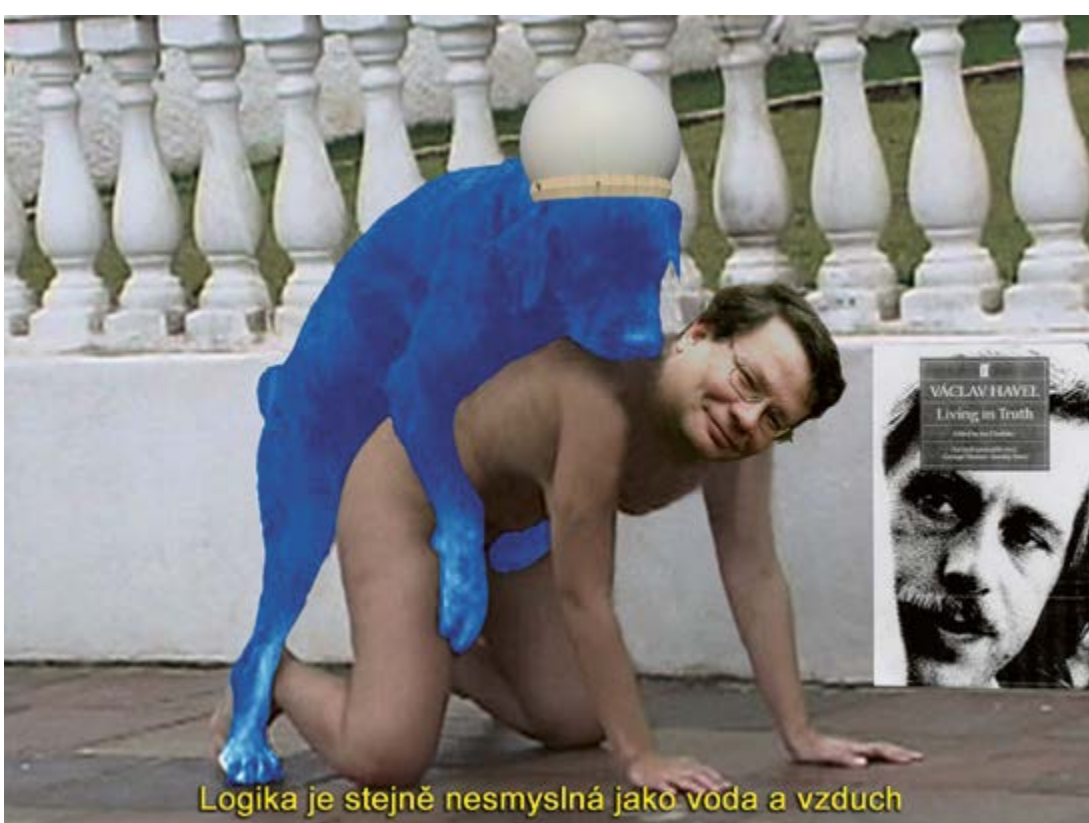
Podvratné mýty (výběr ze slideshow), z výstavy Milan Kozelka a Andrea Lexová, Podvratné mýty, Galerie NoD, Praha, 2009, archiv Milana Mikuláščíka / Subversive Myths, slideshow selection from the exhibition Milan Kozelka and Andrea Lexová, Subversive Myths, NoD Gallery, Prague, 2009, archive of Milan Mikuláščík ("Logic is nonsensical as water and air")