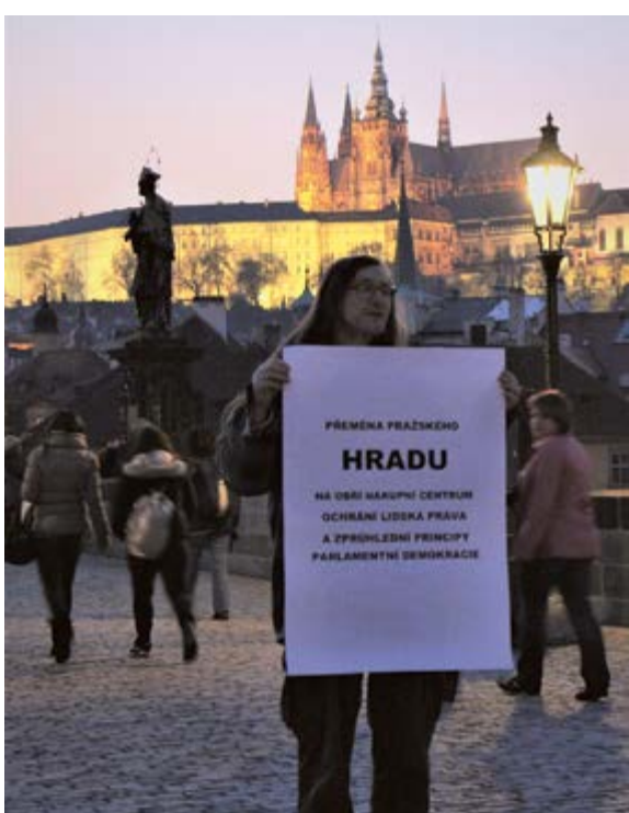
Performance na Karlově mostě, Praha, 2011, Vladimír Havlík / The Charles Bridge Performance, Prague, 2011