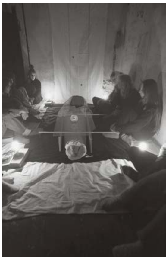
Pohyblivé hroby, Olomouc, 1980 / Moving Graves, Olomouc, 1980