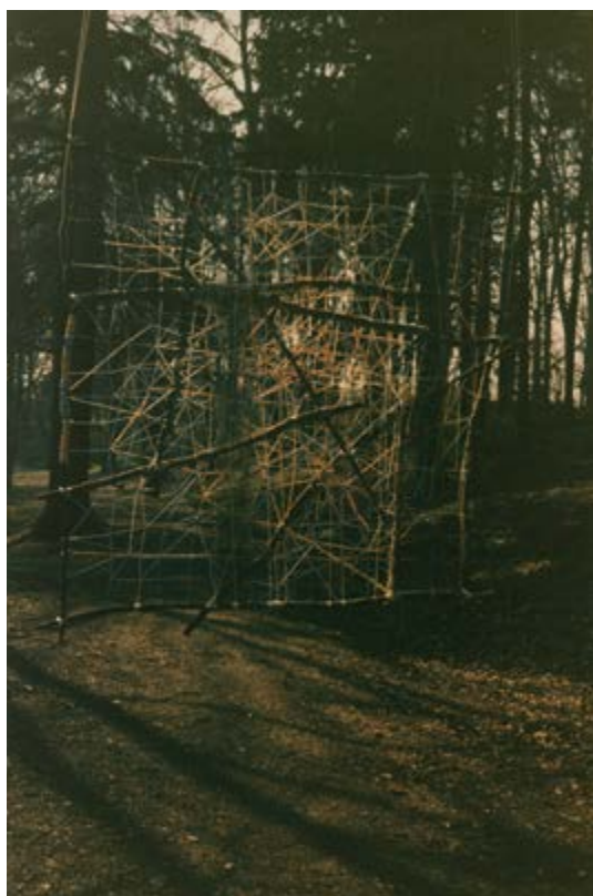
Izomorfní kresba, Karlovy Vary, kolem roku 1983, archiv Vladimíra Meistra / Isomorphous Drawing, Karlovy Vary, around 1983, archive of Vladimír Meistr