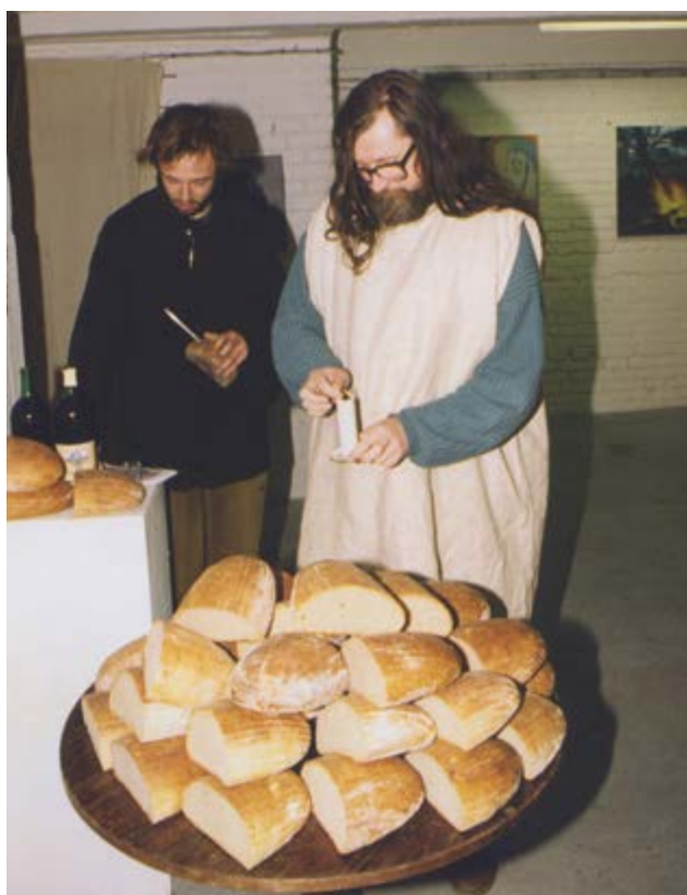
Performance na vernisáži skupiny Luxus, Galerie Fiducia, Ostrava, 1997 / Performance at the Luxus group opening, Fiducia Gallery, Ostrava, 1997