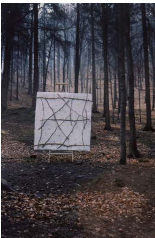
Izomorfní kresba, Karlovy Vary, kolem roku 1983, archiv Vladimíra Meistra / Isomorphous Drawing, Karlovy Vary, around 1983, archive of Vladimír Meistr