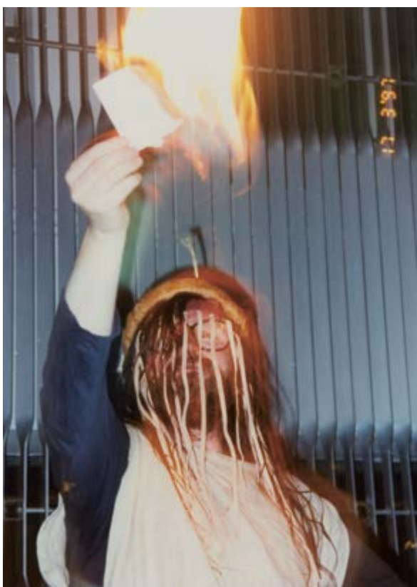
Podlet pod kukaččím hnízdem, Karlovy Vary, 1997 / One Flew under the Cuckoo's Nest, Karlovy Vary, 1997