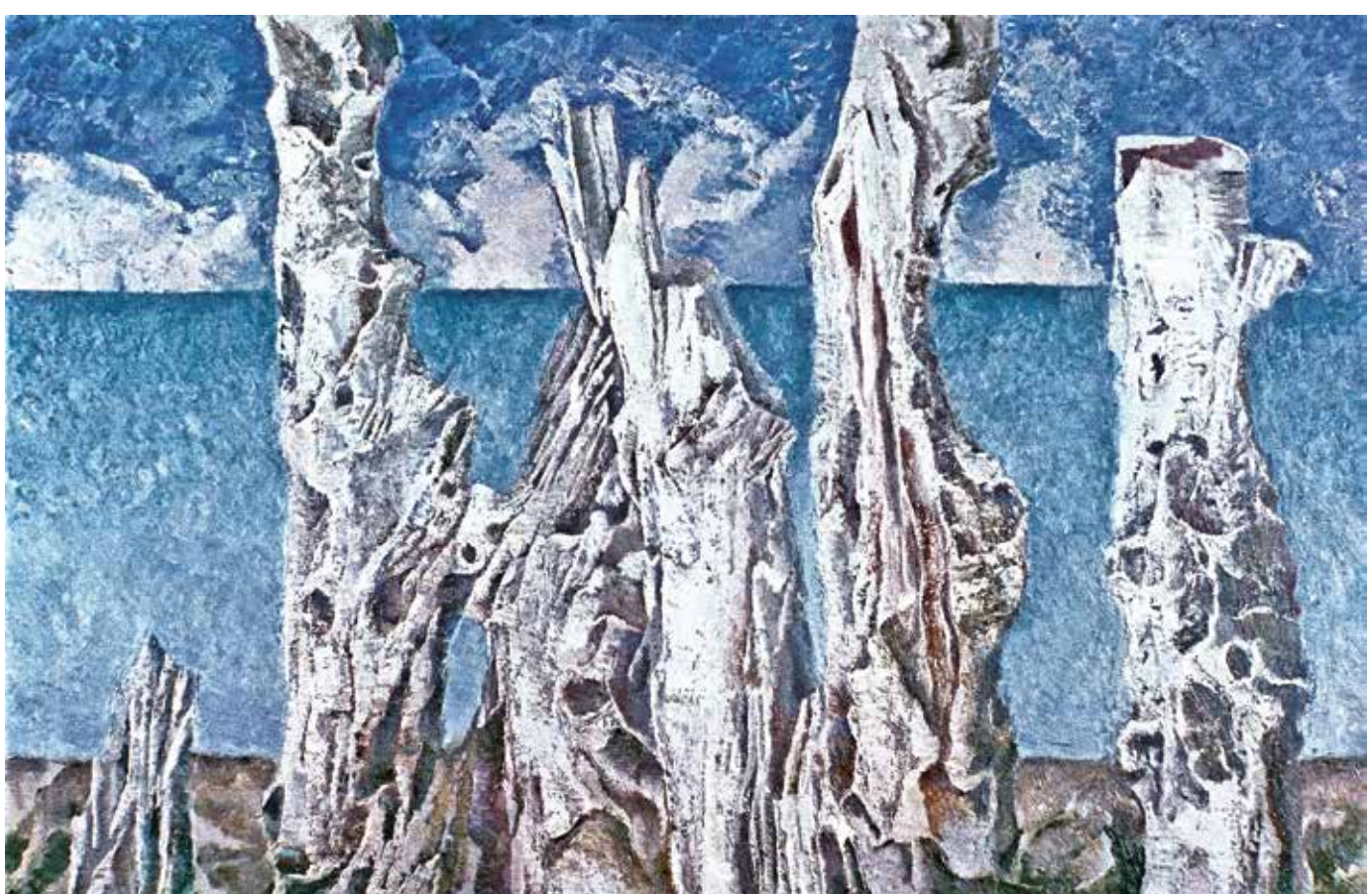
STROMY A SOCHY, 1967 OLEJ, PLÁTNO, 90 × 135 CM SOUKROMÁ SBÍRKA