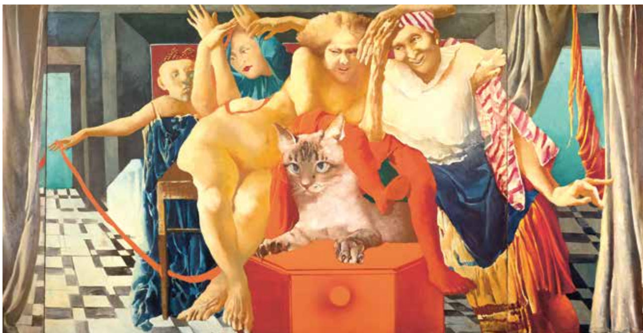
KOČKA DOMÁCI, 1983 OLEJ, PLÁTNO, 145 × 200 CM SOUKROMÁ SBÍRKA