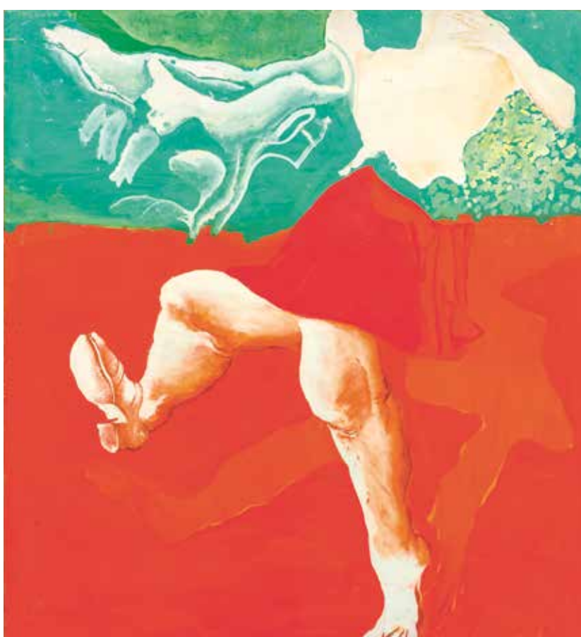
BALETKA, 1972 TEMPERA, SOLOLIT, 120 × 110 CM SOUKROMÁ SBÍRKA