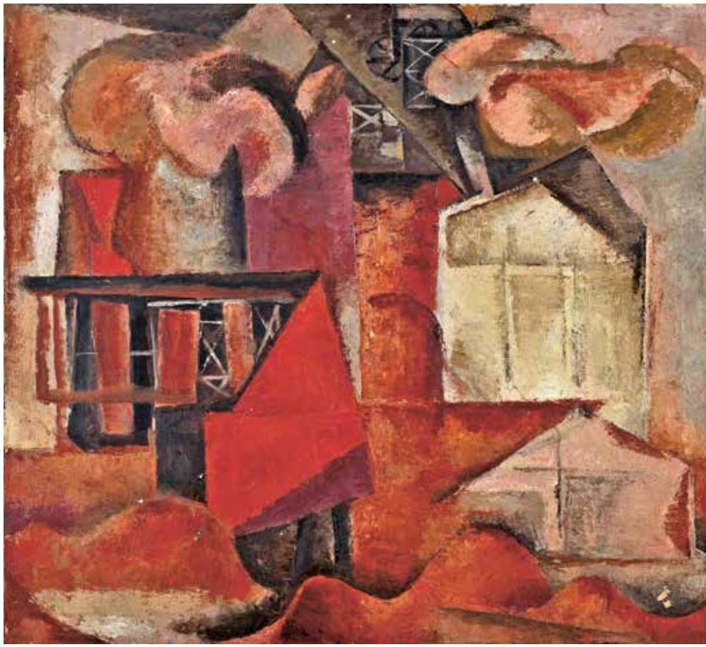
DŮL Č. X, 1962 OLEJ, PLÁTNO, 100 × 96 CM VÝCHODOČESKÁ GALERIE V PARDUBICÍCH

Současná výstava nepředstavuje souhrnnou tvorbu Jaroslavy Pešicové. Soustřeďuje se jen na určité momenty, které byly pro směřování malířky rozhodující. Její díla přitom záměrně konfrontuje s pracemi slavného amerického umělce Roberta Rauschenberga, považovaného za průkopníka postmoderního umění. Přestože se Pešicová umělcovými obrazy zřejmě nikdy přímo neinspirovala, používala velmi obdobné tvůrčí principy, založené mimo jiné na citacích banálních obrazových předloh (pohlednic psů, koček a květin), na práci s koláží, nebo na hybridním spojování různých fragmentů. Konfrontace Pešicové s Rauschenbergem otevírá obecnější úvahy o povaze „nové figurace“ a jejích vztazích k postmoderně, která je v českém prostředí většinou spojována až s nástupem generace tzv. Konfrontací v osmdesátých letech.