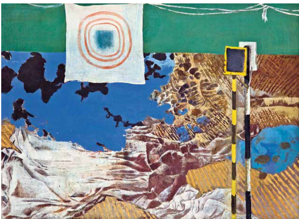
TERČ V KRAJINĚ, 1968 OLEJ, PLÁTNO, 96 × 125 CM SOUKROMÁ SBÍRKA