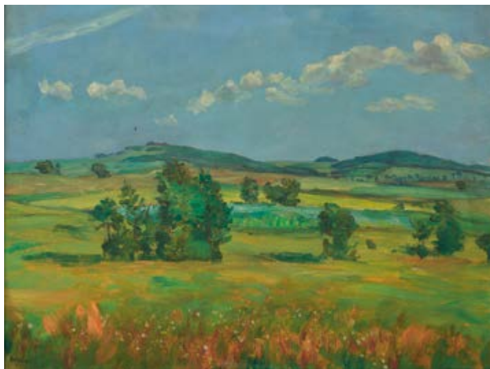
František Kaván, Krajina, olej na papíru, 40 × 62,5 cm