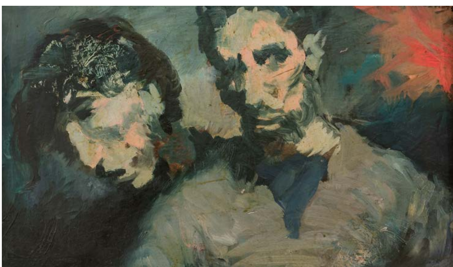
Richard Wiesner, Dvě hlavy, 1944, olej, dřevo, 20 × 33,5 cm