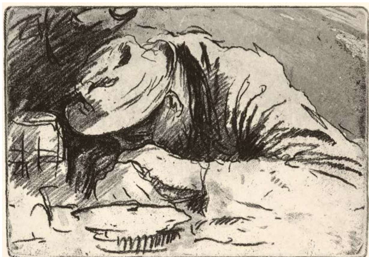
Ladislav Čepelák, Piják, ze souboru Hospody, 1960, lept na papíru 4/50, 31 × 38 cm