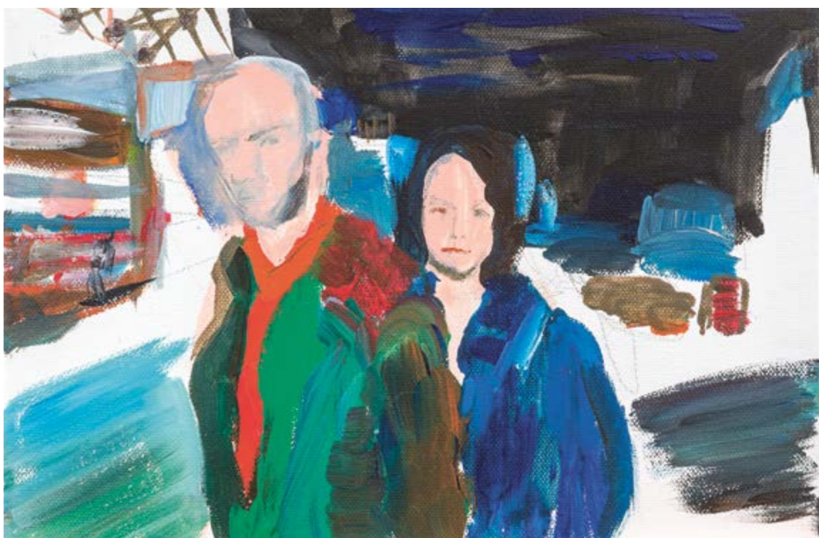
Setkání na chebském nádraží, 2020, 20 × 30 cm

Obraz Richarda Wiesnera mne zaujal svým obsahem. Líbí se mi, že tváře a výraz mužů nejsou krásné. Jejich prostřednictvím však vidím skutečný život (nejen) té doby. Pocházím z Chebu, kde jsem se v roce 1975 narodila. Malování a kreslení patří mezi mé nedávné, nyní však největší záliby. Tématem jsou především děti při jejich dnešních hrách na mobilu či tabletu, a dále domácí mazlíčci a jiná zvířátka.