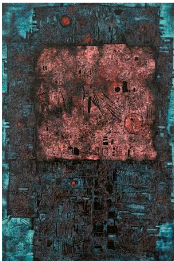
Titulní strana: Léto s Mikulášem Medkem, 2017, olej na plátně, 115 × 105 cm Mikuláš Medek, 3.904 starých růžových cm 2 , 1962, olej na plátně, 140 × 95 cm