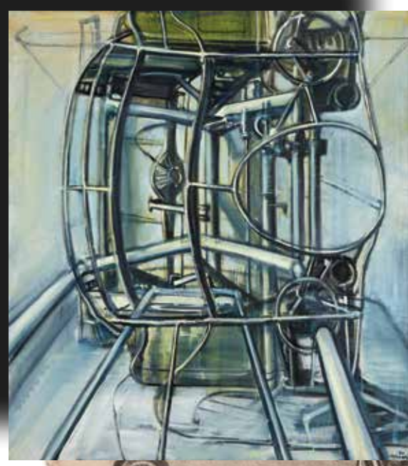
BÍLÝ STROJ, 1971, OLEJ NA PLÁTNĚ, 200x180 CM, SBÍRKA FINANČNÍ SKUPINY PPF