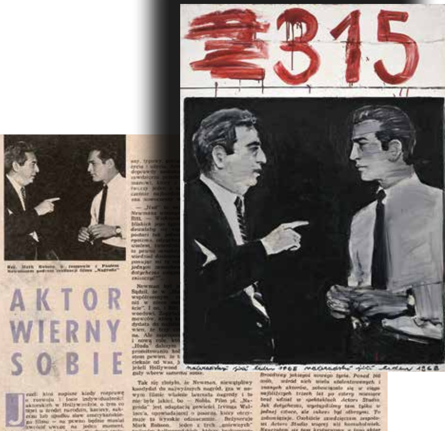
ROZHOVOR, 1968, OLEJ NA PLÁTNĚ, 162x115,5 CM, GVU HODONÍN

SNÁŽÍM SE O NEOSOBNÍ, SYROVOU FORMU BEZ DŮMYSLNÉ DEFORMACE, KTERÁ MUSÍ BÝT SPÍŠE BEZDĚČNÁ NEŽ VYUMĚLKOVANÁ NEBO ARANŽOVANÁ. MIMOTO NATURALISTICKÁ MOMENTKA MÁ JEDNU VÝHODU – JE ZAJÍMAVÁ A PŘENEKLIDNĚJÍ VLASTNÍ REALITOU AKCE A PŘENEKLIDNĚJÍ VLASTNÍ REALITOU AKCE A PŘENEKLIDNĚJÍ VLASTNÍ REALITOU AKCE A PŘENEKLIDNĚJÍ VLASTNÍ REALITOU AKCE