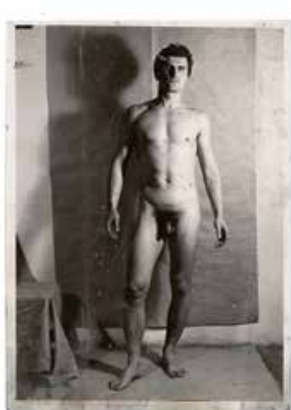
PORTRÉT MLADÉHO MUŽE, 1967, OLEJ NA PLÁTNE, 130×145 CM, VGPARDUBICE

POUŽITÍ FOTOGRAFIE MĚLO JEŠTĚ JEDEN DŮVOD. PŘÍČIN SE MI ZPŮSOBE MALBY PODLE MODELU A PODLE STUDIJNÍ KRESBY – VŽDYKY TO ZAUJEME NEJAKÉM NECHTĚL JSEM OSTATNĚ NIKDY DĚLAT OBRAZ JAKO NĚCO PŘEPLYCHOVÉHO, NÁPĚRNEHO, SKVĚLÉHO, ALE SPÍŠE JAKO PRIMÁVNÍ VÝPOVĚD, JAKO SVĚDECTVÍ, ARCHIVNÍ DOKUMENT, JAKO TÁCHRNÍ POLICEJNÍ ZJIŠTĚNÍ.