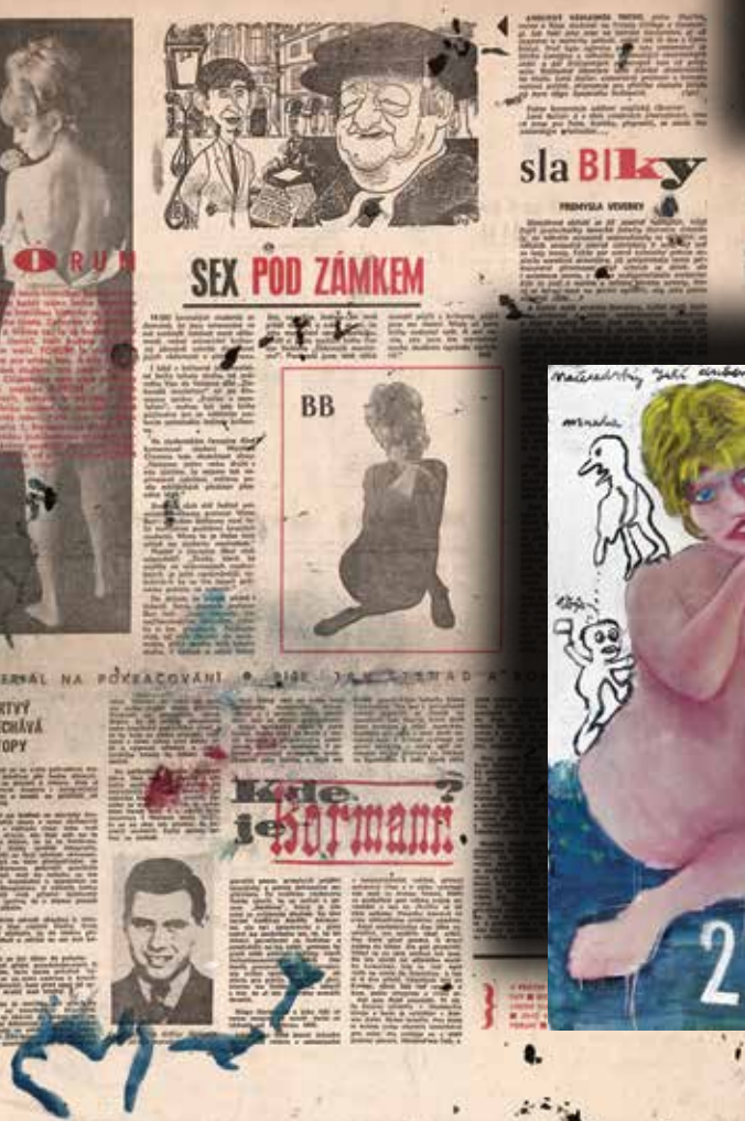
JAZZOVÝ MOTIV, 1967, OLEJ NA PLÁTNE 116×150 CM, COLLETT PRAGUE | MUNICH