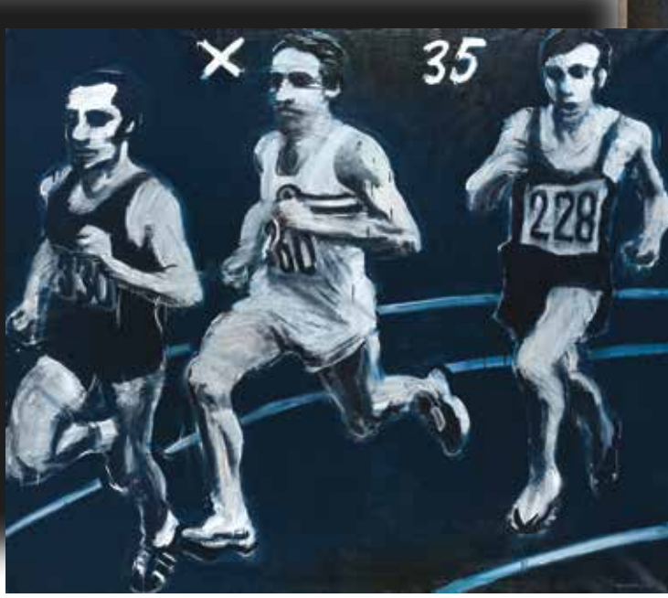
BĚŽCI, 1971, OLEJ NA PLÁTNĚ, 176x205 CM, SOUKROMÁ SBÍRKA

Uradí kina majitel knihy rozebrány v rozebrání... (text continues with a review of a film)