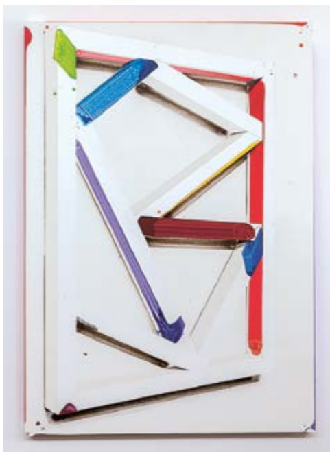
Z cyklu Jiný úhel pohledu / Aus der Serie Ein anderer Blickwinkel, 2019, akryl a sprej na plátně / Acryl und Spray auf Lnw., 206,5 cm x 143,5 cm

GAVU – Malá galerie / Kleine Galerie 16. 1. – 29. 3. 2020 Kurátor / Kurator Radek Wohlmuth Vernisáž ve středu 15. ledna v 17.00.