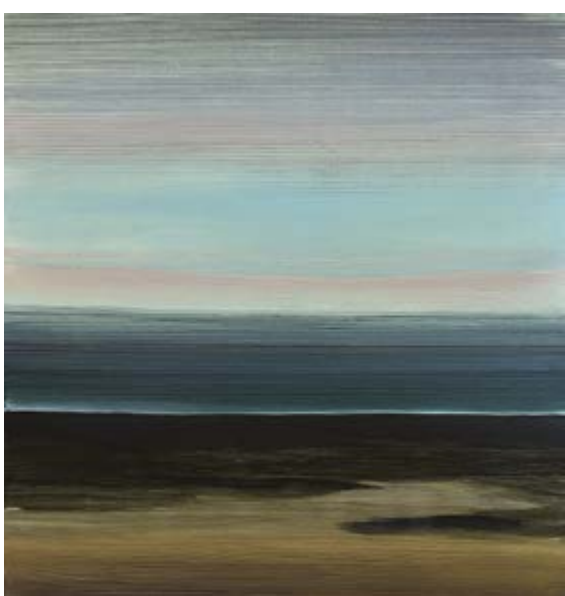
Út Við Sæbarða Strönd, 2018, olej na plátně / Öl auf Lnw., 125 x 120 cm

GAVU – Velká galerie / Grosse Galerie 16. 1.–29. 3. 2020 Kurátor / Kurator Marcel Fišer Vernisáž 15. ledna v 17.00.