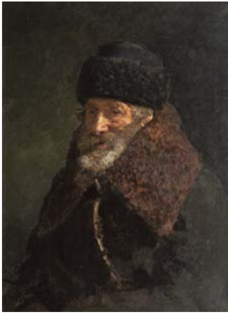
Olej, plátno / Öl auf Lnw., 74 x 55 cm, soukromá sbírka / Privatsammlung

GAVU – Opus magnum 16. 1.–5. 4. 2020 Kurátorka / Kuratorin Julie Jančárková Vernisáž ve středu 15. ledna v 17.00.