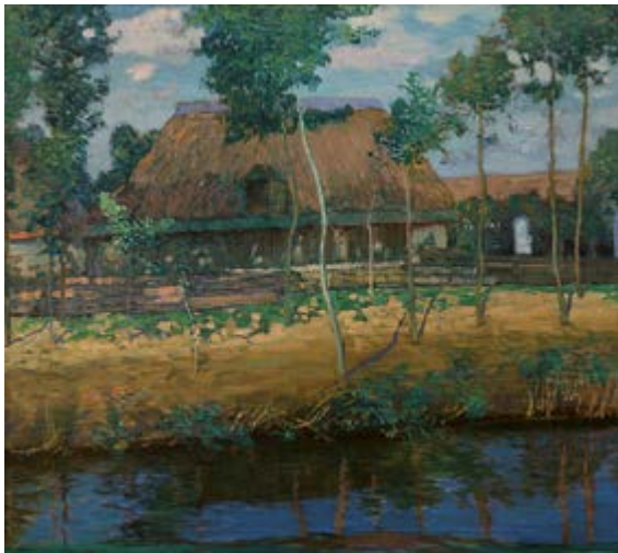
Chalupa / Bauernhütte, 1906 nebo / oder 1907, olej na plátně, Öl auf Lnw. 80 x 90 cm

GAVU – Výstava z depozitáře / Ausstellung aus dem Depot 6. 2.–24. 5. 2020 Kurátor / Kurator Marcel Fišer