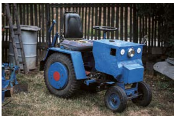
Kutilský traktorek / Traktorchen

Retromuseum – Výstavní sál / Ausstellungssaal 24. 10. 2019 – 19. 4. 2020 Kurátor / Kurator Petr Gibas Výstava je připravena ve spolupráci se Sociologickým ústavem AV ČR.