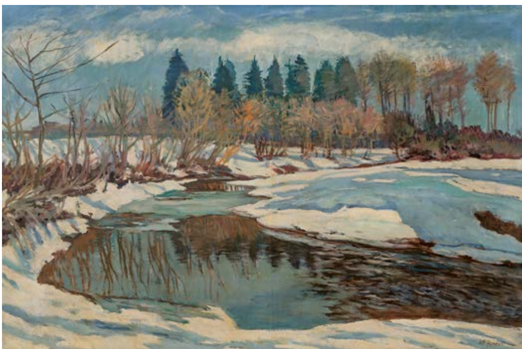
Potok Bělá v zimě, 30. léta, olej na plátně, 94 × 141 cm, značeno vpravo dole: Ant. Hudeček. Zakoupeno v roce 1978 ze soukromé sbírky.