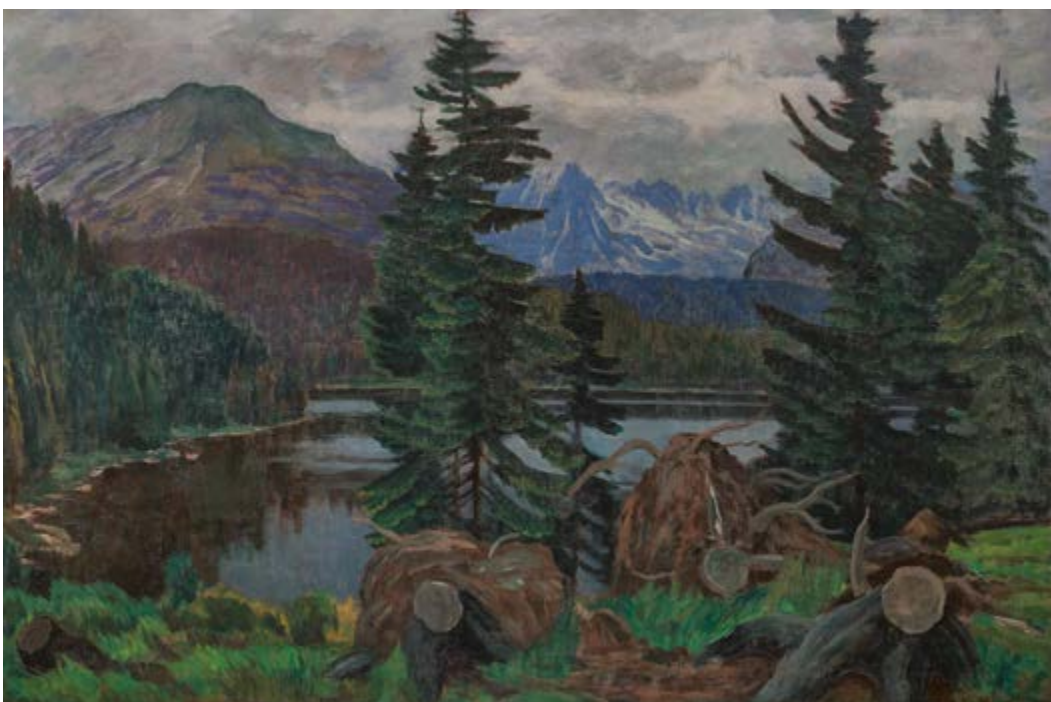
Štrbské pleso, 1920–1926, olej na plátně, 107 × 156 cm. Zakoupeno v roce 1973 ze soukromé sbírky.

V letech 1920 až 1926 (s výjimkou roku 1924) maloval Hudeček ve Vysokých Tatrách. Štrbské pleso zobrazil několikrát. Navštívil ho už při prvním pobytu v roce 1920 a obraz s tímto názvem datovaný 1921 vystavil na souborné výstavě v Máněsu v roce 1922. 8 Ale i zde platí, že se doma v ateliéru vracel ke svým starším plenérovým skicám, takže nemá smysl pokoušet se o přesnou dataci. 9 Hudečka tatranská plesa fascinovala a stala se hlavním motivem jeho tatranských obrazů – vedle Štrbského zobrazil i Popradské, Zelené Javorové, Velké Žabie, České (Ťažké) a možná i další.