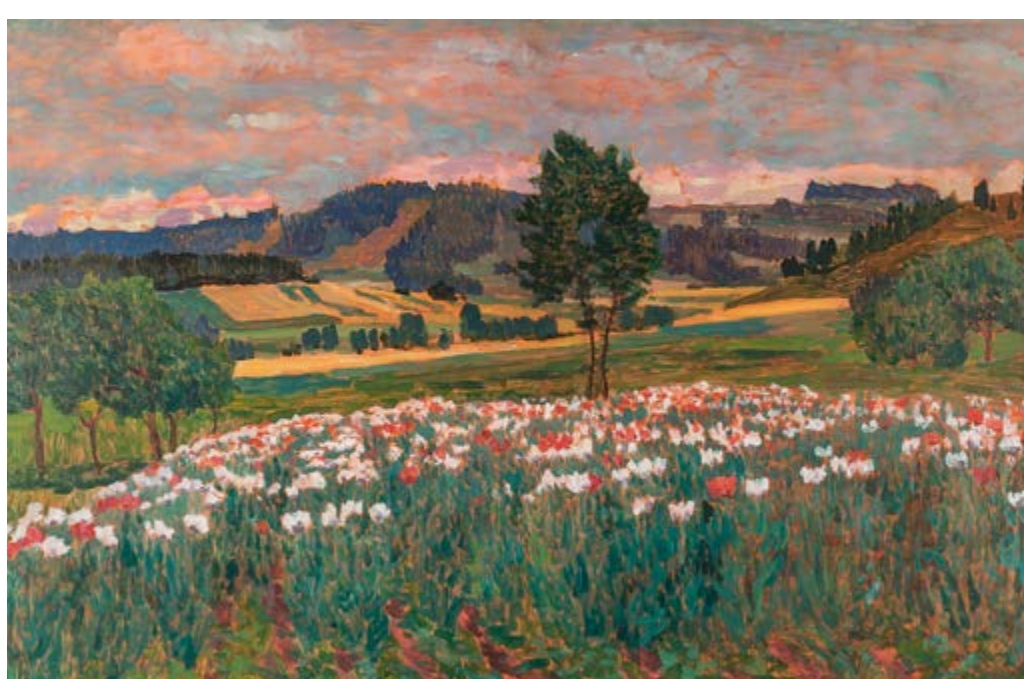
Krajina s rozkvetlým makovým polem, 1910 (?), olej na lepence, 66 × 100 cm, značeno vpravo dole: Ant. Hudeček. Zakoupeno v roce 1985 ze soukromé sbírky.

Nedatovaný obraz je typickou Hudečkovou plenérovou studií, čemuž odpovídá i skicovitě provedení a prosvítání podkladu. Vznikl v okolí Machova na Policku v severovýchodních Čechách nedaleko česko-polských hranic. Kopec v pozadí s výraznou mýtinou se například objevuje na obraze Červené střechy (Chalupy v Machově) (GU Karlovy Vary) právě z roku 1910. Na Policko Hudeček zajížděl v letech 1909–1914. První rok přijel až na podzim opět se sochařem Jaroslavem Vorlem, který tehdy prováděl výzdobu sokolovny v Polici nad Metují. Tehdy se zde věnoval lesním zákoutím, následujícího roku zde však strávil již celou sezónu a intenzivně maloval v okolí sousedních vesnic Machov a Nížká Srbská. Chebských studií pochází nejspíš z tohoto roku.