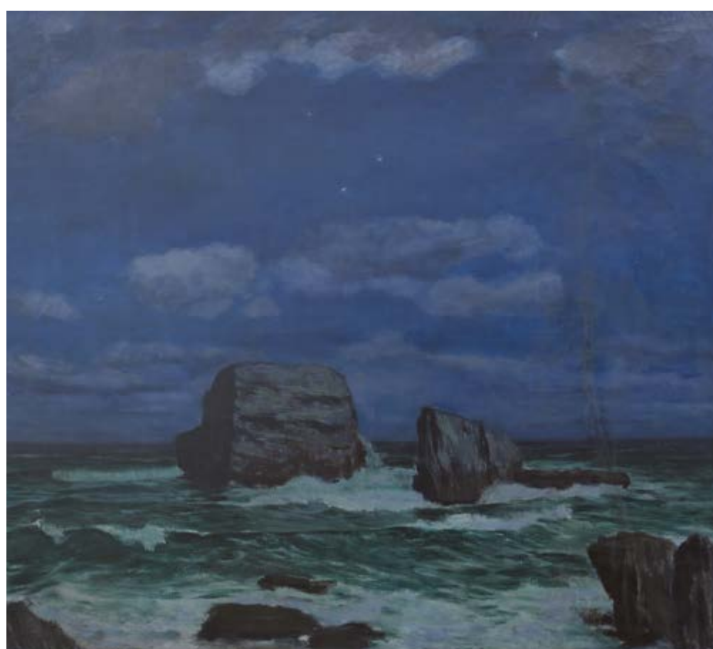
Moře, 1909 nebo později, olej na plátně, 118 × 130 cm. Zakoupeno v roce 1973 od autorovy snachy.