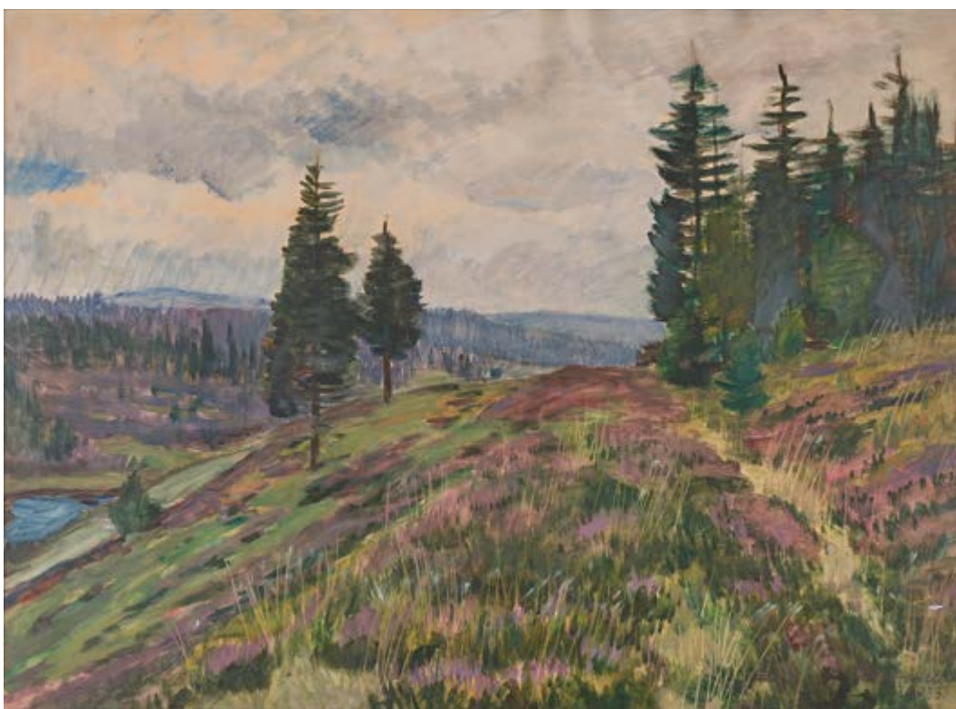
Horská krajina s kvetoucím vřesem, 1933, olej na kartonu, 42 × 58 cm, značeno: Hudeček 1933. Získáno v roce 1985 darem jako zabavené dílo.

táhnoucí se až k horizontu s řekou v údolí by mohly být zalesněnou krajinou kolem Otavy právě v okolí Vráže. Nenechme se zmást názvem, který není autorský: na obraze žádná vysloveně horská krajina zachycena není.