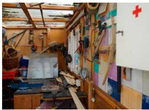
Kutilská dílna v autokempu (foto: autorský tým)

Výstava představuje současnou podobu této svépomocné tvorby, jak jsme ji zaznamenali v průběhu výzkumu, který probíhal mezi roky 2018 a 2019 v severozápadních Čechách, zejména na Chebsku a okolí. Výzkum a zejména rozhovory, které jsme v jeho rámci vedli s kutilkami a kutily, nám umožnil identifikovat devět klíčových ohledů současného kutilství – morálku, zdraví, tvořivost, nutnost, inspiraci, schopnosti, prostory, postupy a materiály. Výstava je proto rozdělena na devět částí, z nichž každá představuje právě jeden z těchto klíčových ohledů. Ty se nicméně ve skutečnosti překrývají a jejich prolnutí určuje, jak současné kutilství vypadá, jak mu kutilky a kutilové rozumí, jak jej prožívají a co vlastně vytvářejí, kdy, kde, z čeho a proč. Z toho důvodu jsou sice jednotlivé vystavené materiály – samotné kutilské výrobky, drobné kutilské příběhy doprovázené fotografiemi, výroky kutilek a kutilů, ale i kutilské příručky, časopisy a návody – rozděleny tak, aby jednotlivé ohledy současného kutilství ilustrovaly, zároveň aby však neznemožňovaly návštěvníkům nacházet vlastní propojení a souvislosti.