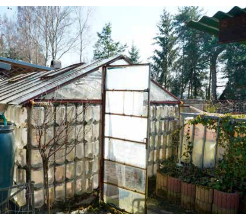
Lahve od okurek bývaly žádaným materiálem na výstavbu skleníků