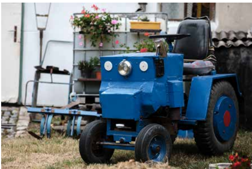
Kutilský traktůrek

Výstava vznikla jako součást projektu NAKI II Kutilství a jeho význam pro českou národní a kulturní identitu: současný stav, socio-kulturní a historicko-politické souvislosti, typologie a využití potenciálu pro místní rozvoj , financované Ministerstvem kultury ČR (č. projektu DG18P02OVV022) a řešeného Sociologickým ústavem Akademie věd České republiky, v.v.i. http://kutilství.soc.cas.cz