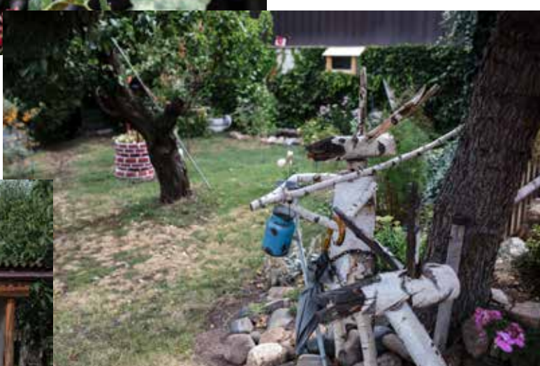
Kozel vyrobený z březového dřeva