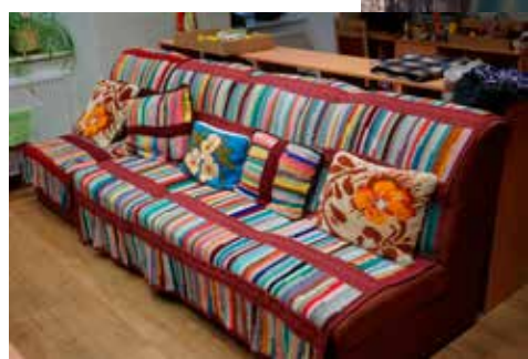
Přehoz a polštáře vznikly kombinací známých technik a materiálu, který byl po ruce

To mi bylo asi třicet. Tenkrát bylo moc práce, málo času a na nějaké traktůrek nebylo ani moc peněz. Tak jsem si udělal svůj. Sehnal jsem věci z kovošrotu, z burzy jsem koupil starého skútra, ze kterého jsem vyndal motor, starou zadní nápravu a plechy jsem posvařil, nářadí jsem měl svoje. A když už to potom jezdilo, což nebylo hned, to byl rok nebo dva, začal jsem vyrábět pluh, radlici, vlečku, které jsem zavěsil za traktor. Aby to motor utáhl, traktůrek má dvě převodovky. A kdyby se přeci něco porouchalo, mám k němu dva náhradní motory. Ten traktůrek jede tak rychle, že kdybyste mu chtěli stačit, musíte pěkně rychle utíkat. (Kutil, 80 let)