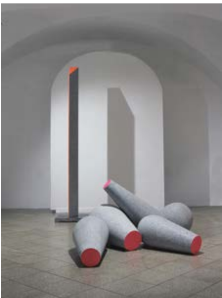
Lamento, žula, barva / Granit, Farbe, 5 ks / St., 75-100 cm

GAVU – Velká galerie / Grosse Galerie 3. 10. 2019 – 5. 1. 2020 Kurátor / Kurator Marcel Fišer Vernisáž ve středu 2. října v 17.00. 18. prosince v 17.00 přednáška autora o jeho práci.