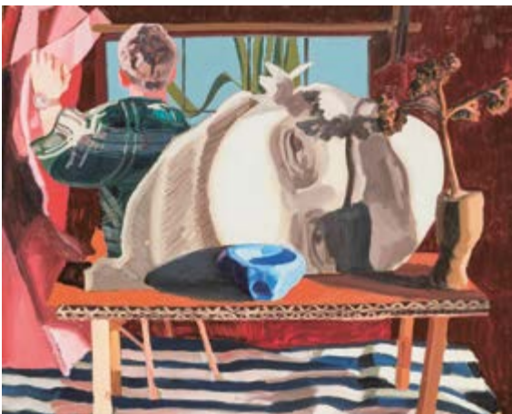
Zátiší s hlavou / Stilleben mit einem Kopf, 2017, olej na plátně / Öl auf Lnw., 130 x 160 cm

GAVU – Malá galerie / Kleine Galerie 19. 9. – 24. 11. 2019 Kurátor / Kurator Radek Wohlmut