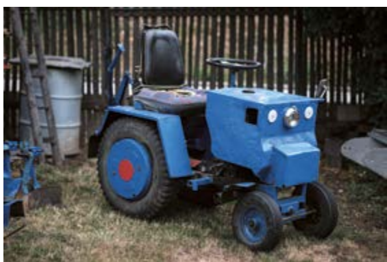
Kutilský traktůrek / Traktorchen

Retromuseum – Výstavní sál / Ausstellungssaal 24. 10. 2019 – 19. 4. 2020 Kurátor / Kurator Petr Gibas Vernisáž ve středu 23. října v 17.00. Výstava je připravena ve spolupráci se Sociologickým ústavem AV ČR.