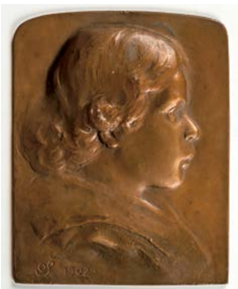
Hlava dívky / Kopf eines Mädchens, 1902, bronz / Bronze