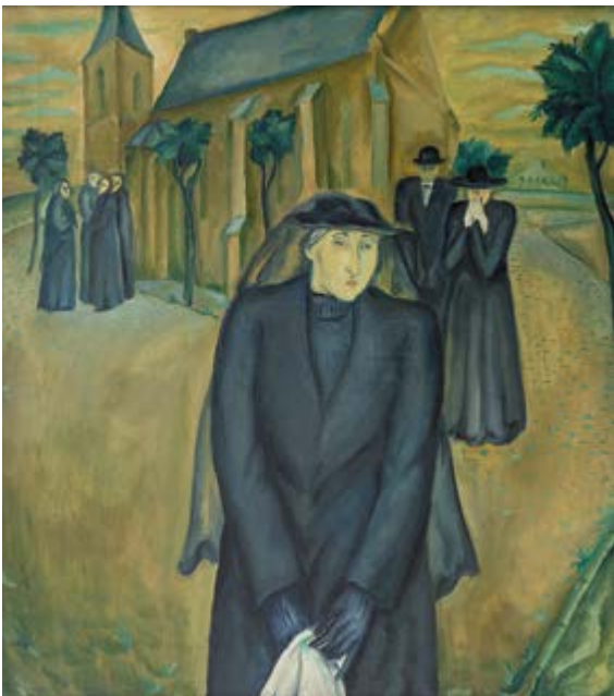
Vdova / Die Witwe, 1922, olej na plátně / Öl auf Lnw., 69 x 62 cm, GAVU Cheb

GAVU – Opus magnum 3. 10. 2019 – 12. 1. 2020 Kurátor / Kurator Marcel Fišer Vernisáž ve středu 2. října v 17.00.