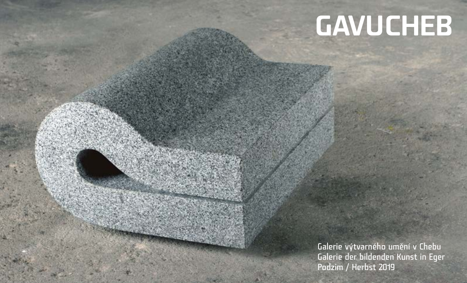
Galerie výtvarného umění v Chebu Galerie der bildenden Kunst in Eger Podzim / Herbst 2019