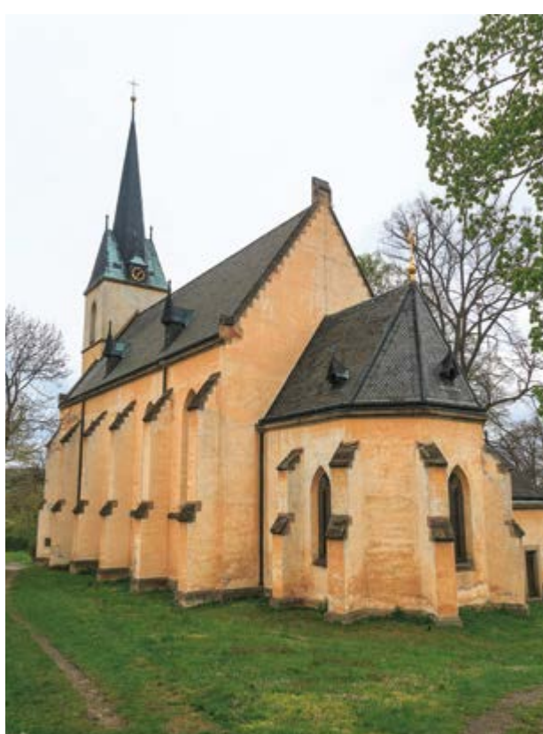
Kostel sv. Petra na Křivoklátě, foto ©Petri1888, https://commons.wikimedia.org , toto dílo je licencováno pod Creative Commons Attribution-Share Alike 4.0 International license