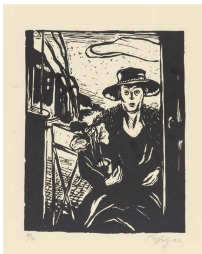
Miloslav Holý, Vdova, 1922, linoryt na papíru, rozměry, 12/30, GAVU Cheb

uvádí, že se stejným námětem zabýval už dřív. Během studií na Akademii „kreslí (...) válečnou Vdovu, kterou vystavuje poprvé r. 1920 na výstavě Spolku akademiků, upozorňuje