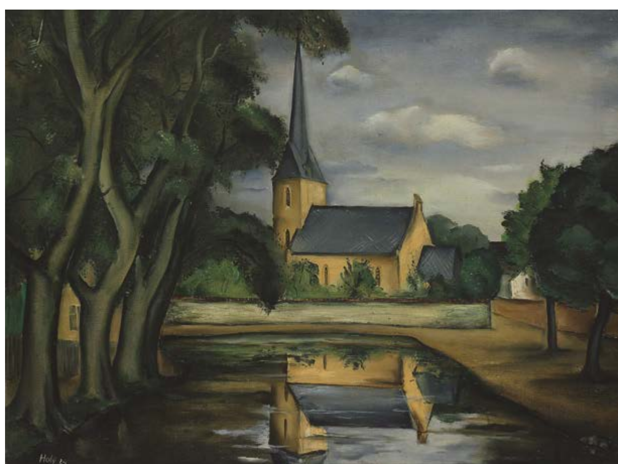
Kostel na Křivoklátě, 1924, olej na plátně, 60 x 81 cm, Oblastní galerie v Liberci, foto © OG Liberec