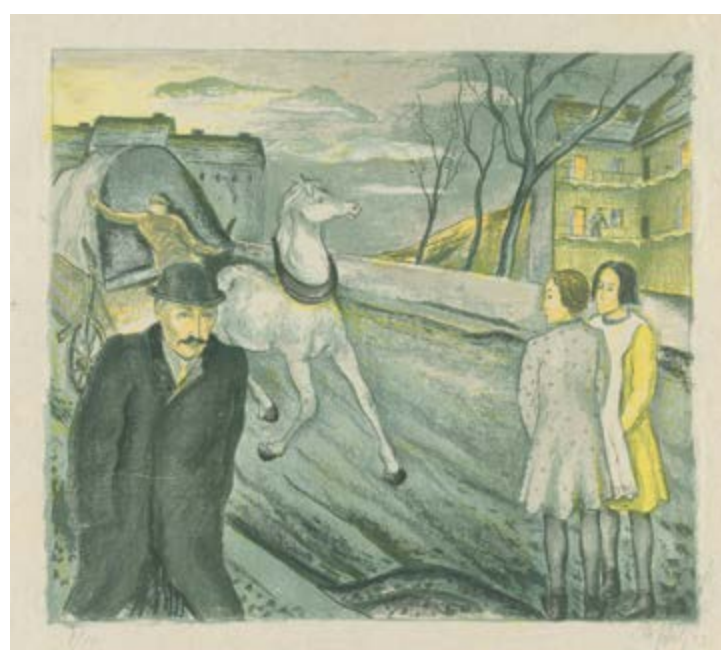
Miloslav Holý, Libeňská ulice, 1923, barevná litografie, ruční papír Japan, 305 x 345 mm, digitalizovalo AiP Beroun v Klementinu, ©GASK – Sběrka Galerie Středočeského kraje, Kutná Hora

Miloslav Holý, Vdova, 1922 GAVU – Opus magnum 3. 10. 2019–12. 1. 2020 Kurátor Marcel Fišer Vernisáž ve středu 2. října v 17.00.