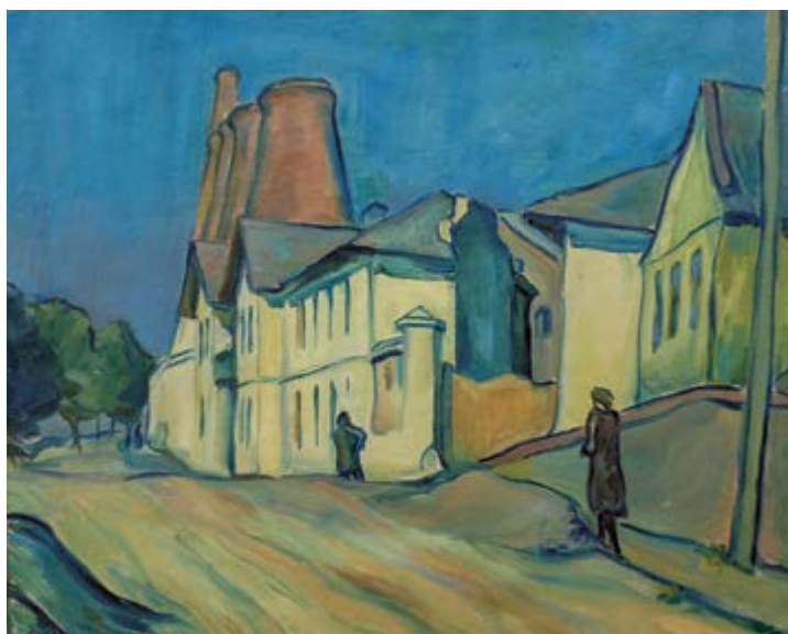
Miloslav Holý, Cementárna v Podole, 1921, olej na plátně, 63 x 69 cm, GAVU Cheb

Vyšehrad od Podolí a Cementárna v Podole, v nichž se Munchův vliv projevuje „... v zaoblených konturách figur a objektů a ve způsobu barevné traktace země“. 3 Posledně jmenovaný olej zobrazující zaniklou cementárnu, na jejímž místě dnes stojí známý plavecký stadion, se dnes nachází ve sbírce GAVU Cheb. A konečně také hlavní postavu dalšího obrazu z chebské sbírky Vdova (1922) popisuje slovy „osamělá existence dominující munchovským způsobem popředí“. 4 Autorka má nejspíš na mysli paralelu s jedním z nejslavnějších Munchových obrazů Smrt v pokoji nemocné (1893), s nímž jej vedle tématu smrti spojuje právě analogická kompozice: v prvním plánu se nachází výrazná ženská postava obrácená k divákovi, v pozadí pak mlčící černě oděné postavy ve smutku. Dalším munchovským prvkem je skutečnost, že k obrazu existuje jeho varianta v černobílém linorytu. Postava vdovy je na něm takřka totožná, pouze – což odpovídá převodu do grafiky – stranově převrácená. I tato práce se nachází ve sbírce GAVU Cheb, která mimochodem disponuje nejrozsáhlejší kolekcí Holého grafik z českých muzeí umění. Vedle toho existuje i odlišná varianta tohoto motivu ze stejného roku, zasazená do městského prostředí, Vdova s květináčem. Josef Císařovský v první monografii Miloslava Holého z roku 1959