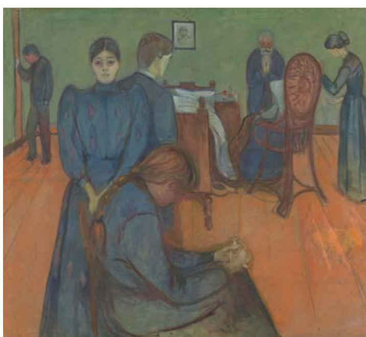
Edvard Munch, Smrt v pokoji nemocné, 1893, tempera, plátno, 152,5 x 169,5 cm, Nasjonalmuseet Oslo

vek, napodobit tohoto ‚násilníka snu‘, jsem později zničil.“ 2 Nicméně dodnes se několik obrazů vysloveně munchovského ražení zachovalo. Dagmar Mazancová ve velké Holého monografii z roku 2011 uvádí především obraz U Vltavy v Karlíně (1922) s ubíhající perspektivou připomínající kompozici slavného Výkřiku a dále dvě krajiny z roku 1921