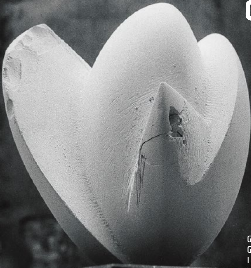
Galerie výtvarného umění v Chebu Galerie der bildenden Kunst in Eger Léto / Sommer 2019