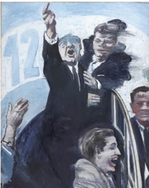
Jiří Načeradský, Bez názvu / O. T., 1967, olej na plátně / Öl auf Lnw., 162 x 130 cm, Alšova jihočeská galerie

GAVU – Opus magnum Kurátor / Kurator Marcel Fišer 27. 6. – 29. 9. 2019 Vernisáž ve středu 26. června v 17.00.