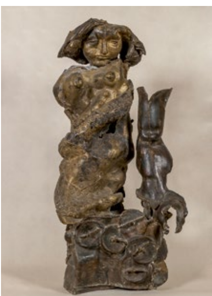
František Štorek, Noc / Die Nacht, 1975, bronz / Bronze, v. / H. 88 cm

GAVU – Výstava z depozitáře / Ausstellung aus dem Depot 13. 6. – 6. 10. 2019 Výstava vznikla ve spolupráci s Katedrou dějin umění FF UP v Olomouci v rámci semináře Tomáše Wintera.