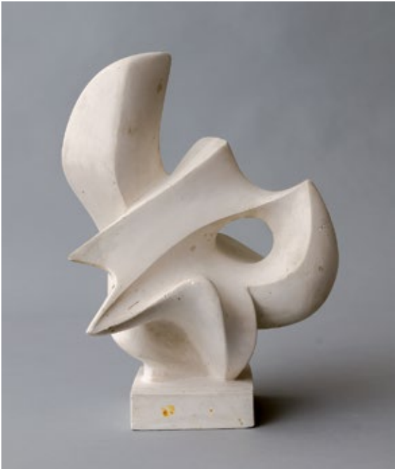
Bez názvu / O. T., 70. léta / 1970er Jahre, sádra / Gips