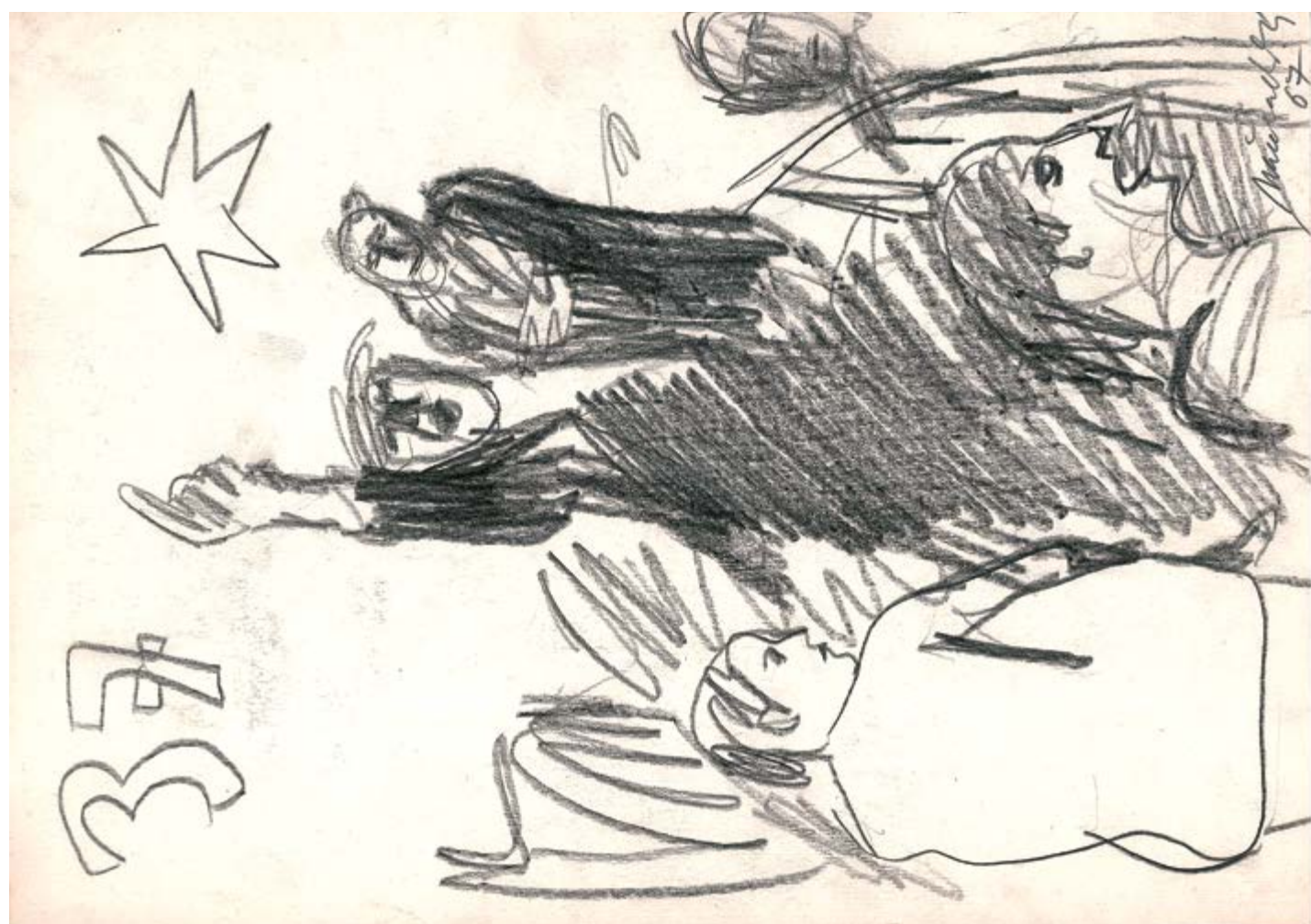
Johnson (skica k obrazu Bez názvu), 1967, pastelka na papíru, 41,8 x 29,7 cm, Galerie výtvarného umění v Chebu