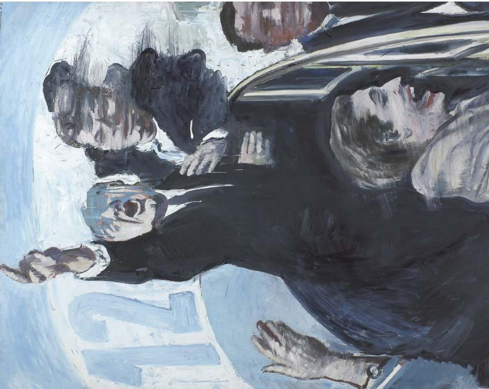
Bez názvu, 1967, olej na plátně, 162 x 130 cm, Alšova jihočeská galerie, foto@AJG