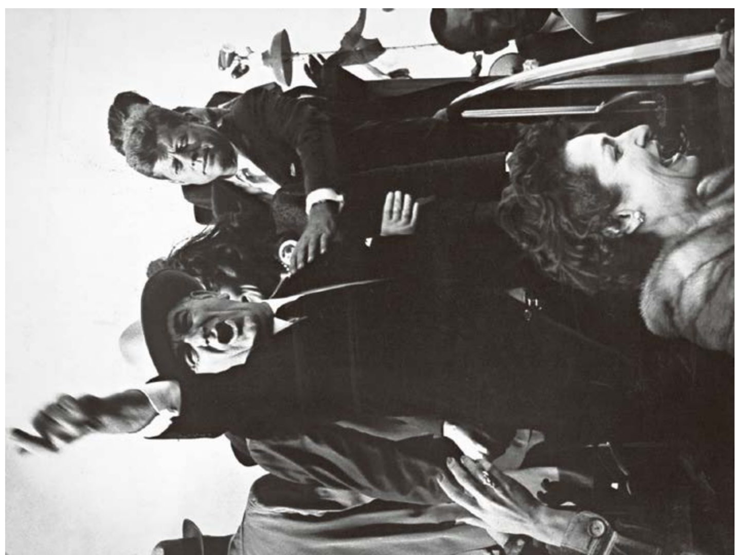
Richard Pipes, fotografie z prezidentské kampaně Johna F. Kennedyho, letiště v Amarillu, 2. listopadu 1960