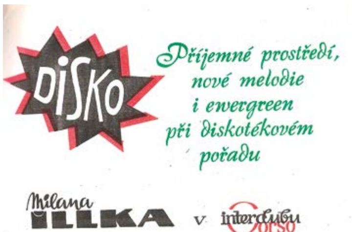
Leták k diskotéce v Interhotelu Corso v Mariánských Lázních