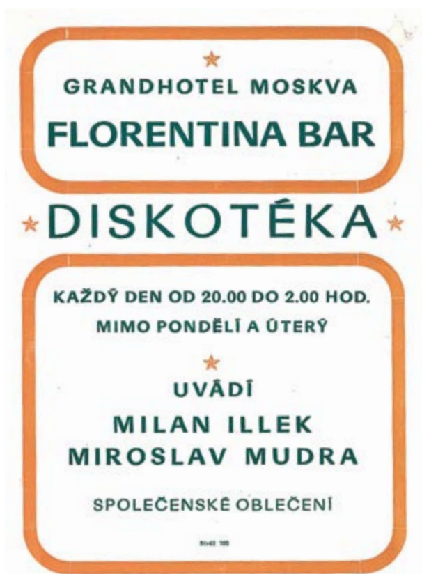
Leták k diskotékám v Grandhotelu Moskva, dnes Pupp v Karlových Varech, po roce 1982