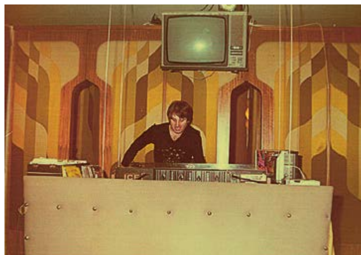
V Interhotelu Corso v Mariánských Lázních, kde působil od konce 70. let.