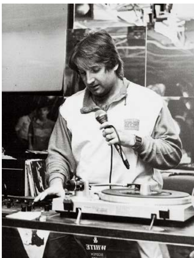
V Interhotelu Zlatá Husa v Praze působil v letech 1985 až 1987