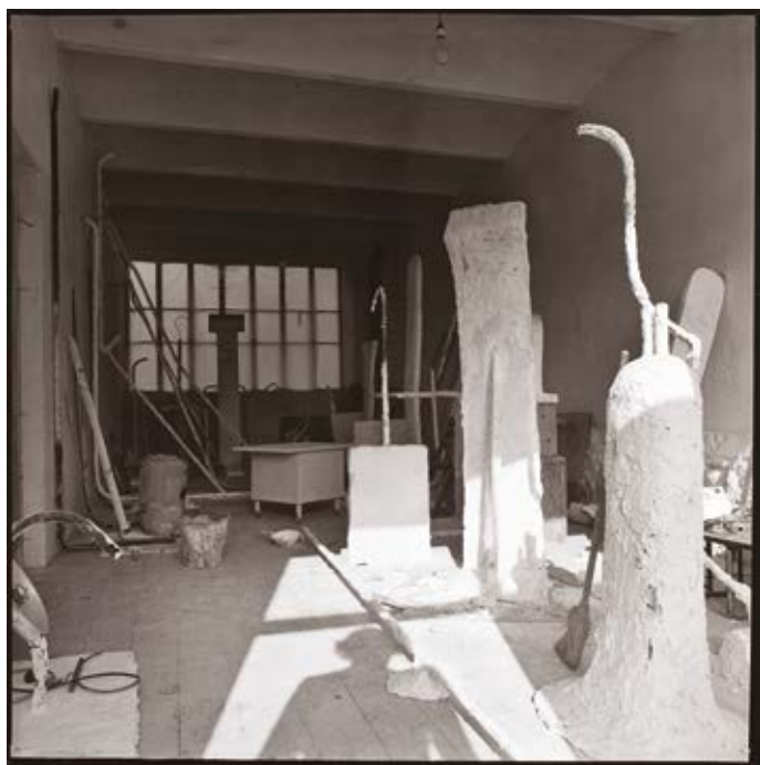
Jan Svoboda, Z ateliéru Z.P., 1975 bromostříbrná fotografie, 50,3 × 49,9 cm; inv. č. XIII-3308/33