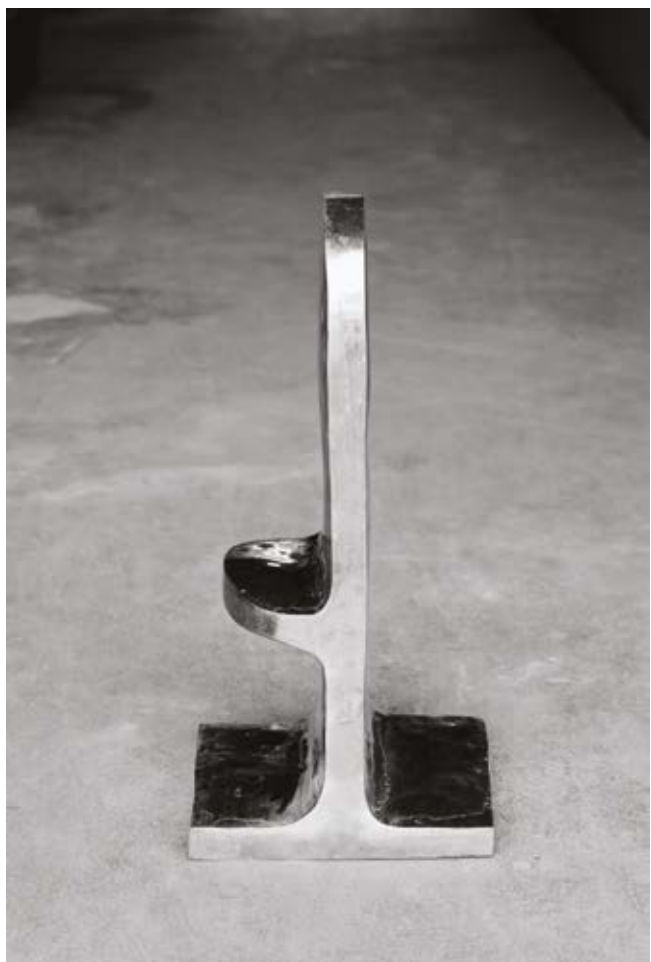
Jan Svoboda, Část figury Zdeňka Palcra (1967), 60. léta 20. stol. negativ, 9 × 6 cm; © soukromá sbírka; digitálně upravený scan © ÚDU AV ČR