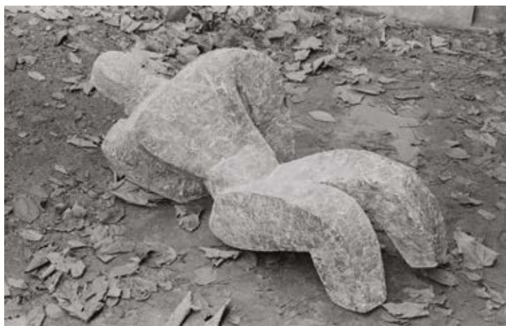
Jan Svoboda, Opřený muž Zdeňka Palcra (1959), 60. léta 20. stol. negativ, 6 × 9 cm; © soukromá sbírka; digitálně upravený scan © ÚDU AV ČR

Aktuální výstava obou autorů otevírá také novou cestu průzkumu jejich díla, vzájemných vztahů i společných témat, kde se jejich tvorba protínala, přičemž se zaměřuje specificky na Svobodovu fotografickou interpretaci Palcrových soch. Po dlouhé době více než dvaceti let, jež uplynuly od poslední Palcroy souborné výstavy, nabízí zároveň pohled na větší výběr jeho soch z průřezu Palcroy tvorby od modernisticky stylizovaných prací padesátých a začátku šedesátých let až po jeho typické abstrahované figury. Právě prostřednictvím fotografií výstava představuje i sochy již zaniklé anebo veřejnosti nepřístupné. Jsou zde zastoupeny všechny polohy Svobodovy práce pro Zdeňka Palcra, od jednotlivých soch až po pohledy do ateliérů. Vedle nich jsou vystaveny také Svobodovy volné výtvarné fotografie, jeho dokumentace prací dalších sochařů (Stanislava Kolíbal, Stanislava Podhrázkého, Olbrama Zoubka) a konečně dokumenty či korespondence osvětlující přátelství i pracovní vztah Svobody a Palcra. Výstavu uzavírá dokumentární video s rozhovory se třemi pamětníky, přáteli či kolegy obou autorů – Jaromírem Zeminou, Stanislavem Kolíbalem a Jiřím Plieštikem.