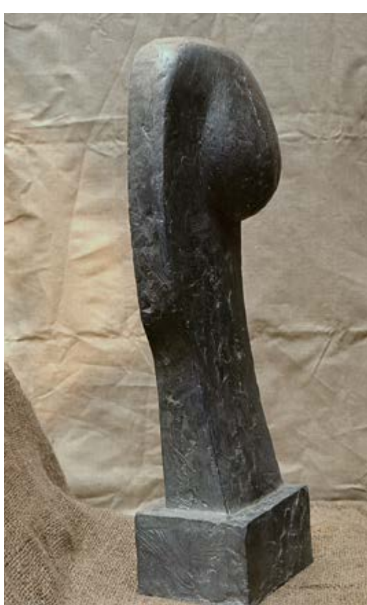
Hlava, 1969–1970, cín, olovo, v. 55 cm, majetek autora