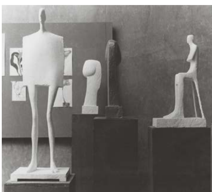
Pohled do výstavy diplomových prací na AVU v Praze, 1970, zleva: Stojící figura, 1970, sádra, v. 138 cm, majetek autora; Hlava, 1969–1970, sádra, v. 55 cm, soukromá sbírka; Hlava, 1969–1970, cín, olovo, v. 55 cm, majetek autora; Sedící figura, 1969–1970, sádra, v. 83 cm, Muzeum umění Olomouc, P 1160