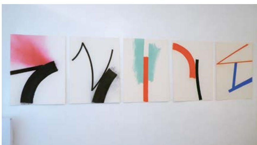
Kresby z Yadda, 1987, uhlí, pastel, papír, 76,5 × 56 cm, majetek autora