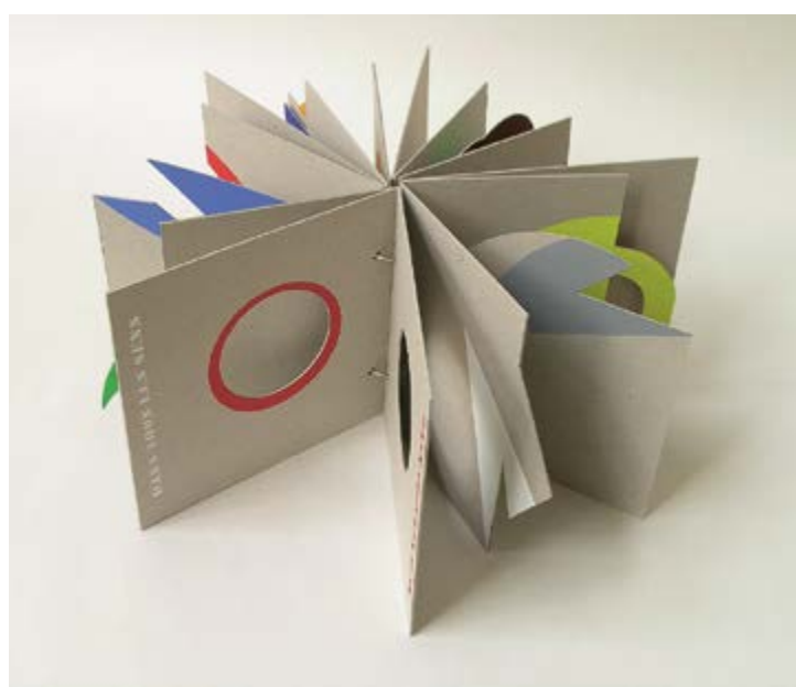
Všemi směry, 2007, malba šablonami na kartonu, 15,5 × 15,5 cm, majetek autora