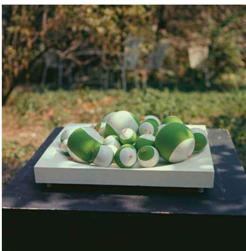
Deska s koulemi, 1976, pomalovaná misové vydlabaná dřevěná deska, 38 x 47,5 x 7,5 cm, 38 pomalovaných koulí z korku, průměr 3,5–11 cm, majetek autora