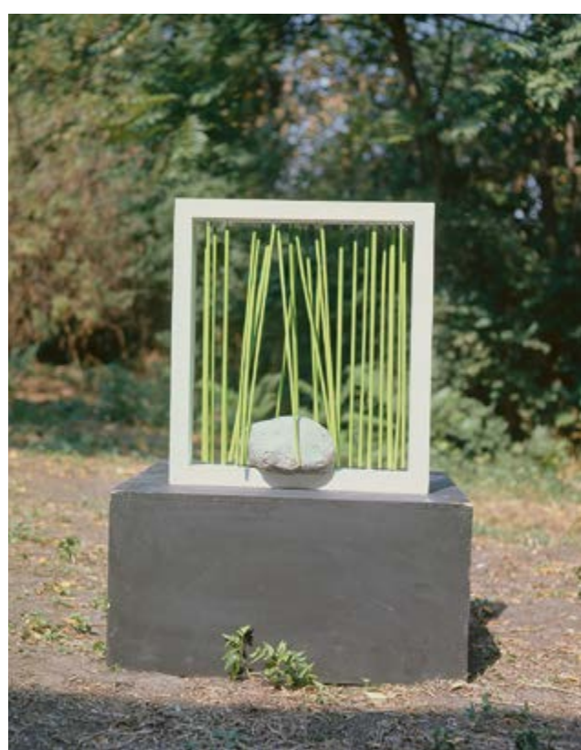
Rám s valounem, 1976, pomalované dřevo, kámen a další materiály, 56 x 50,5 x 7 cm, majetek autora