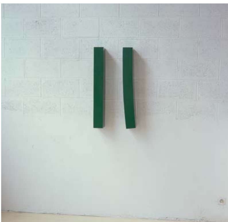
S 18/1981, lakovaná překližka, 85 × 10 × 14 cm, Galerie B. Rejta v Lounech, PG 258

Zpředu: S 1/1985, lakovaná překližka, 95 × 100 × 10 cm, majetek autora; S 4/1985, lakovaná překližka, 70 × 90 × 12 cm, Galerie B. Rejta v Lounech, PG 259; na zdi: S 4/1986, lakovaná překližka, 56 × 34 × 9 cm, soukromá sbírka