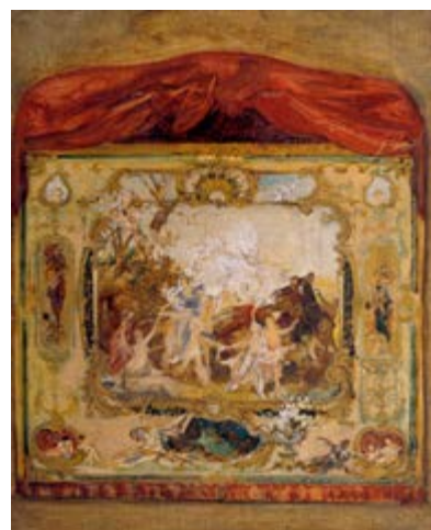
Gustav Klimt, Návrh na oponu Městského divadla v Karlových Varech / Entwurf zu einem Vorhang des Stadttheaters Karlsbad, 1884/1885, Österreichische Galerie Belvedere, Vídeň / Wien, Leihgabe des Vereins der Freunde der Österreichischen Galerie Belvedere

31. října v 17.00 komentovaná prohlídka s kurátorem výstavy