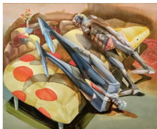
Michael Rittstein, Levitace našikmo / Die schräge Levitation, 1982, olej na sololitu / Öl auf Lnw., 122 x 160 cm.