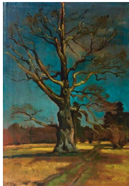
Nejedlý Otakar, Dub v Lánech / Die Eiche in Lány, olej, plátno / Öl, Lnw., 90 x 61,5 cm, GAVU Cheb

24. října v 17.00 přednáška M. Zachaře „Otakar Nejedlý“