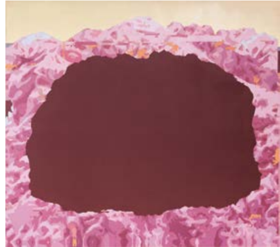
Georg Pinteritsch, Haoot (Haootia), 2016, olej na plátně / Öl auf Leinwand, 175 x 195 cm