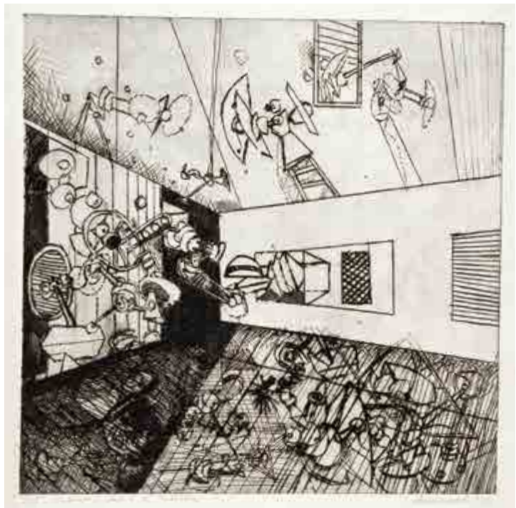
Jiří Načeradský, Moderní balet z Mexika , 1973, suchá jehla, 2/5, 49 × 49 cm, G 675, získáno v roce 1975.