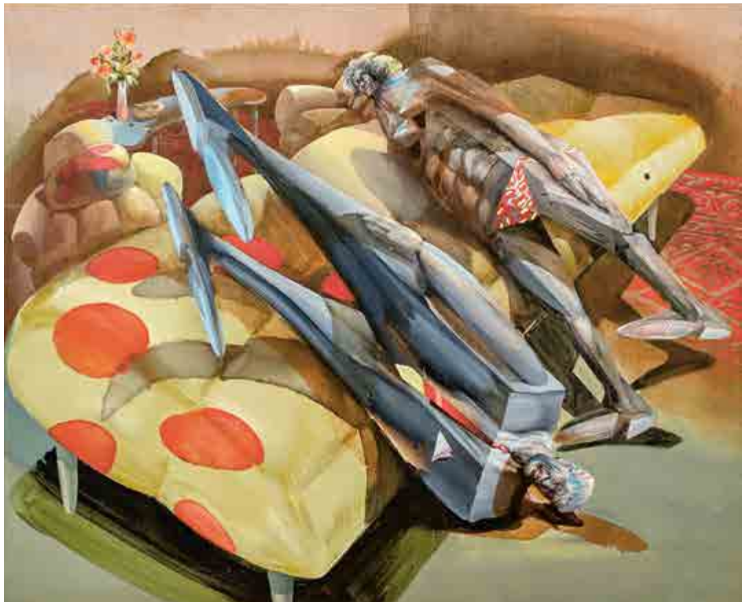
Michael Rittstein, Levitace našikmo , 1982, olej na sololitu, 122 × 160 cm, O 722, získáno v roce 1988.