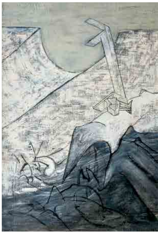
Petr Pavlík, V údolí (Živočich a věc), kaseinová tempera, plátno na dřevě, 1979, O 700, získáno v roce 1992.