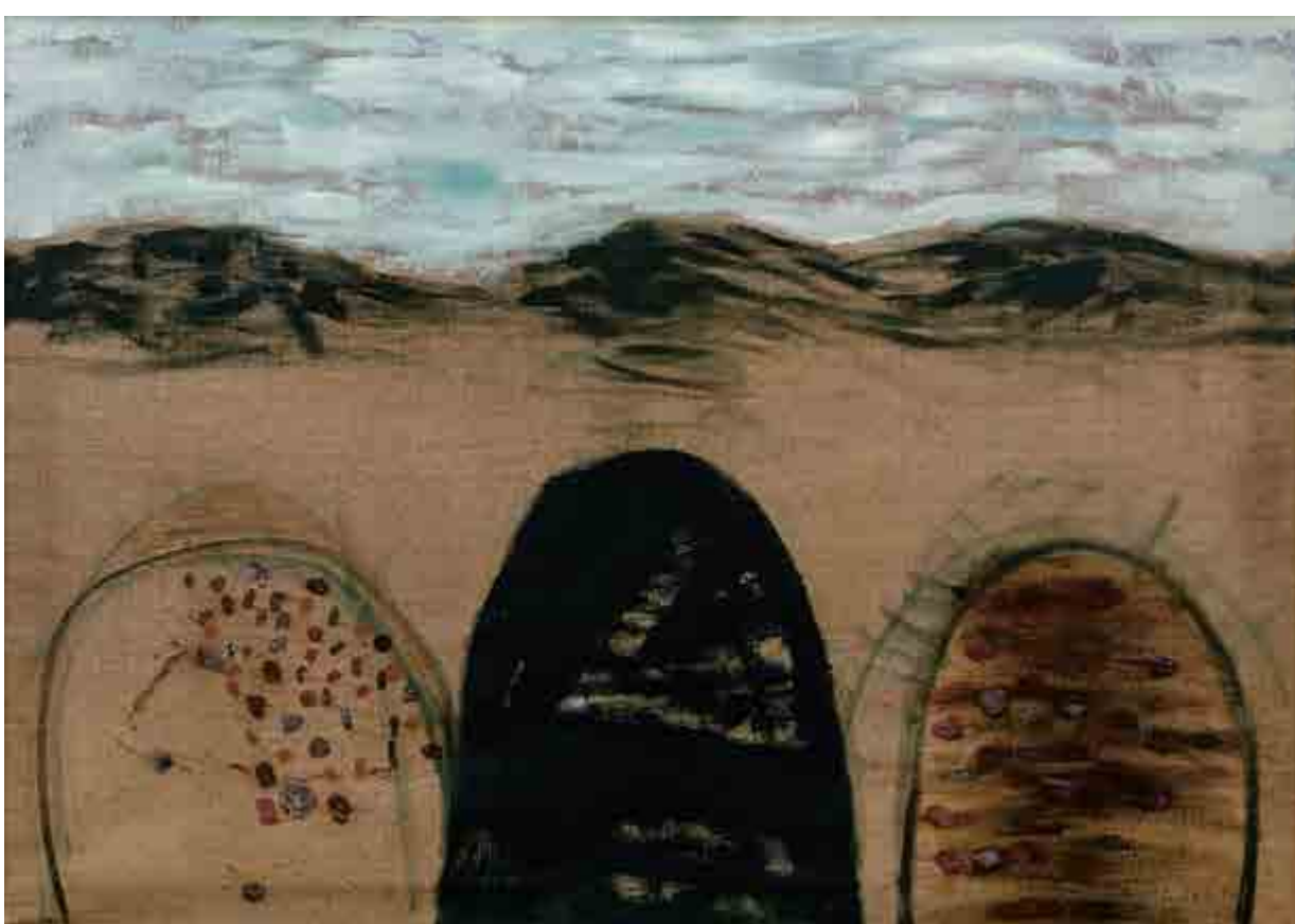
Ivan Ouhel, Zdvojená krajina, 1985, olej na plátně, 60 x 85 cm, O 623, získáno v roce 1986.