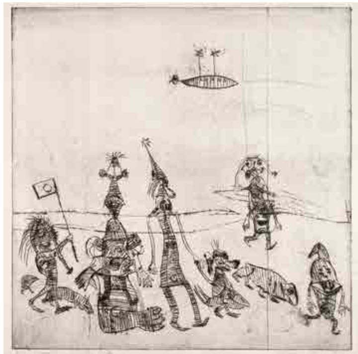
Jiří Načeradský, Návrat z žitného pole , 1972, suchá jehla, 1/5, 47,5 × 47 cm, G 674, získáno v roce 1975.