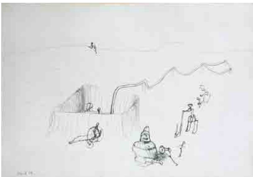
Petr Pavlík, Vládce, 1979, tužka na papíru, 65 x 92,5 cm, K 454, získáno v roce 1992.