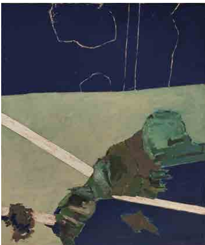
Ivan Ouhel, Noční krajina, 1975, kombinovaná technika na plátně, 160 x 125 cm, O 631, získáno v roce 1986.