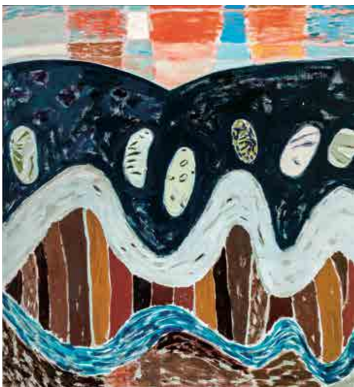
Ivan Ouhel, Fazole, 1986, olej na plátně, 130 x 120 cm, O 666, získáno v roce 1988