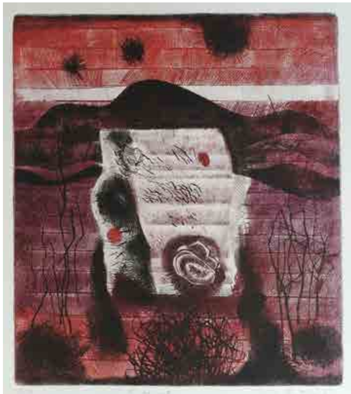
Tomáš Švéda, Krajina , 1981, kombinovaná technika na papíru, 20/40, 30 × 27 cm, G 928, získáno v roce 1983.