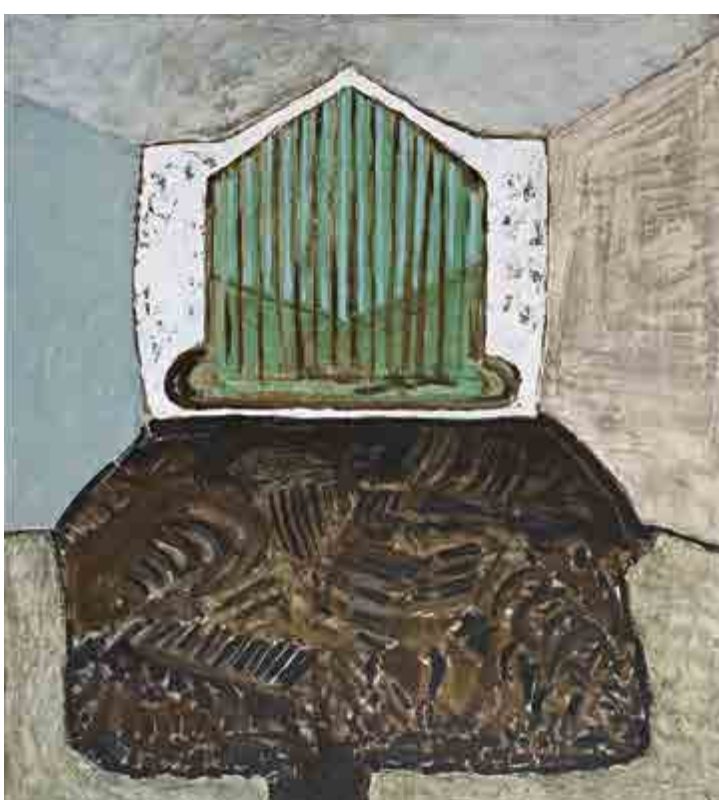
Ivan Ouhel, Varhany, 1984, olej na plátně, 150 x 135 cm, O 630, získáno v roce 1986. Titulní strana: Petr Pavlík, Plán, 1979, kvaš na papíru, 104 x 74 cm, K 455, získáno v roce 1992.

Volné seskupení 12/15 ve sbírce GAVU Cheb Výstava z depozitáře 14. 6.–4. 11. 2018 Kurátor Marcel Fišer Otevírací doba: út–ne, 10.00–17.00