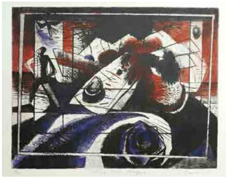
Tomáš Švéda, Okna (z cyklu České zahrady ), 1981, kombinovaná technika na papíru, 15/50, 29 × 37 cm, G 927, získáno v roce 1983.