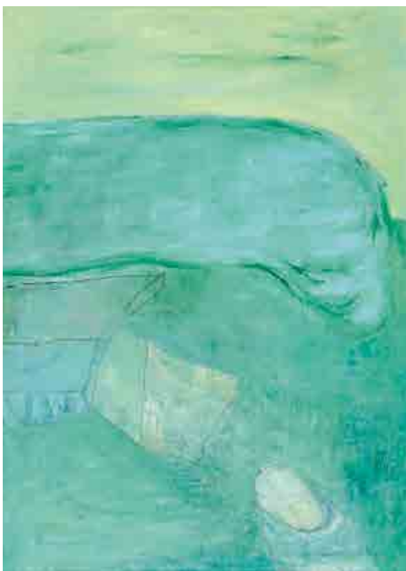
Petr Pavlík, Krajina ze severu (Chladná krajina), 1976, olej na plátně, 90 x 65 cm, O 532, získáno v roce 1981.