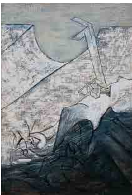
Petr Pavlík, V údolí / Im Tal, 1979, olej na dřevě / Öl auf Holz, 124 x 186 cm, GAVU Cheb

Výstava představuje dosud poněkud opomíjenou skupinu fotografií, vytvořených v Československu v průběhu padesátých a šedesátých let 20. století. Jedná se o relativně krátkou epizodu nenápadně „vloženou“ mezi degradaci média v rámci socialistického realismu a naopak jeho výrazné vzepětí v šedesátých letech. Díky svému masovému rozšíření v rámci tisku a knih tehdy domácí fotografii opanovaly snímky, pro něž se později vžil pojmenování „fotografie všedního dne“ či „poezie všedního dne“.