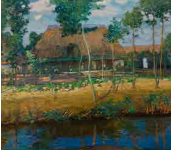
Antonín Hudeček, Chalupy / Bauernhöfen, 1906, olej na plátně / Öl auf Lnw., 80 x 90 cm