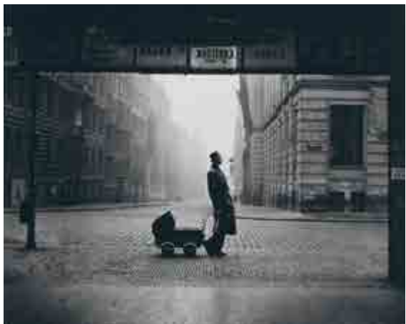
Milada Einhornová, Není lehké být otcem / Ein Vater zu sein, ist nich leicht, 1955, Moravská galerie v Brně

Ve středu 13. června v 17.00 komentovaná prohlídka s kurátorem.