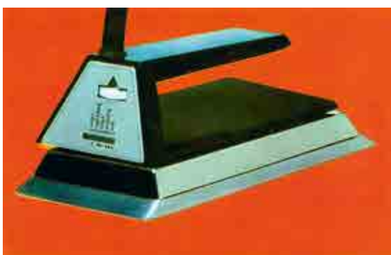
Žehlička / Bügeleisen ETA 211, návrh / Design Stanislav Lachman