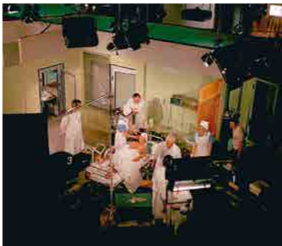
Z natáčení operace Přemysla Rezka (Viktor Preiss) / Aus den Dreharbeiten, die Operation von Přemysl Rezek (Viktor Preiss)