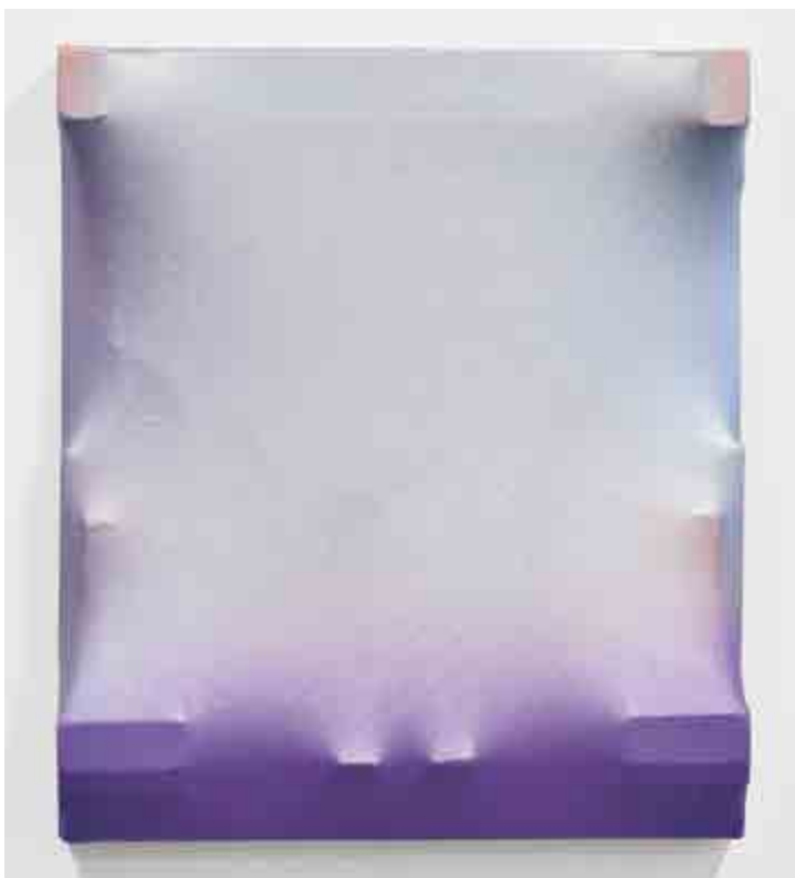
Petr Dub, Yes or No to Purple, 2014, akryl, syntetické laky, dřevo, plátno, 64 × 56 × 11 cm Dar autora v roce 2016.

Petra Herotová (1980) tvoří v různých médiích, tím nejpriznáčnejším však pro ni je kresba, která má podobně jako celá její práce konceptuální přesahy. Její kresby tematizují současný svět a některé charakteristické aspekty jeho vizuality, aniž by nesly nějaké prvoplánové poselství třeba ve smyslu sociální či jiné kritiky. V tomto cyklu například zobrazovala spotřební zboží pokryté dekory odvozenými z děl klasiků moderního umění; zde konkrétně jsou to imaginární pouzdra mobilů s motivy suprematistických kompozic Kazimira Maleviče.