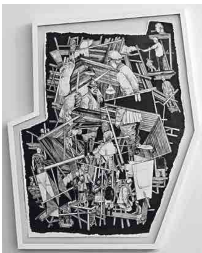
Jiří Franta, David Böhm, Nikoho nepotkáš, ale uvidíš je všechny, 2014, tužka na papíru, 116 × 103 cm Dar autorů v roce 2017.

Duo Jiří Franta (1978) a David Böhm (1982) pracuje téměř výhradně v médiu kresby, která je však pro ně nejen technikou, ale i tématem nejrůznějších průzkumů a experimentů, když štětce upevňovali například na lžici bagru nebo na konec provazochodcovy tyče. Vedle těchto performancí se ale zabývají i kresbou zcela klasickou, na níž zpravidla pracují oba současně, případně se při práci střídají. I přes toto dvojité autorství, které v klasických technikách představuje zcela ojedinělý fenomén, si dokázali vytvořit osobitý, snadno rozpoznatelný styl v rukopisu i v tematice svých tužkových kreseb.