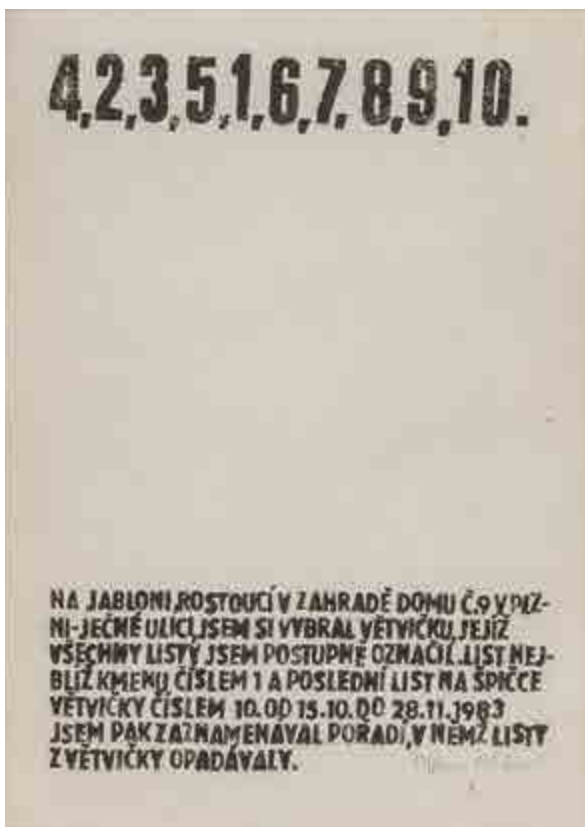
Milan Maur, Opadávání listů jabloně, 1983, tisk na papíru, 42 × 30 cm Zakoupeno od autora v roce 2017.

Série Zdi z let 1982 až 1984 hraje v tvorbě plzeňského malíře Václava Maliny (1950) zásadní roli v přechodu od expresivní krajinomalby k obrazům, jež se ke krajině vztahují jiným, nezobrazujícím způsobem a jejich vlastní téma už spočívá v čistě malířské oblasti. Kompozice tvořené barevnými, zhruba pravoúhlými poli opravdu volně evokují zdi s oprýskanými omítkami, zároveň už působí jako zcela abstraktní obrazy, což autor podpořil zdůrazněním plošnosti a naopak eliminací všech malířských nástrojů k vyvolání iluze prostorové hloubky.