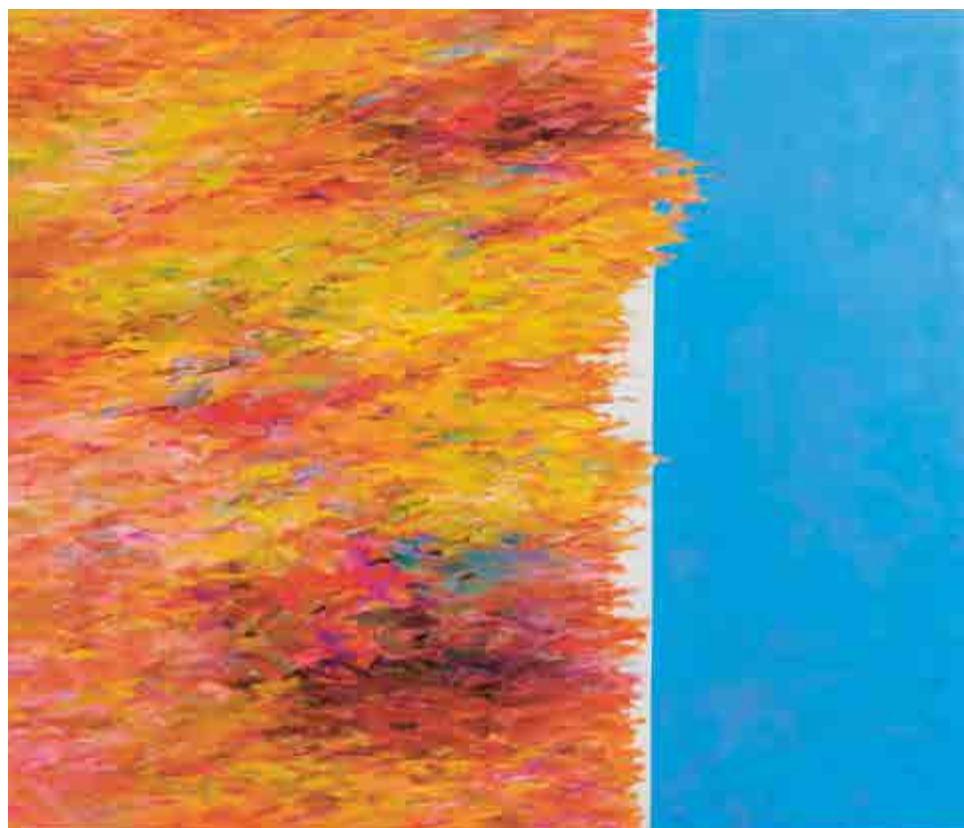
Václav Malina, Podzimní (z cyklu Vzpomínky na impresionismus ), 1986, olej na plátně, 129 × 150 cm Zakoupeno od autora v roce 2017.