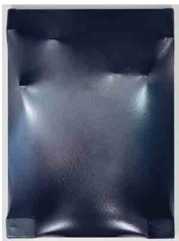
Petr Dub, Hluboko v zelené, 2011, akryl, syntetické laky, dřevo, plátno, 55 × 49 × 9 cm Dar autora v roce 2016.