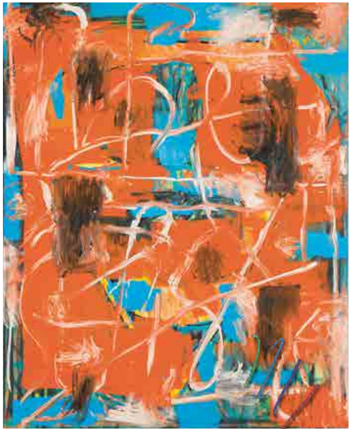
Martin Lukáč, Bez názvu, 2017