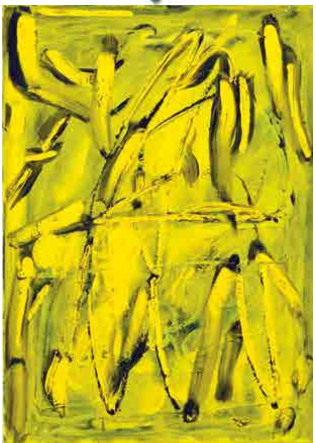
Martin Lukáč, Bez názvu, 2017