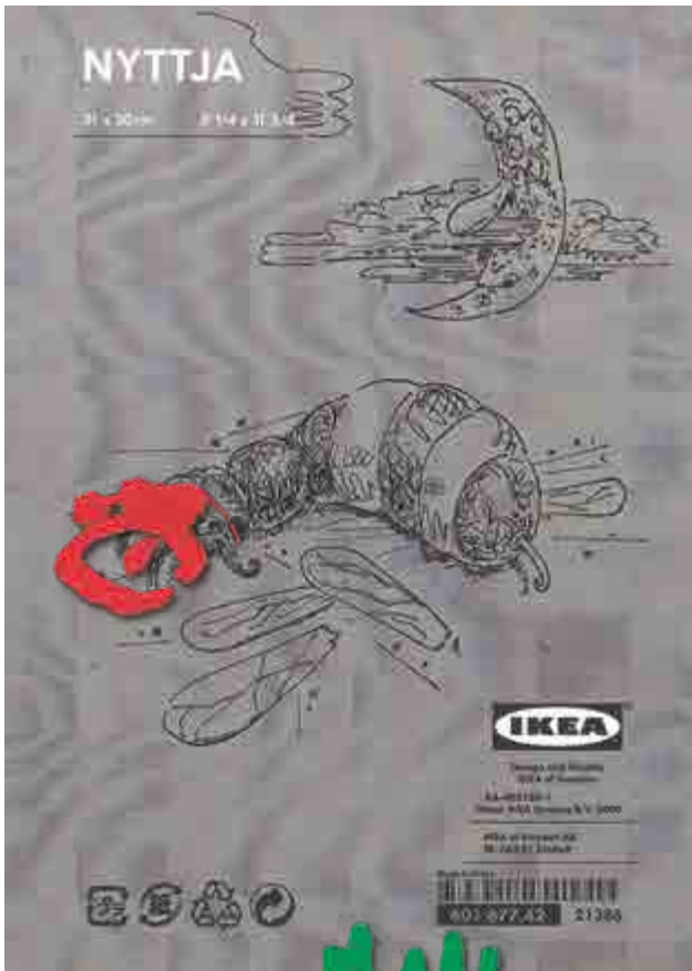
Marek Meduna, S vědomím snů, 2017