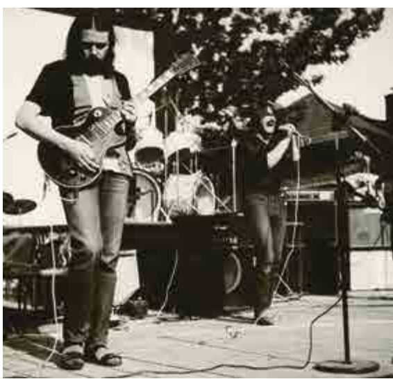
Skupina Radikál, začátek 80. let / Die Gruppe Radikal, Anfang der 80er

Ve středu 14. března v 17.00 derniéra výstavy spojená s koncertem skupiny Rockin Veterans.