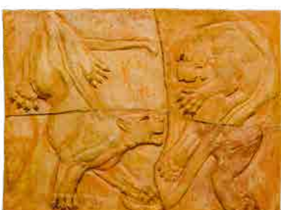
Michael Gabriel, z cyklu reliéfů pro pavilon šelem pražské ZOO / aus der Serie von Reliefs für den ZOO in Prag, 1987, keramika / Keramik, 88 x 119 cm

Ve středu 17. ledna v 17.00 komentovaná prohlídka s kurátorem. Ve středu 14. února v 17.00 setkání s několika výtvarníky zastoupenými na výstavě, povídání o jejich práci a jejich studiu na AVU.