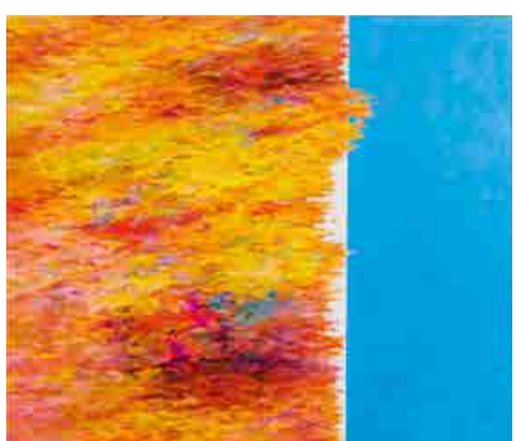
Václav Malina, Podzimní (z cyklu Vzpomínky na impresionismus) / Herbstlich (aus der Serie Erinnerungen an den Impressionismus), 1986, olej na plátně / Öl, Lnw., 129 x 150 cm