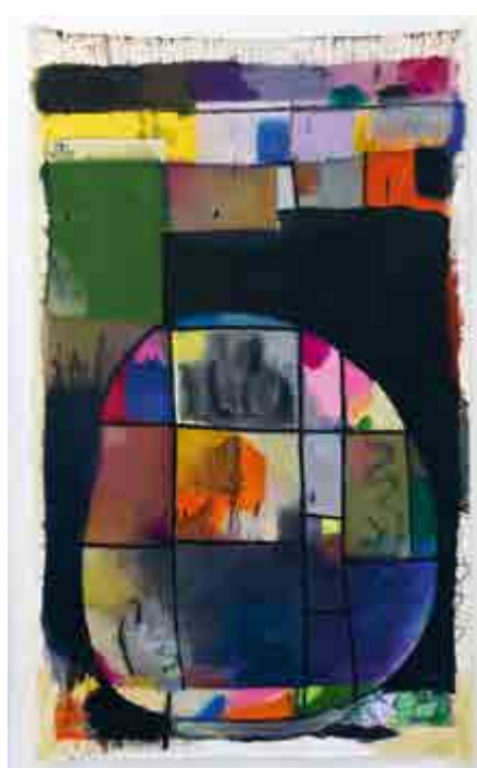
Ze série / Aus der Serie Namby Panby Nation, 2017

Julius Reichel (1981), absolvent ateliéru intermediální konfrontace Jiřího Davida na pražské UMPRUM (2017), se na výtvarné scéně pohybuje již několik let. Jestliže jeho předchozí práce problematizovaly především fenomén obrazu směrem k objektu nebo instalacním situacím, teď se zase na čas vrátí k čistě malbě. Zůstává pro něj otevřeným systémem vizuálního uvažování opřeným o vlastní ověřené postupy a barevná schémata, prokládaným novými impulzy, intuíci, automatismem a neřízenými zásahy náhody. Pro Julia Reichela nic jiného než malování nemá příliš smysl. Proces malby včetně odhadování okamžiku, kdy z rozpracovaného plátna vystoupit, je pro něj často zajímavější než finální výsledek. V mládí prošel komunitou graffiti, jehož některé principy jsou v jeho práci trvale přítomné. Právě odtud pravděpodobně pramení jeho přirozené obrazoborectví, které se navenek projevuje třeba jako malování na obnošené šaty – svetry, džíny a pánská saka, nebo tím, že přibíjí pomalovaná plátna bez blindramů rovnou na zeď. Jeho práce v sobě směřují aspekty abstraktní i realistické malby. Volně navazují na vizuální odkaz amerického nepředemětného malířství ve smyslu Barnett Newmana a Marka Rothka konfrontovaný s novými tendencemi postinternetové doby.