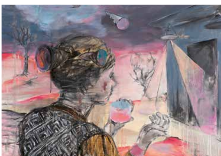
Obrácená dlaň, 2017, olej na plátně, 70 × 100 cm.