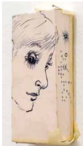
Rozpad, koláž a malířská intervence na stěnách galerie, 2017 (celek a detail).