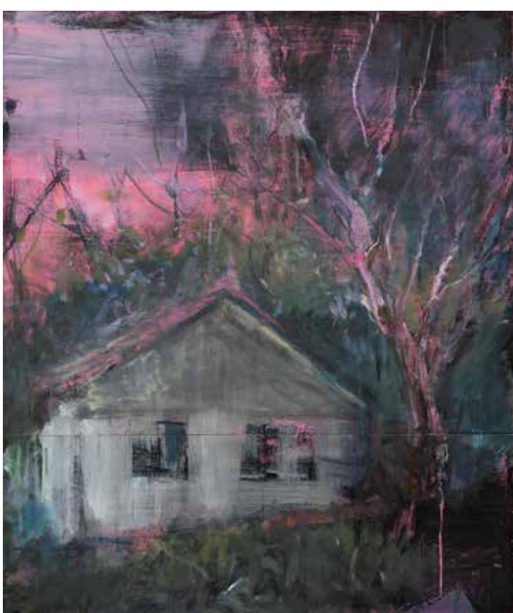
Chata v lese, 2015–16, akryl, olej, tuš a papír na plátně, 100 × 85 cm.