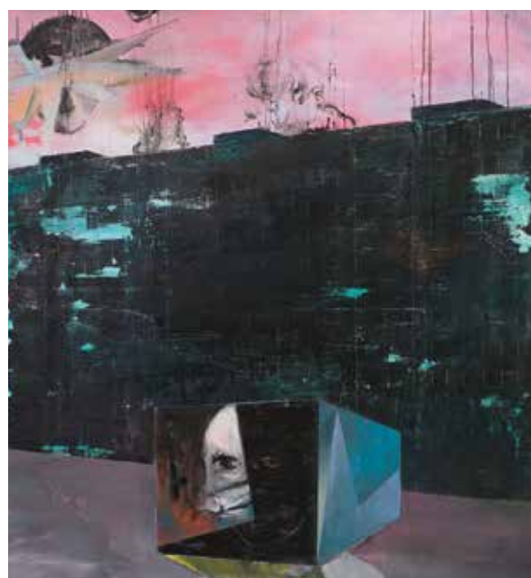
Další tváře, 2017, akryl, olej, tuš a papír na plátně, 115 × 105 cm.