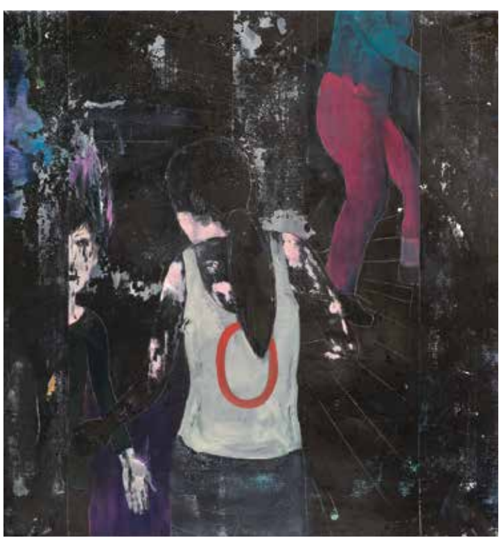
Točité schodiště, 2017, olej, tuš a papír na plátně, 85 × 80 cm.