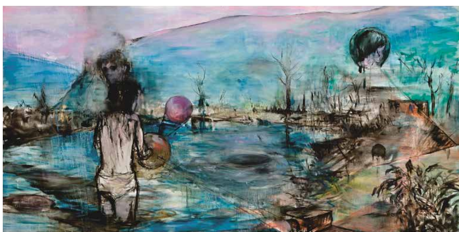
Neznámé světy, 2017, olej na plátně, 150 × 300 cm.