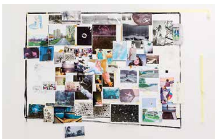
Kdo je kdo?, koláž a malba na stěně galerie.