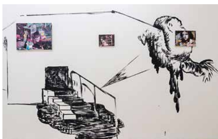
Pohled do výstavy s malbou na stěně galerie, do níž jsou zapojeny autorovy obrazy.