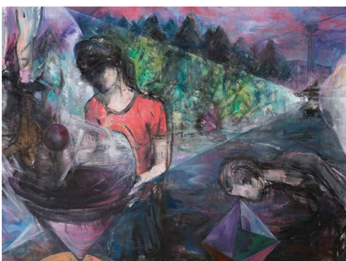
Nula, 2017, akryl, olej, tuš a papír na plátně, 150 × 200 cm.