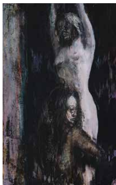
Upírky, 2014, olej, tuš a papír na plátně, 57 × 36 cm.