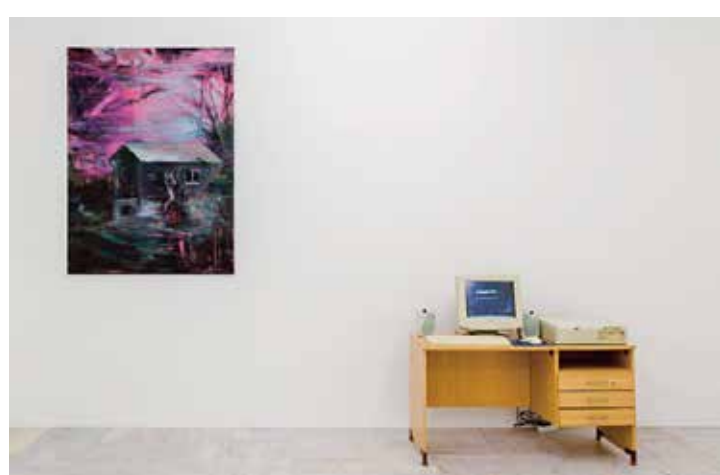
Pohled do instalace s obrazem Přiblížení (2016–2017, 150 × 110 cm, akryl, olej, tuš a papír na plátně) a zvukovou instalací Ty (2016–2017, spolupráce Lukáš Jiříčka a Tomáš Procházka).