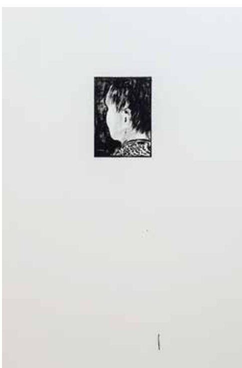
Jinam, malba na stěně galerie.