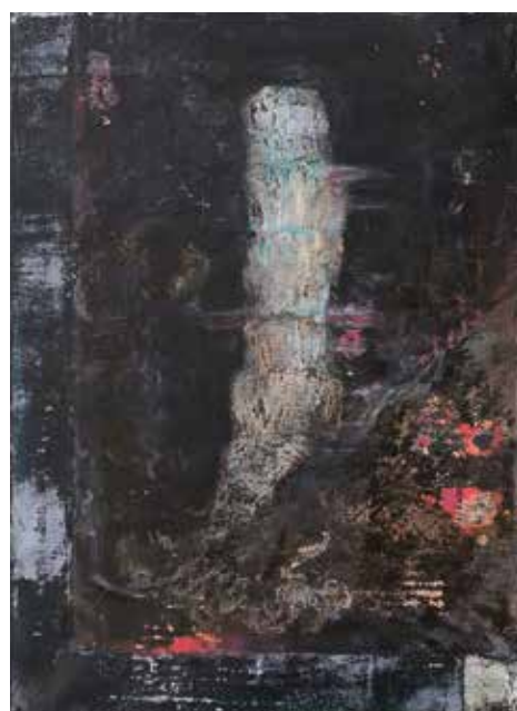
Jeskyňe, 2017, olej a tuš na plátně, 55 × 40 cm.