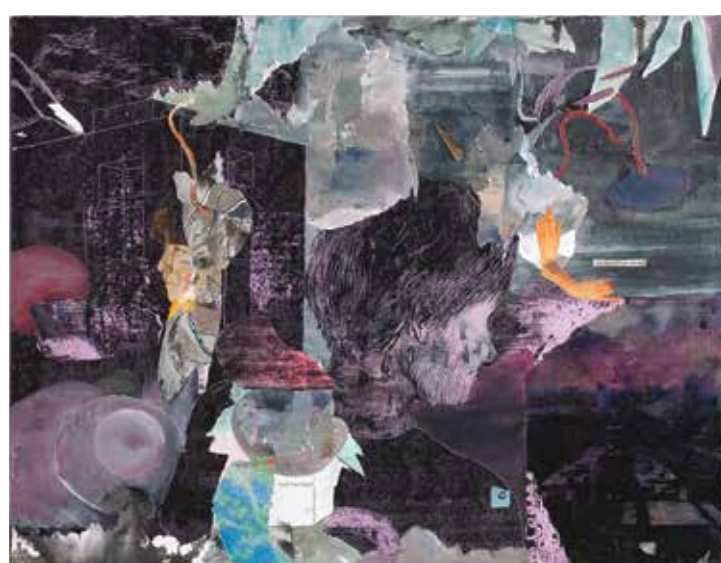
Ale nevdí, 2015, olej, tuš a papír na plátně, 42 × 55 cm.