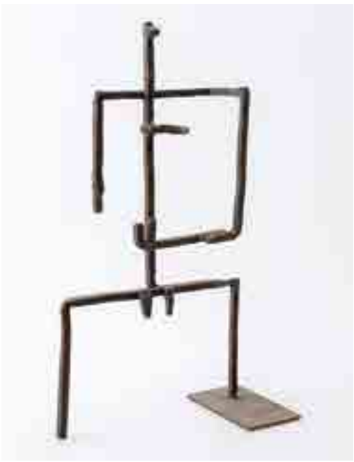
Postava / Figur, kol. / um 1960, kov / Metall, GAVU Cheb

Ve středu 13. září v 17.00 komentovaná prohlídka s kurátory výstavy.