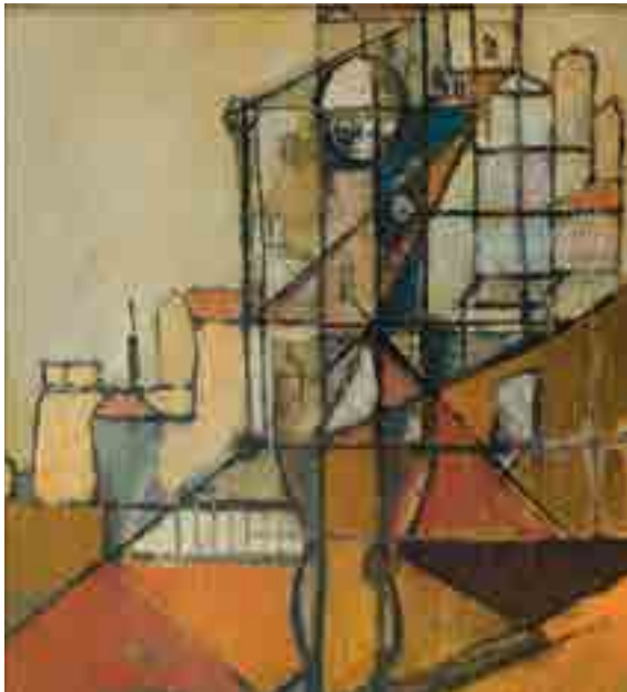
Bohumil Matal, Kompozice / Komposition, 1947, olej, lepenka / Öl, Pappe, 43 x 40 cm