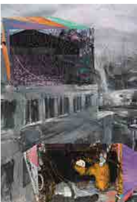
Konec dní I.a / Das Ende der Tage I.a, 2015–16, 95 x 65 cm, olej, akryl a papír na plátně / Öl, Acryl und Papier auf Lnw.

Kdyby byl někdo postaven před hypotetický úkol vybrat právě jeden obraz či kresbu, která by reprezentovala generaci narozenou v sedmdesátých letech, nepochybně by nakonec zvolil dílo Josefa Bolfa. Intimní zde vstupuje do kolektivního a zase zpět, sdílíme společný základ a přitom jsme na to sami. Dokážeme časově určit fragmenty prostředí jeho obrazů, velmi často scenérie panelových sídlišť, atmosféru ztotožnit s konkrétním odkazem na klasickou i pokleslou kinematografii, literaturu nebo komiks. Zkrátka nic extra překvapivého, jen se od toho nedokážeme odtrhnout.