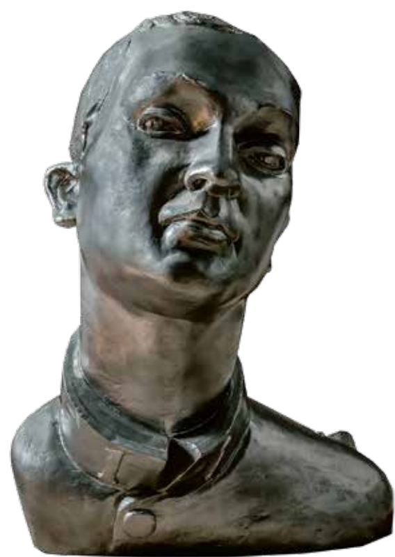
Václav Živec, Model poprsí Josefa Jonáše, druhá verze modelu, 1928, patinovaná sádra, Muzeum Českého krasu v Berouně.