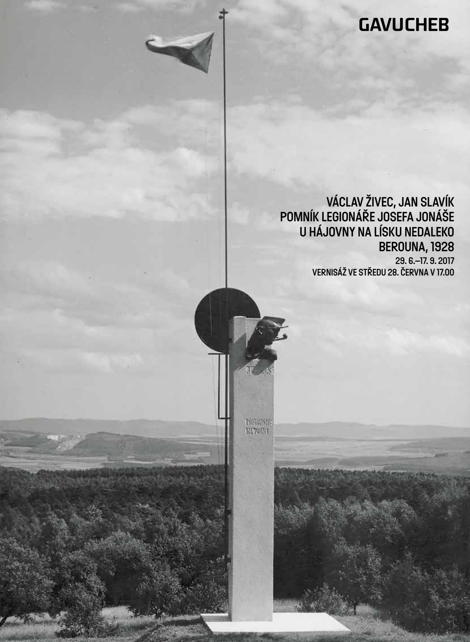
Pomník Josefa Jonáše, 1928, bronzové poprsí na betonovém soklu, kotouč z rubínového skla, ocelový pobronzovaný stožár pro státní vlajku, pilíř 4,5 × 0,6 × 0,6 m, stožár 9,4 m, SOKA Beroun.

29. 6.–17. 9. 2017 VERNISÁŽ VE STŘEDU 28. ČERVNA V 17.00