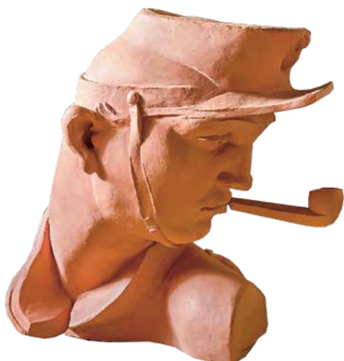
Václav Živec, Model poprsí Josefa Jonáše, realizovaná verze, 1928, pálená hlína, Muzeum Českého krasu v Berouně.