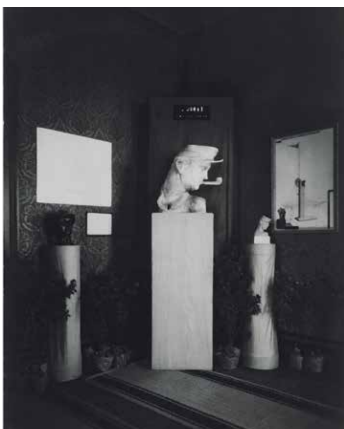
Výstava v Berouně v roce 1928, která proběhla u příležitosti odhalení pomníku, s různými verzemi portrétní a Slavíkovými nákresey, Muzeum Českého krasu v Berouně.

publikace a sám zde vydal některé texty. Byl členem Umělecké besedy a jeho práce byly publikovány ve spolkovém časopise Život . Napsal i životopisný text do katalogu Václava Rabase. 4 Pomník Josefa Jonáše je prvním dokladem jeho spolupráce s dalším berounským rodákem, o deset let mladším architektem Janem Slavíkem. Ten pro Beroun a blízké okolí navrhl řadu prací, mj. tři domy (ve dvou případech jde o čistě funkcionalistické vily), 5 a podílel se i na renovaci historických budov. Dalším výrazným společným dílem je berounský památník Bedřicha Smetany, jehož architektura je dnes bohužel zničená. Marie Hamplová ve své