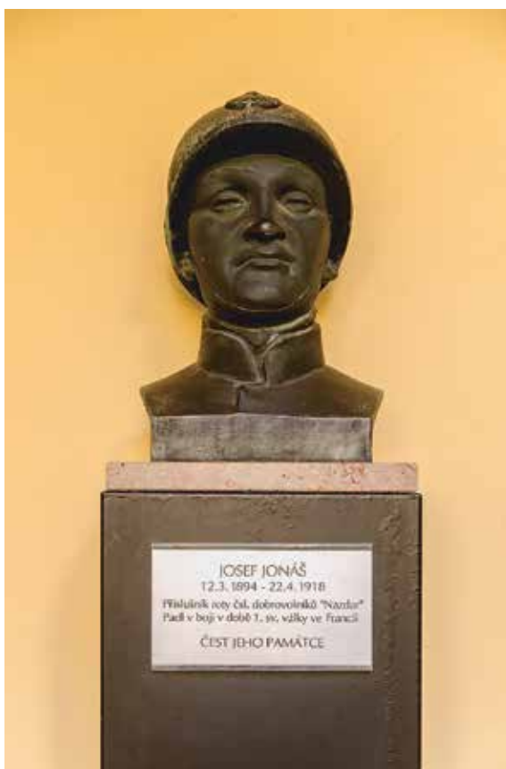
Václav Živec, Pomník Josefa Jonáše II, dnešní situace na dvorku radnice (odhalen 2012), původně v budově Komerční banky (1994–2002).