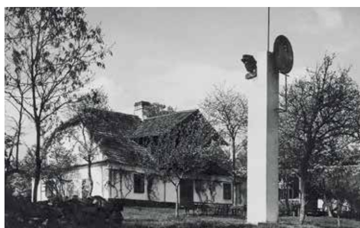
Hájovna na Lísku s pomníkem, Muzeum Českého krasu v Berouně.