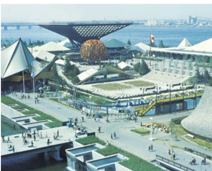
Pohled na výstaviště; v pozadí Kanadský pavilon Katimavik, arch. Rod Robbie, Colin Vaughan, Paul Schoeler & Matt Stankiewicz

View of the exhibition grounds; background: Canadian pavilion "Katimavik", arch. Rod Robbie, Colin Vaughan, Paul Schoeler and Matt Stankiewicz