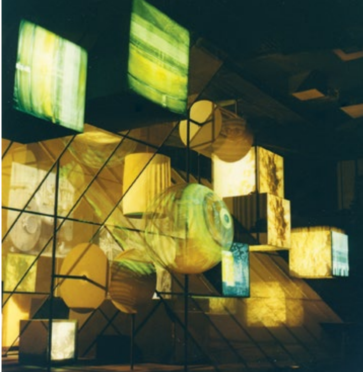
Polyvize Josefa Svobody v oddílu Symfonie

Josef Svoboda's Polyvision in "Symphony"