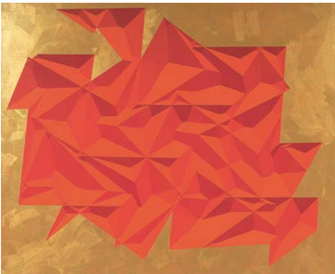
No. 1, 2017, akryl na plátně, 120 × 150 cm

Dole: Skica a dva pohledy do malířské instalace Červená a modrá v GAVU Cheb s obrazy No. 4 a No. 5, oba 2017, akryl na plátně, 190 × 420 cm