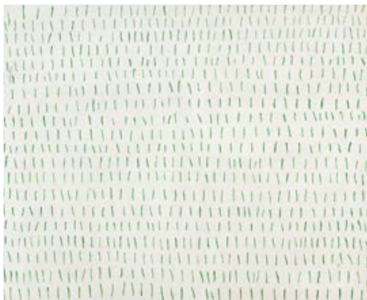
Obilí v zimě, 1985, olej na plátně, 93 x 115 cm

produktivně ztotožní „zbytečnost“ slavnostních rituálů s podobně zbytnou povahou umění. Tímto se v devadesátých letech Kvíčalovi otevřel doslova celý vesmír, jehož vizuálnímu výzkumu se soustředěně věnuje. Pomalu se vytratily, respektive byly znevěditelné přímé odkazy ke kulturní a folklorní tradici, které sebou nutně nese téma ornamentu. Postupně objevuje a rozvíjí téma plochy a iluzivního prostoru obrazu versus jeho reálného okolí. Na současné výstavě toto téma reprezentují prostorová kumulace druhotně použitých relikvií instalace z Kvíčalovy výstavy v pražské galerii Béhémot a slavnostní situace Červená a modrá v hlavním výstavním sále. Pokud by bylo třeba se vsí střízlivosti hledat Kvíčalův mezinárodní úspěch či přesah, bylo by to primárně v rámci realizací v architektuře. Jeho úspěch na tomto poli je dán lehkostí, s kterou vytváří optimální situace, které nejsou jen mechanickým zvětšením měřítka jeho obrazů. Za všechny zmiňme transparentní malbu na velkoformátových posuvných dveřích pro polytechniku ve švýcarském Lausanne, kde samotným mechanickým používáním vzniká nekonečný počet obrazových variant v neustálé interakci s okolní krajinou a s proměnlivou světelností denních a ročních dob.