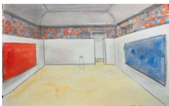
Skica instalace ve velkém sále / Die Skizze der Installation im grossen Saal, 2017

GAVU – Velká galerie / Grosse Galerie 6. 4.–18. 6. 2017 Kurátor / Kurator: Ondřej Chrobák Vernisáž ve středu 5. dubna v 17.00