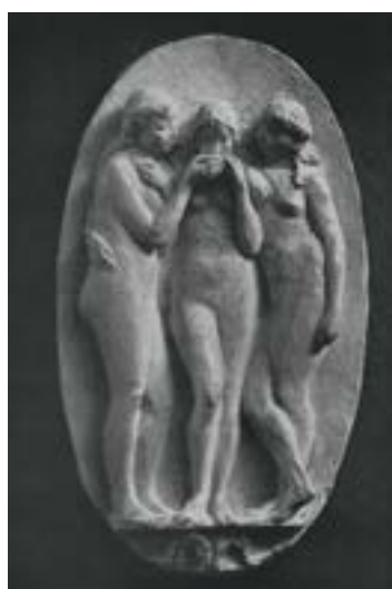
Model / Modell, 1949, pálená hlína / gebrannter Ton, v. / H. 30 cm

GAVU – Opus magnum 27. 4.–25. 6. 2017 Kurátor / Kurator: Marcel Fišer Vernisáž ve středu 26. dubna po přednášce Marcela Fišera Umění ve Františkových Lázních II po roce 1945