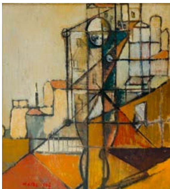
Bohumil Matal, Kompozice / Komposition, 1947, olej, lepenka / Öl, Pappé, 43 x 40 cm

GAVU – Výstava z depozitáře / Ausstellung aus dem Depot 25. 4.–1. 10. 2017 Kurátorka / Kuratorin: Marie Klimešová 7. června, 17.00, přednáška M. Klimešové o Skupině 42