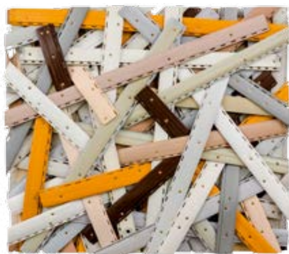
Caspar Hüter, Pilloweone, 2015, 80 x 100 x 20 cm, lamely / Rolladenlamellen

GAVU – Malá galerie / Kleine Galerie 30. 3.–25. 6. 2017, Kurátor / Kurator: Marcel Fišer