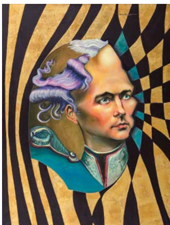
Ludvík II. / Ludwig II., 2010, olej na plátně / Öl auf Lmw., 120 × 100 cm