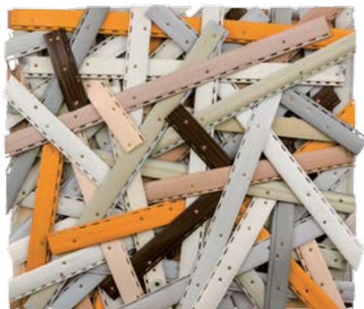
Pillowcone, 2015, 80 × 100 × 20 cm, Lamely / Rolladenlamellen