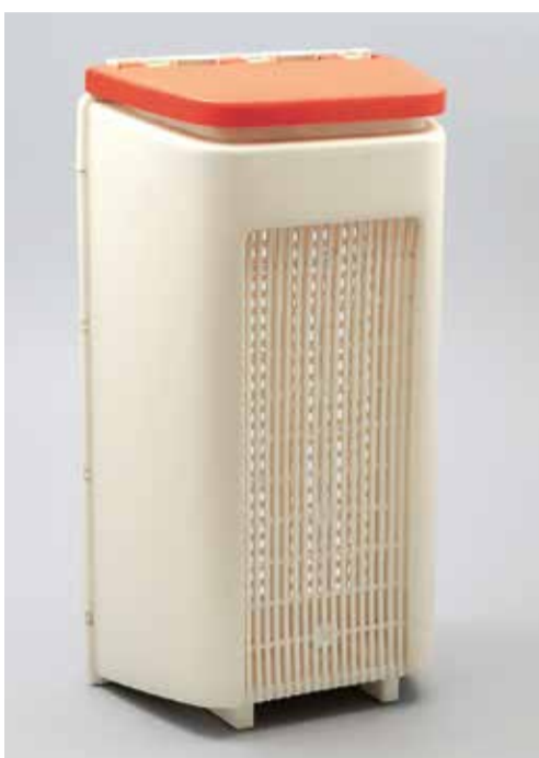
Prádelní koš / Korb für gebrauchte Wäsche, Jiří Hofman, návrh / Entwurf, 1980, realizace od roku / Herstellung seit 1982, plast / Plastik, Plastimat Liberec

Retromuseum – Výstavní sál / Ausstellungssaal 2. 2. 2016–30. 4. 2017 Kurátor / Kurator: Jan Mohr Vernisáž 1. února v 17.00