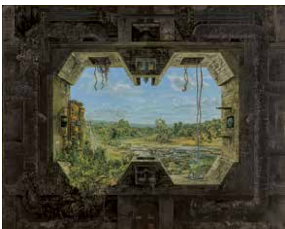
Vladivoj Kotyza, Nový pohled / Neue Ansicht, 1978–1979, olej, plátno / Öl, Lnw., 80,5 x 101 cm

GAVU – Výstava z depozitáře / Ausstellung aus dem Depot 12. 1.–23. 4. 2017 Kurátor / Kurator: Petr Jindra Vernisáž 11. ledna v 17.00