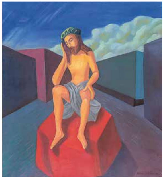
Antonín Střížek, Ježíš / Jesus, 1994, olej na plátně / Öl auf Lnw., 110 x 95 cm