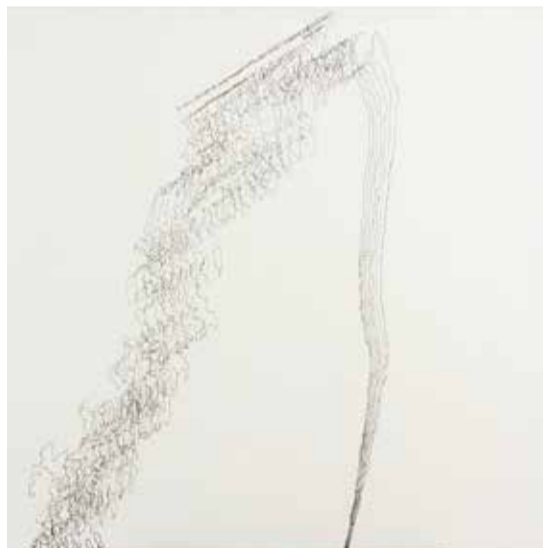
Milan Maur, Stín vržený hrušní / Schatten, geworfen durch einen Birnbaum, 1992, olej, plátno / Öl, Lnw., 140 x 140 cm, „11. října 1992 jsem se na své zahradě dotýkal kmenu hrušně a obkresloval stín, který vrhala.“ / „Am 11. Oktober 1992 habe ich in meinem Garten den Stamm eines Birnbaums berührt und den Schatten nachgezeichnet, den er warf.“

8. února, 17.00, komentovaná prohlídka s autory a kurátorem 22. března, 17.00, přednáška M. Fišera České konceptuální umění