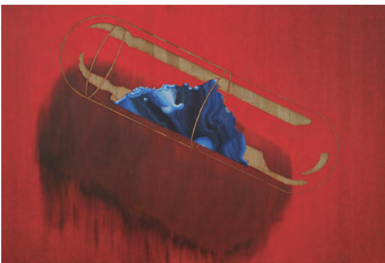
Vzorek, olej na bambusové desce, 40×60 cm, 2016