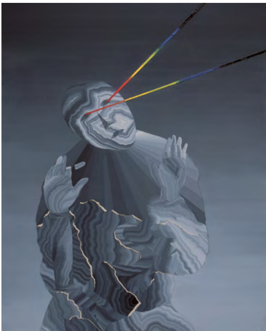
Laser, olej na dřevěné desce, 80×61,5 cm, 2016