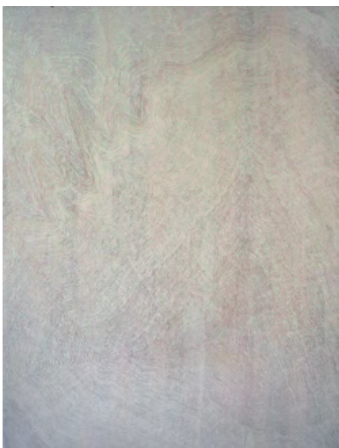
Čas - Světlo, olej na březové desce, 80,5×60,5 cm, 2016