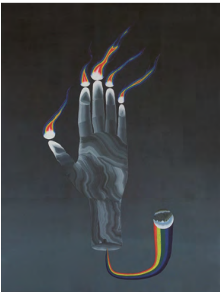
Hand, olej na březové desce, 80,5×60,5 cm, 2016