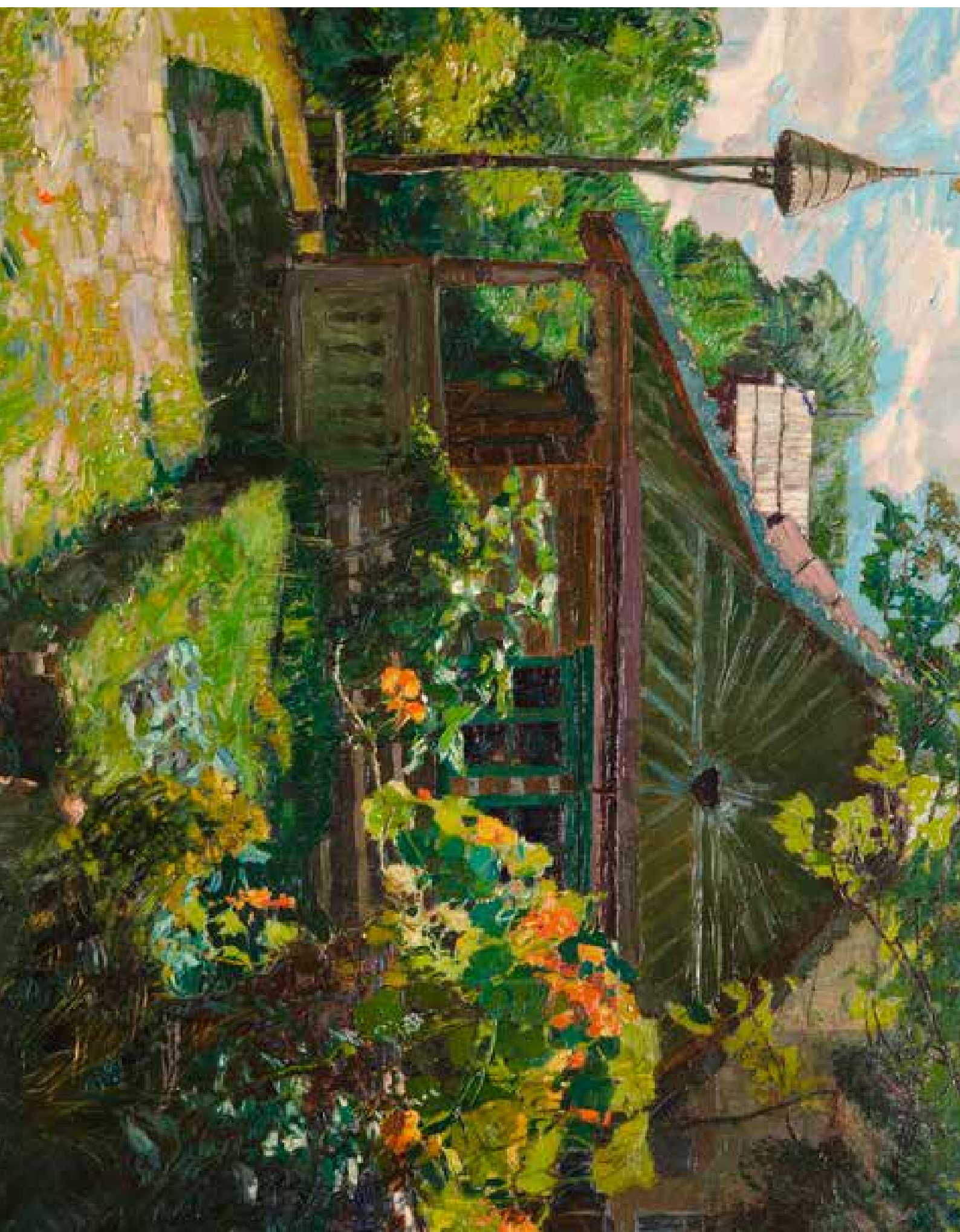
Alois Kalvoda, Moje česká chaloupka na Křivoklátě (Večerní oblaka), kol. 1912, olej na plátně, 43 × 43,5 cm, GAVU Cheb