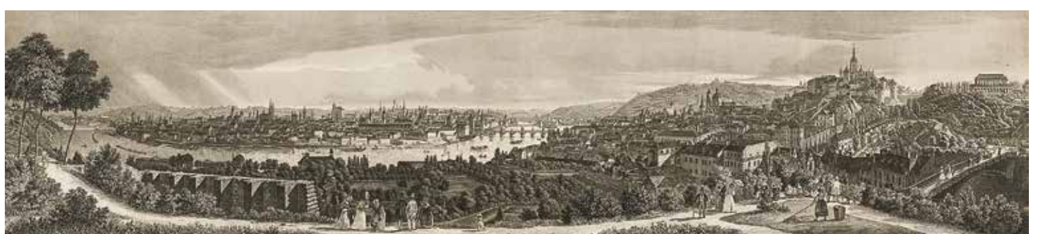
Friedrich Geissler podle Vincence Morstadta, Pohled na Prahu, oceloryt, Muzeum hl. města Prahy.