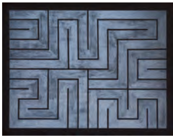
Obic, Nocturno / Nokturn, 2015, kombinovaná technika, plátno / Mischtechnik auf Lnw., 155 × 200 cm

Malá galerie / Kleine Galerie 27. 6.–23. 8. 2015 Kurátor / Kurator: Jiří Gordon