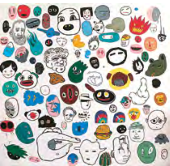
Ilustrace z knihy Hlava v hlavě / Illustration aus dem Buch Der Kopf im Kopf