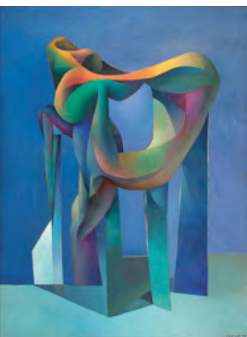
Josef Istler, Modrý objekt / Das blaue Objekt, 1956, olej, dřevo / Öl, Holz, 136 x 110 cm, GAVU Cheb

Výstava z depozitáře / Die Ausstellung aus dem Depot 10. 9. 2015–3. 1. 2016 Vernisáž 9. září v 17.00