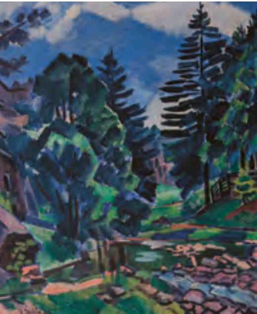
Les / Wald, 1927, olej na plátně / Öl auf Lnw., 73×60 cm

Výstava z depozitáře / Die Ausstellung aus dem Depot 28. 4.–6. 9. 2015 Kurátor / Kurator: Marcel Fišer 2. září, 17.00, přednáška kurátora a komentovaná prohlídka výstavy