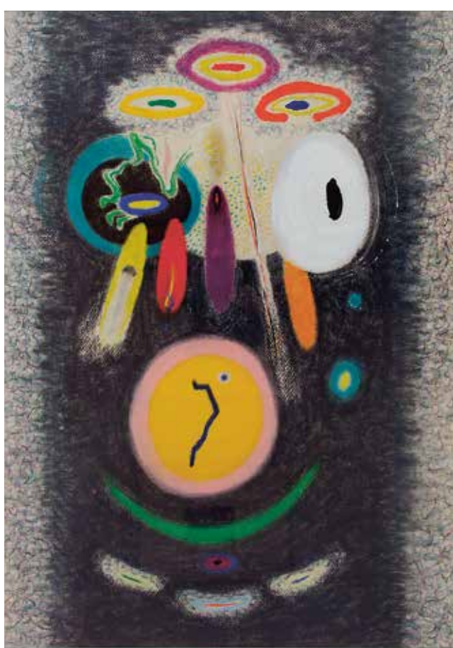
→ Karel Malich, Sedím za stolem, 1985, pastel na papíru, 103 × 74 cm