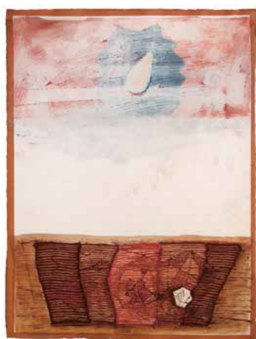
κ Karel Malich, Uviděl jsem to (z grafického alba Česká grafika I), 1993, serigrafie na papíru, 53/100, 377 × 243 mm