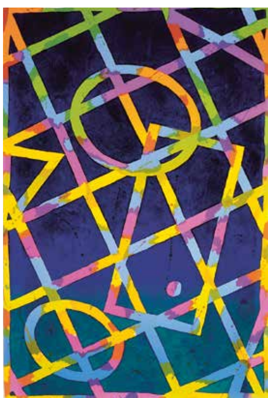
λ Aleš Lamr, Magická geometrie II, 1999, litografie na papíru, 50/50, 810 × 545 mm (1000 × 700 mm)