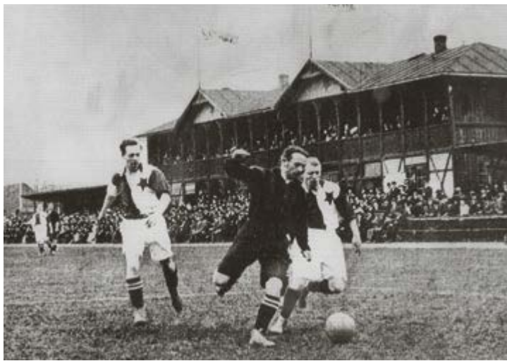
Slavia v útoku, fotografie z časopisu Český svět z roku 1909 se slavistickou tribunou v pozadí