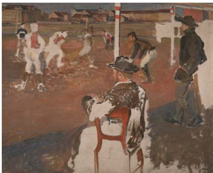
Miloš Jiránek, Fotbal (nedokončeno), 1901–1902, olej, plátno, 68,5 x 82 cm, Národní galerie v Praze

Vedle toho, že sport přitahoval pozornost stále širšího publika, zaujal i některé výtvarné umělce, a to zvláště ty, kteří naplňovali Baudelaireův modernistický program, požadující zachycování proměňujícího se, soudobého městského života, v němž má být odhalena nová, po-