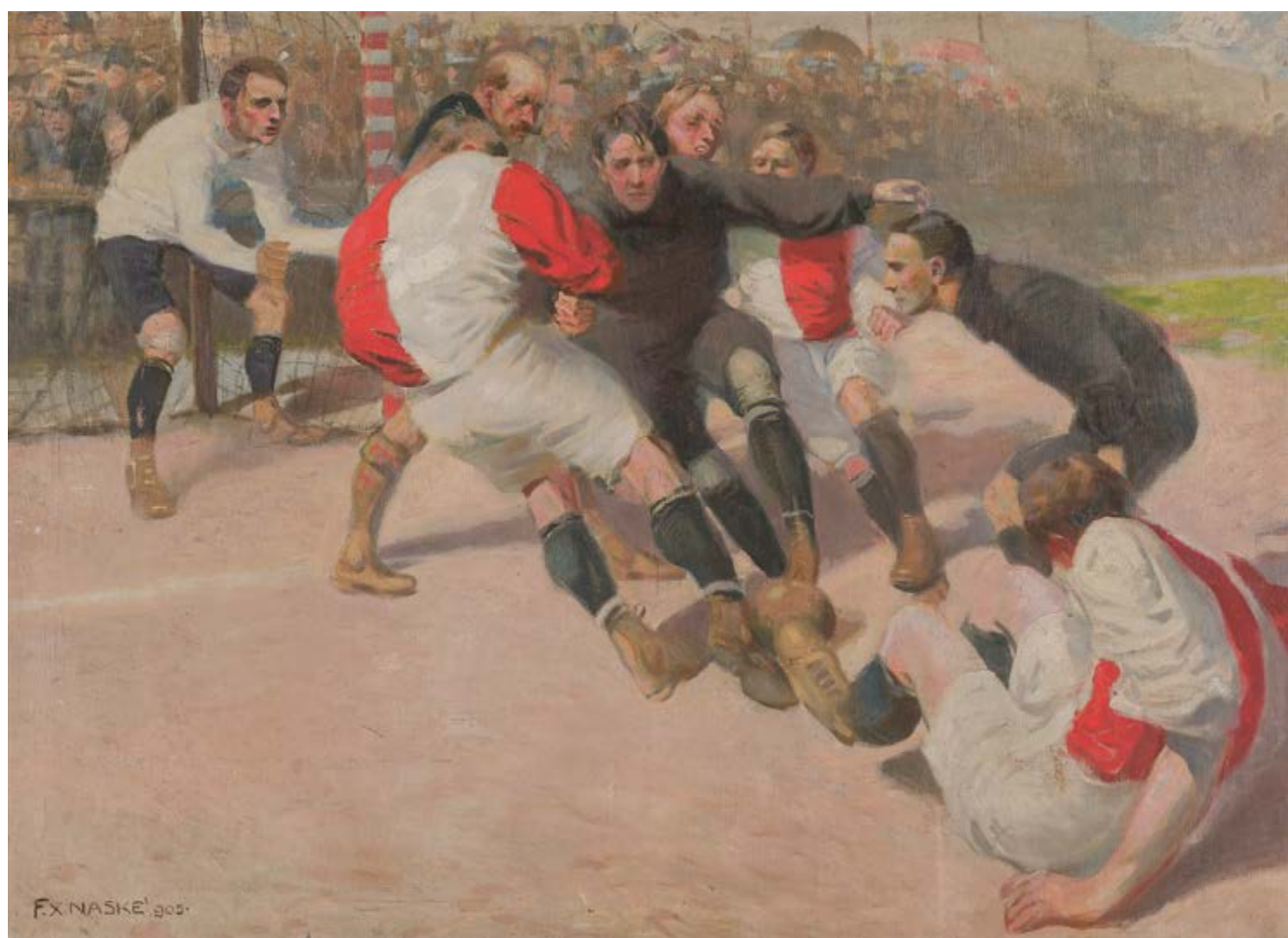
František Xaver Naske, Fotbalové utkání Angličanů se Slavií v Praze, 1905, olej, plátno, 72,5 x 99,5 cm, Národní muzeum – Sbirka tělesné výchovy a sportu

Důraz na popisný charakter obrazu je patrný i v pozadí výjevu, kde se nalézají plně obsazené divácké tribuny. Obraz velice věrně reprodukuje jejich tehdejší podobu. Historicky je zajímavá zvláště stavba na pravé straně. Původně měla pouze jeden štít a poloviční délku a byla vůbec první fotbalovou tribunou tohoto typu v Čechách. Navrhl ji čestný člen klubu, architekt Karel Ankr. V přízemí se nacházely spolkové místnosti, sprchy, šatny a byt, v patře pak sedadla,