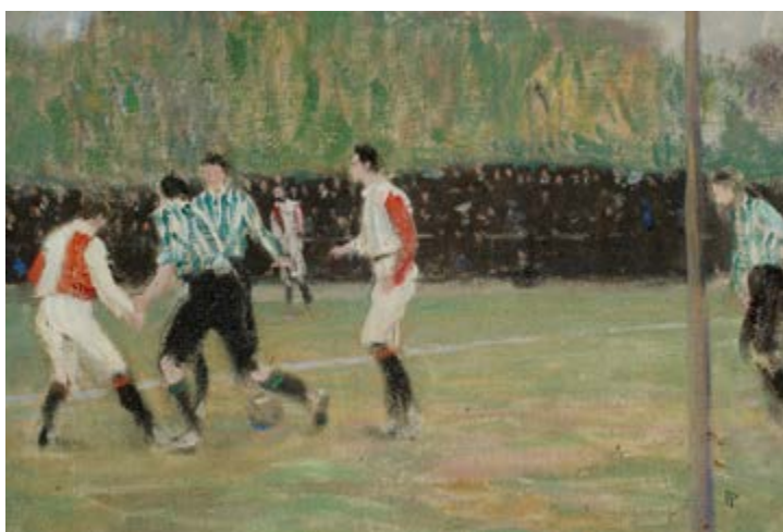
Jan Preisler, Kopané, 1905–1906, olej, plátno, 32 × 46 cm, Západočeská galerie v Plzni