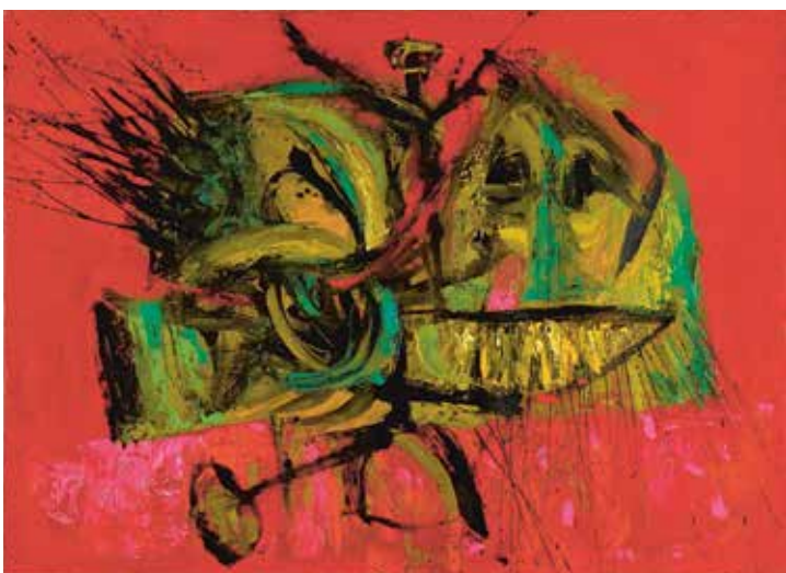
Jan Kotík, Obraz , 1960, kombinovaná technika, plátno, 73 × 100 cm, získáno 1968