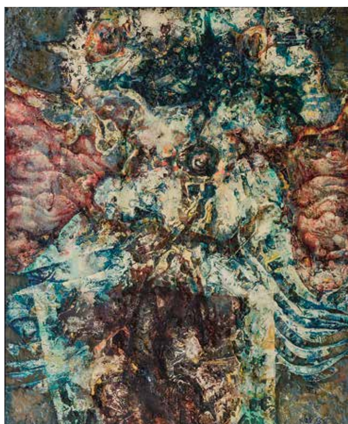
Zbyšek Sion, Venuše v ulitě, 1965–66, kombinovaná technika, plátno, získáno 2002