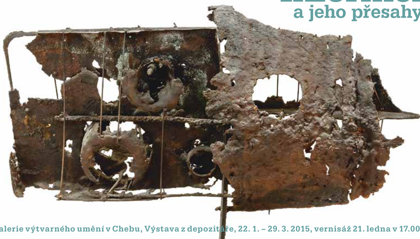
Galerie výtvarného umění v Chebu, Výstava z depozitáře, 22. 1. – 29. 3. 2015, vernisáž 21. ledna v 17.00