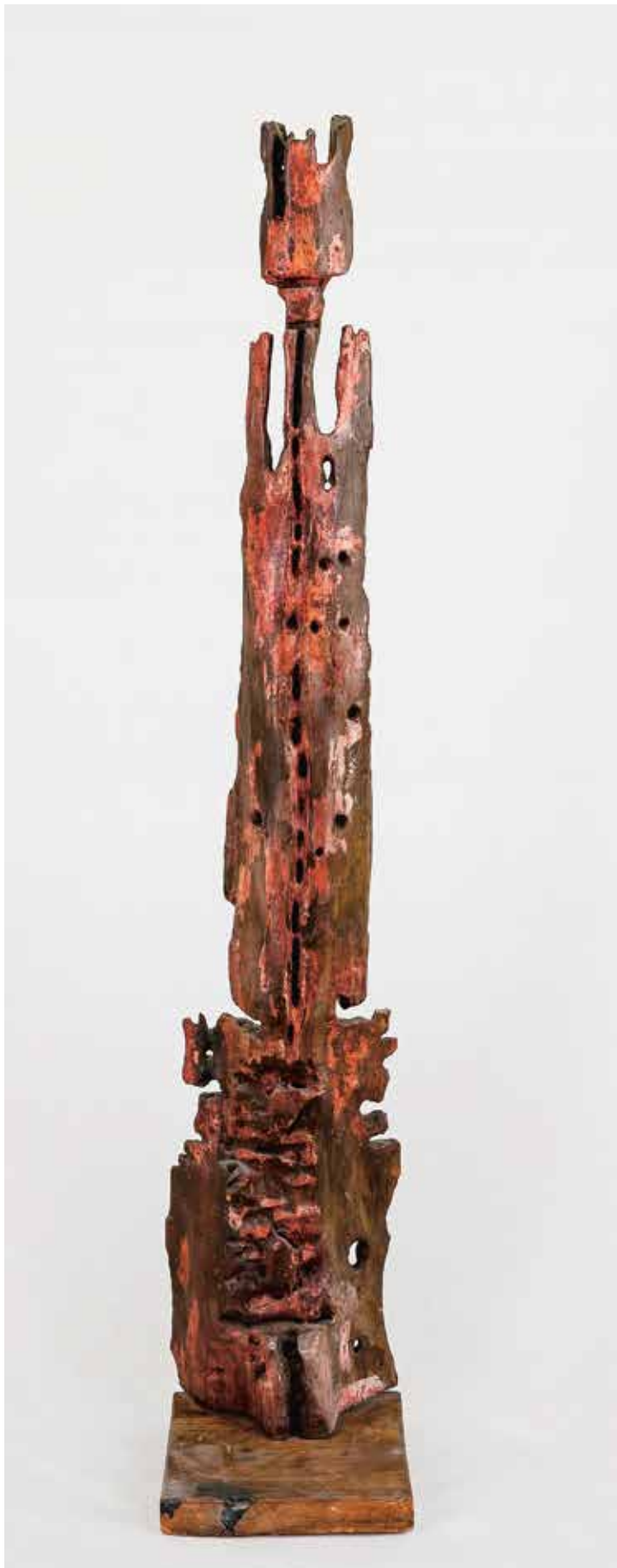
Jan Koblasa, Velký zázrak, dřevo, v. 250 cm, získáno 1969