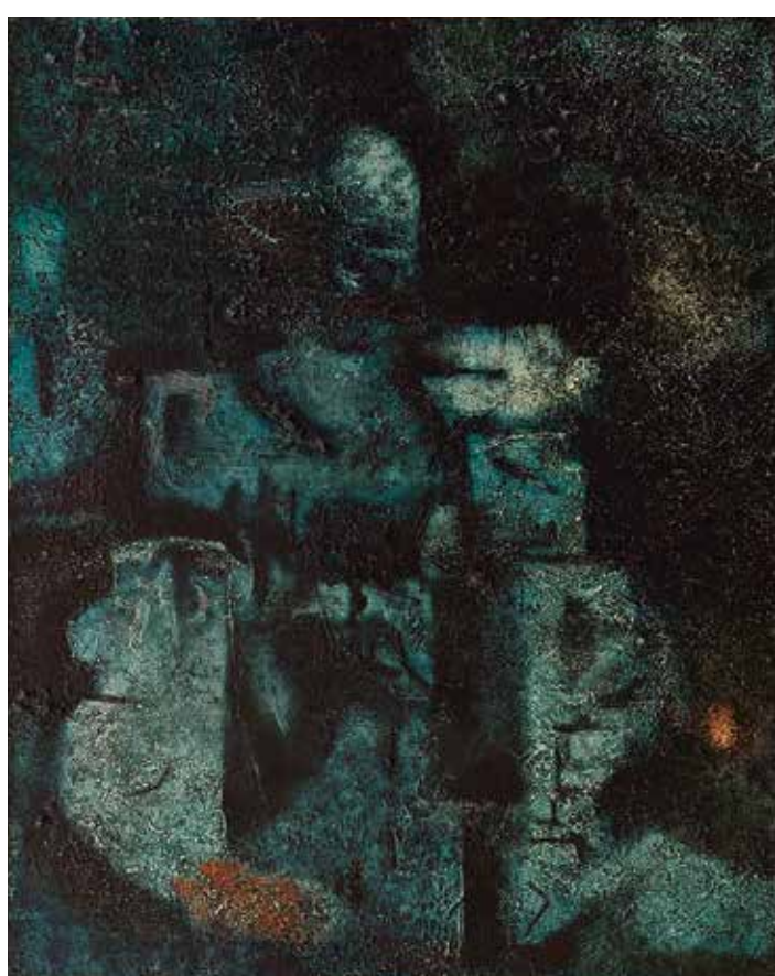
Jaroslav Šerých, Volná představa , 1962, kombinovaná technika, plátno, 75 × 60 cm, získáno 1969