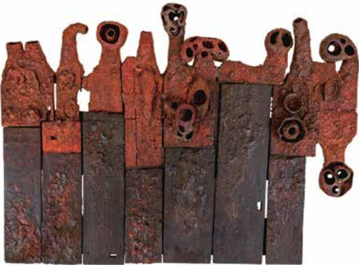
Jan Švankmajer, Velká koroze, 1963, kombinovaná technika, dřevo, 70 x 95 cm, získáno 2001