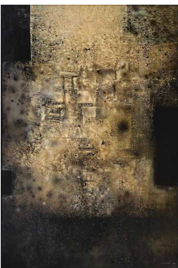
Josef Istler, Obraz 1964, 1964, kombinovaná technika, kov, 176 × 118 cm, získáno 1990