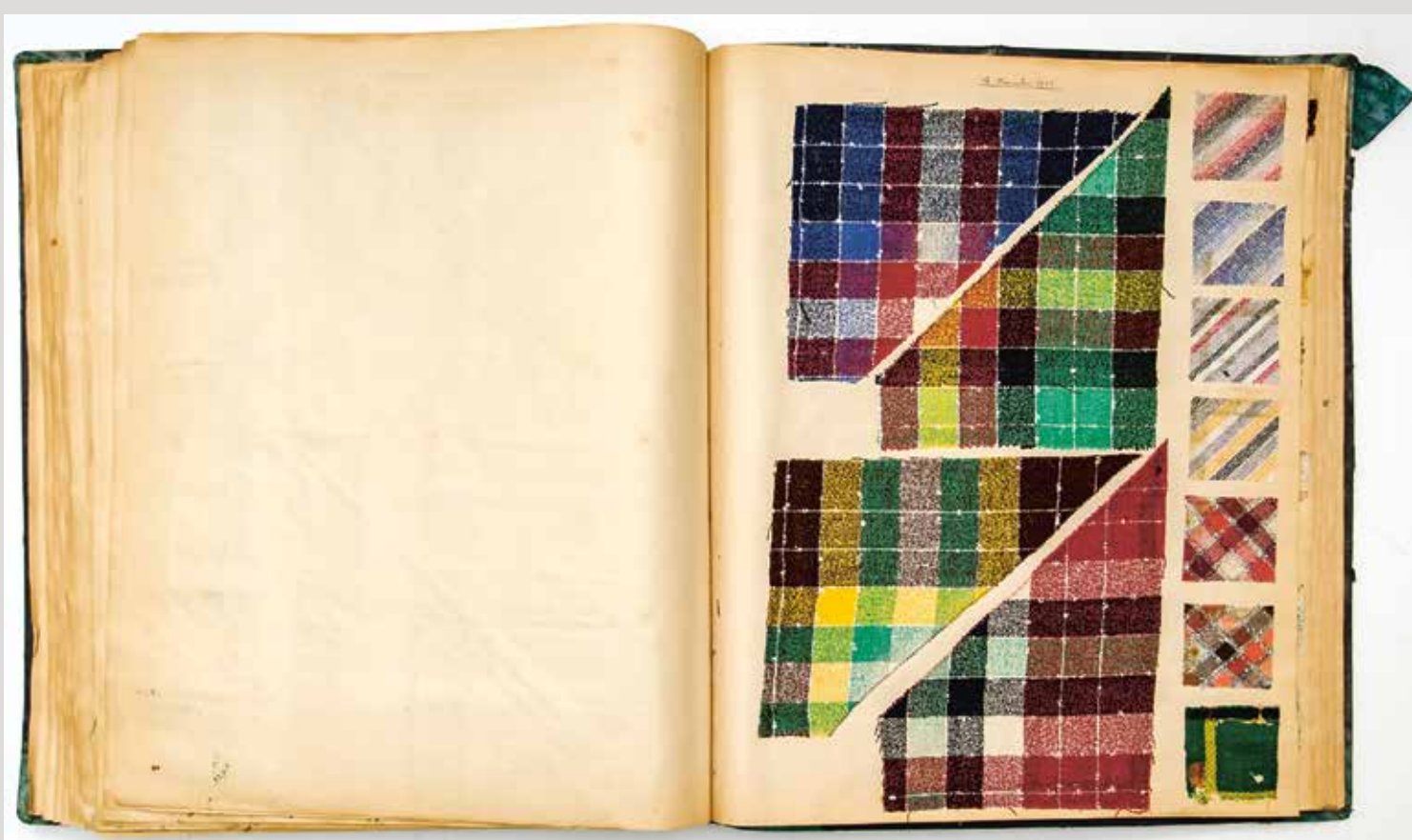
Jeden z historických vzorníků textilních látek, Národopisné a textilní muzeum Aš