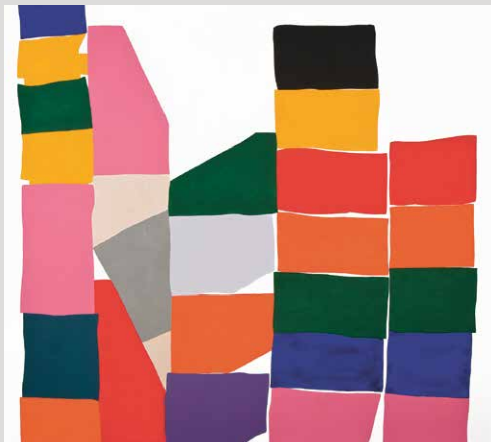
Zbytky č. V. 19, 2008, 180 × 200 cm, akryl na plátně