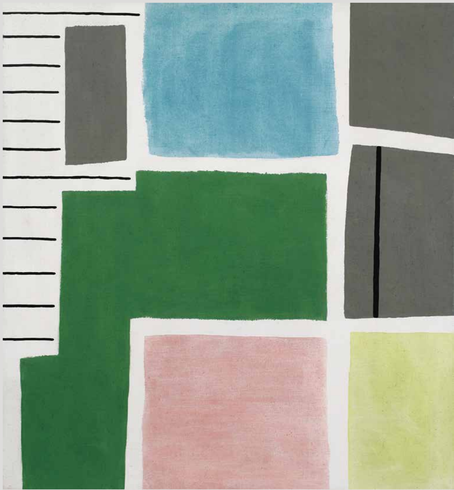
Zbytky č. 21., 1995, 145 × 120 cm, akryl na plátně, Galerie Klatovy / Klenová

Kritika důvěry v umělecké dílo jako místo zjevení jediné možné (subjektivní) pravdy v tvorbě Stanislava Diviše vrcholí právě v polovině 90. let minulého století. Cyklus Zbytky , jehož první obrazy vznikaly v roce 1995, patří k autorovým nejrozsáhlejším souborům a velmi dobře shrnuje základní premisy, s jejichž přijetím jeho dílo stojí a padá: volně se vztahuje k mimouměleckému artefaktu jako vzoru či předobrazu, zkoumá variabilitu systému řazení prvků a kompozice, a to s výrazným využitím čisté barvy, a zároveň podprahově rehabilituje ornament. Podkladem cyklu, který je nyní poprvé v rozsáhlejším výběru vystaven samostatně s důrazem na jeho vnitřní různorodost, se staly vzorníky látek vyráběných v ašských textilkách a uchovávaných v Národopisném a textilním muzeu v Aši, kde