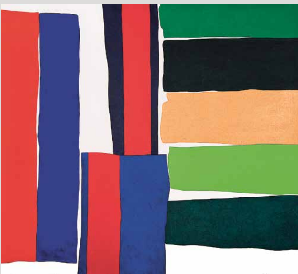
Zbytky č. V. 23, 2008, 180 × 200 cm, akryl na plátně