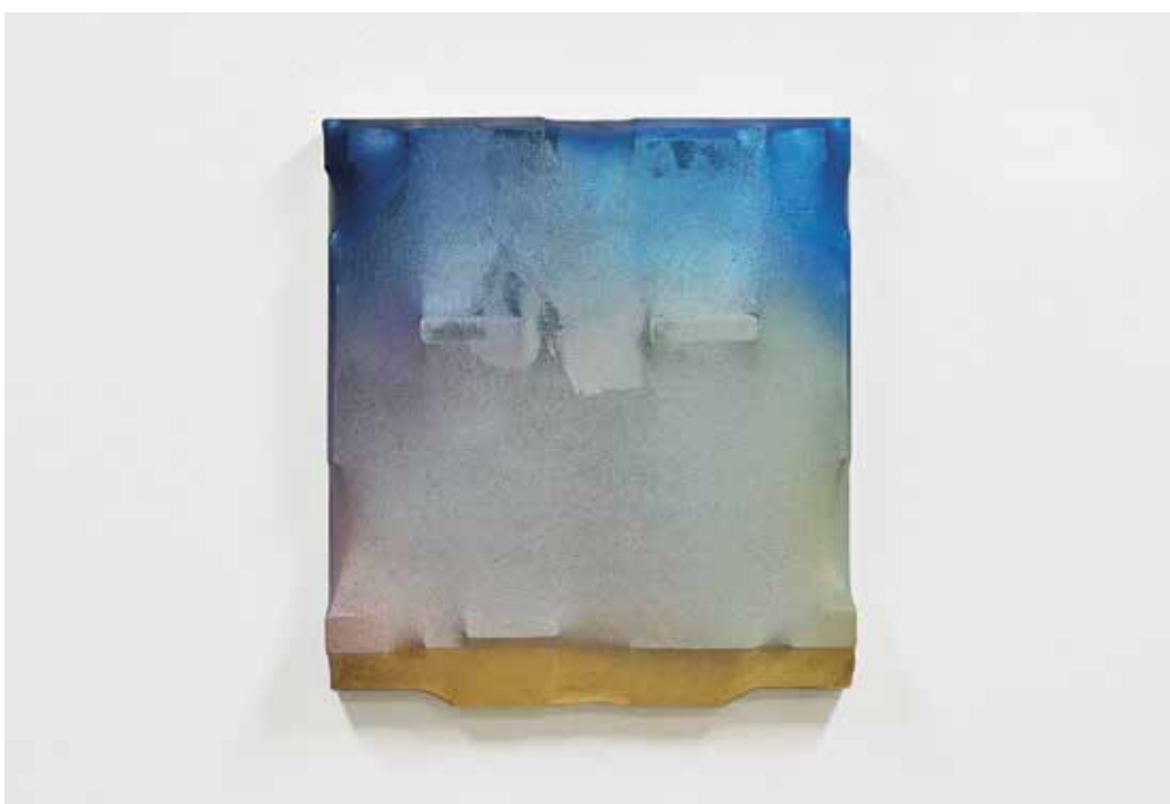
Kdybych to byl zvládl bez zlatě, 2014, akryl, syntetické laky, dřevo, plátno, 62x55x14 cm