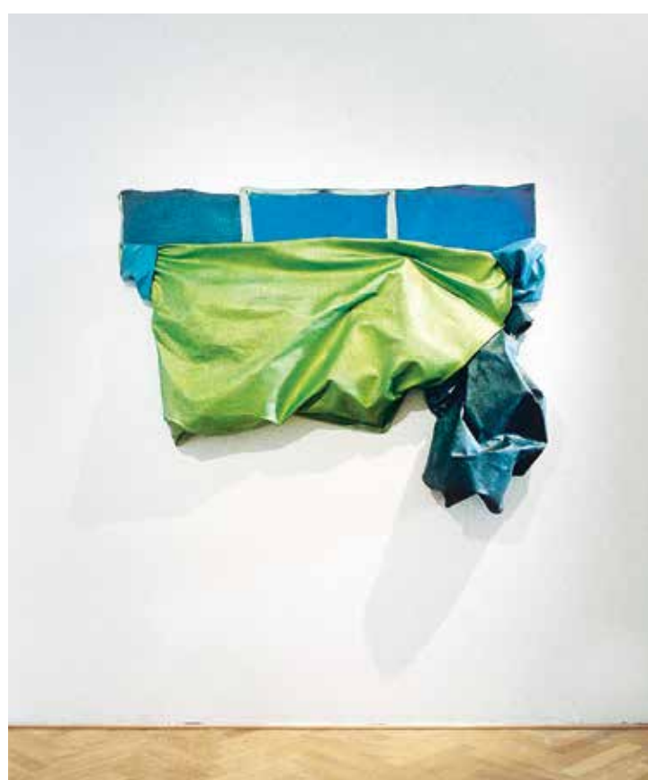
Šumava, z cyklu Unframed, 2009, hřebíky, syntetické laky, plátno, pohled do výstavy Start point, Galerie U Bílého jednorožce v Klatovech

své téma, kterým se nakonec paradoxně stalo ono testování samotné.