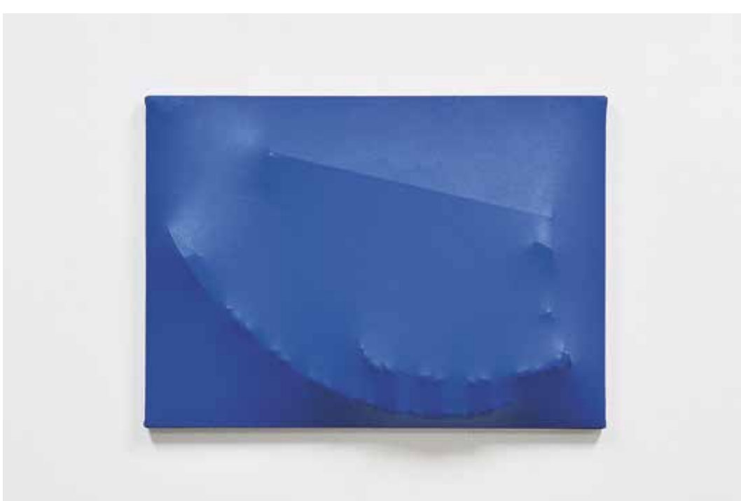
Ghostly Milka Box, 2010, akryl, dřevo, plátno, 50x70x9 cm