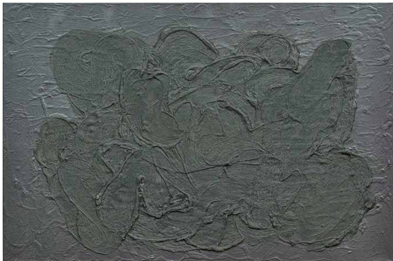
Lokoko, 2009, akryl, syntetické laky, tmel, plátno, 60x90 cm