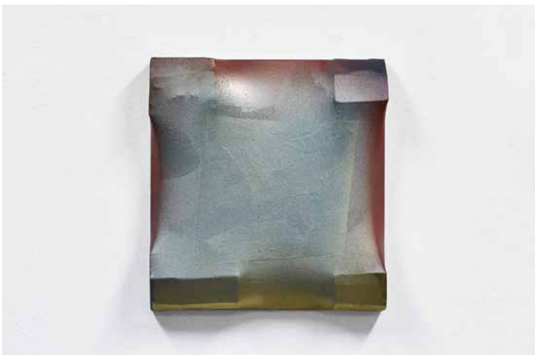
Rozhodně ne černý čtverec, 2014, akryl, syntetické laky, dřevo, plátno, 43x40x9 cm