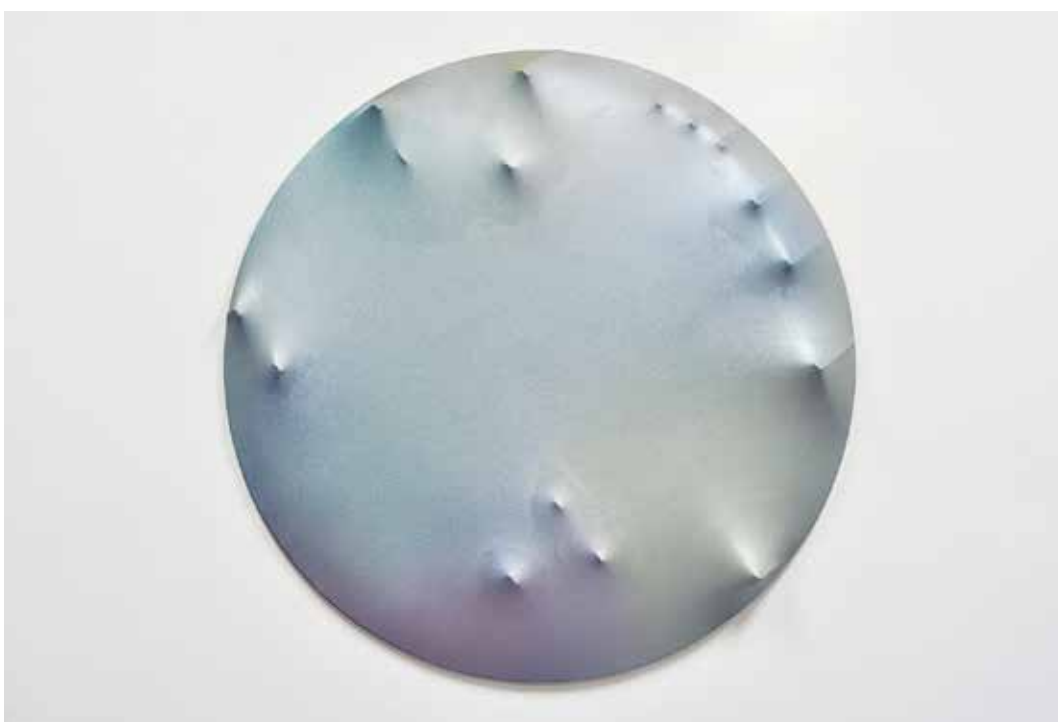
Jordan Green, 2013, syntetické laky, dřevo, plátno, průměr 120 cm