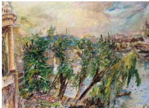
Oskar Kokoschka, Praha od Křížovníků / Prag vom Kloster der Kreuzherren, kol. / um 1936, olej, plátno / Öl, Leinwand, 85 x 115 cm, Galerie Zlatá husa, Praha