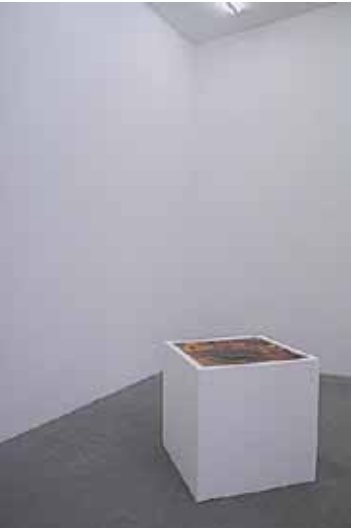
Cukr, koření a vše dobré / Zucker, Würze und alles Schöne, 2013, polystyren, cukr / Polystyren, Zucker, 85x85x85 cm

Malá galerie / Kleine Galerie 11. 9.–5. 10. 2014 Kurátor / Kurator: Pavel Vančát Vernisáž 10. září v 18.00