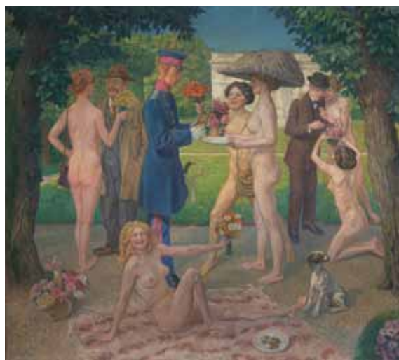
Květinový den / Ein Blumentag, 1912, olej, plátno / Öl, Leinwand, 135 x 150 cm, Národní galerie v Praze

3. září, přednáška Tomáše Wintera Heine a české umění