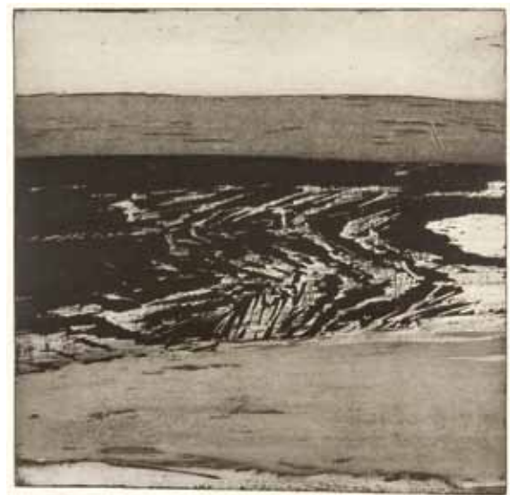
Pole II / Felder II, 1982, akvatinta / Aquatinta, 436 x 445 mm, 3/100, GAVU Cheb