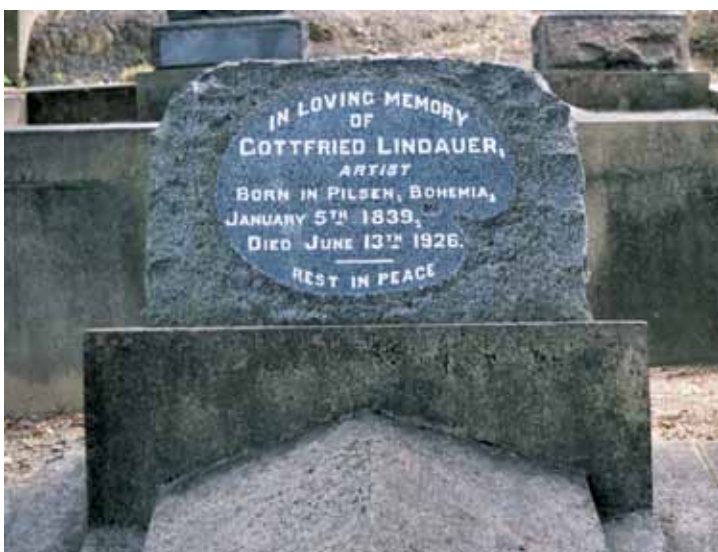
Lindauerův hrob ve Woodwille, Nový Zéland