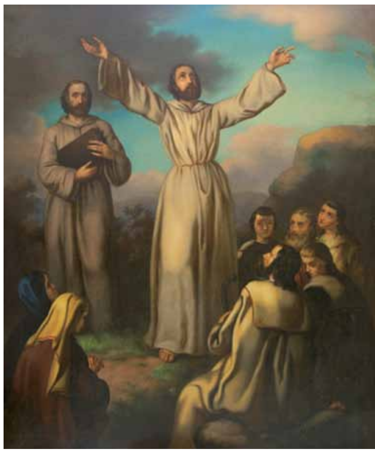
Kázání sv. Cyrila a Metoděje na Moravě pod širým nebem, Sv. Cyril a Metoděj našli ostatky sv. Klementa v Chersonu na Krymu, oba 1862, Římskokatolická farnost Valašské Klobouky

Gottfried Lindauer je autor s pozoruhodným životním osudem, který ovšem stále čeká na plnohodnotné zhodnocení svého díla, neboť mu do dnešních dnů nebyla věnována souhrnná retrospektivní výstava, ani publikace. Zatímco v českých zemích je znám stále pouze úzké skupině odborníků, specializujících se zejména na umění 19. století, na Novém Zélandu, kam odešel z Plzně v roce 1874, jsou jeho malby původních maorských obyvatel považovány za součást národního kulturního dědictví a samotný Lindauer zde patří mezi nejpopulárnější malíře koloniálního období. Jeho dílo je rozptýlené mezi střední Evropou (s ohledem na Lindauerovo vídeňské školení a působení v Rakousku, Haliči a v českých zemích především na Moravě a v Plzni) a Novým Zélandem. Tam je ovšem soustředěno zejména do dvou početných kolekcí, umístěných v Auckland Art Gallery a v Museum of New Zealand Te Papa Tongarewa ve Wellingtonu, a také jsou celkem dobře zmapovány jeho tamější životní peripetie, což se bohužel o jeho působení ve střední Evropě říci nedá. V České republice je jeho dílo doloženo jen několika málo příklady zejména v Římskokatolické farnosti ve Valašských Kloboukách, v Západočeském muzeu v Plzni a v Národním muzeu, respektive v Náprstkově muzeu asijských, afrických a amerických kultur. Z Nového Zélandu,