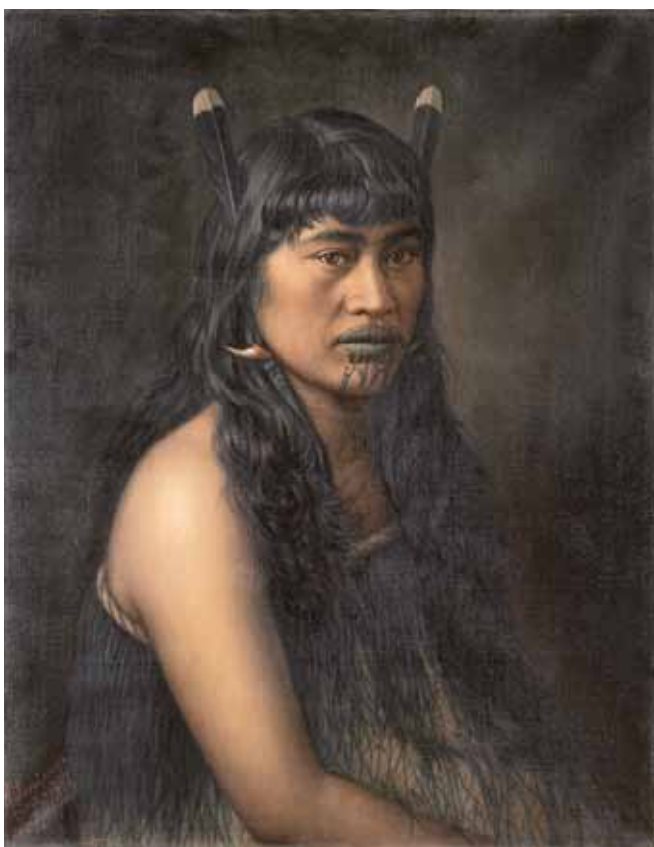
Portrét Mrs. Hāromi, 1907, olej, plátno, 76,5×60,2 cm, Národní muzeum – Náprstkovo muzeum asijských, afrických a amerických kultur