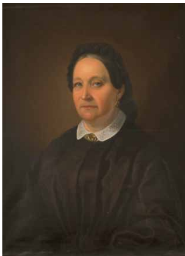
Portrét manželky Christiana Lexy, 60. léta 19. století, 77×62 cm, Západočeské muzeum v Plzni

kde žil až do své smrti v roce 1926, udržoval četné kontakty s českým prostředím a zejména Náprstkovu muzeu v Praze příležitostně posílal také některé předměty, vztahující se k životu domorodých Maorů. V roce 1907 zaslal manželce Vojty Náprstka Josefě své dvě malby, Portrét náčelníka Harawira te Mahikai a Portrét Mrs. Hāromi , které můžete nyní shlédnout v rámci projektu Galerie výtvarného umění v Chebu Opus Magnum.