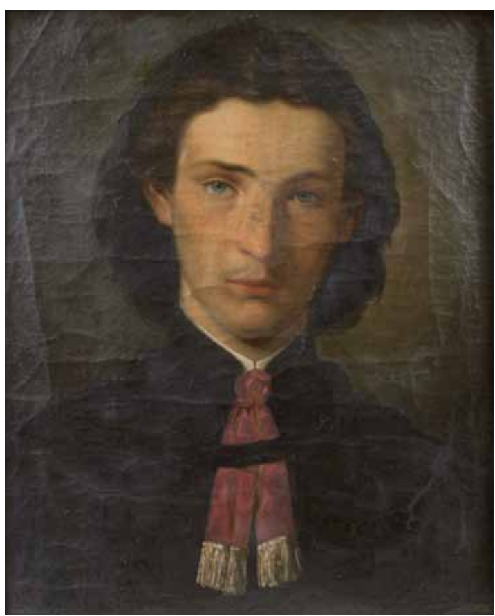
Autoportrét, 60. léta 19. století, Západočeské muzeum v Plzni

Galerie výtvarného umění v Chebu Opus magnum 9. 1. – 30. 3. 2014