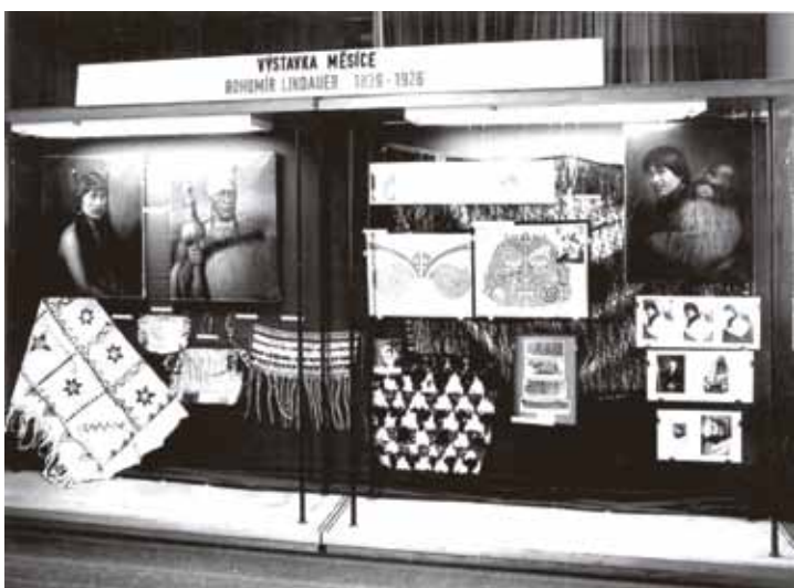
Připomínka 50. letého výročí úmrtí Gottfrieda Lindauera v Náprstkově muzeu v Praze. Národní muzeum v Praze, Náprstkovo muzeum asijských, afrických a amerických kultur, 1976