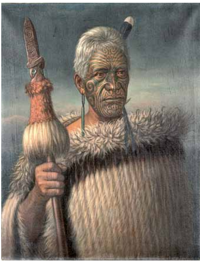
Portrét náčelníka Harawira te Mahikai, 1907, olej, plátno, 76×60 cm, Národní muzeum – Náprstkovo muzeum asijských, afrických a amerických kultur