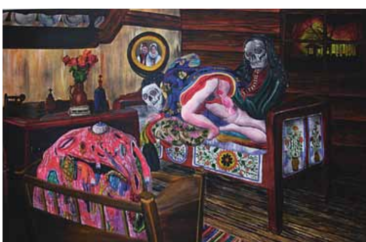
Obcování, 2011, akryl na plátně, 130 × 200 cm