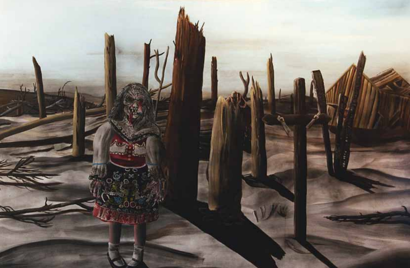
↓ Boží muka, 2011, akryl na plátně, 140×220 cm