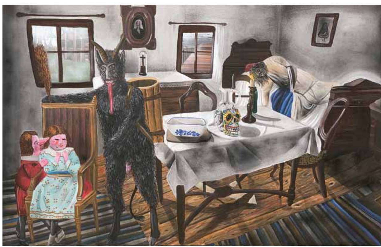
Čert a zmrzí, 2011, akryl na plátně, 120×190 cm