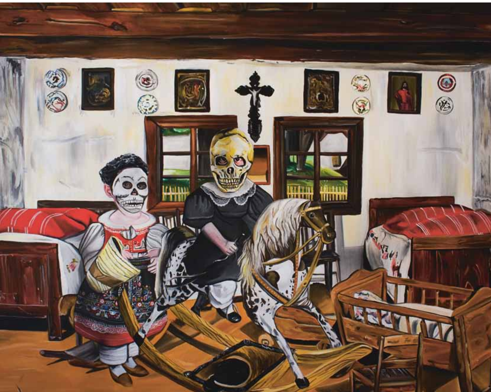
↓ Malý diktátor, 2013, akryl na plátně, 180 × 140 cm