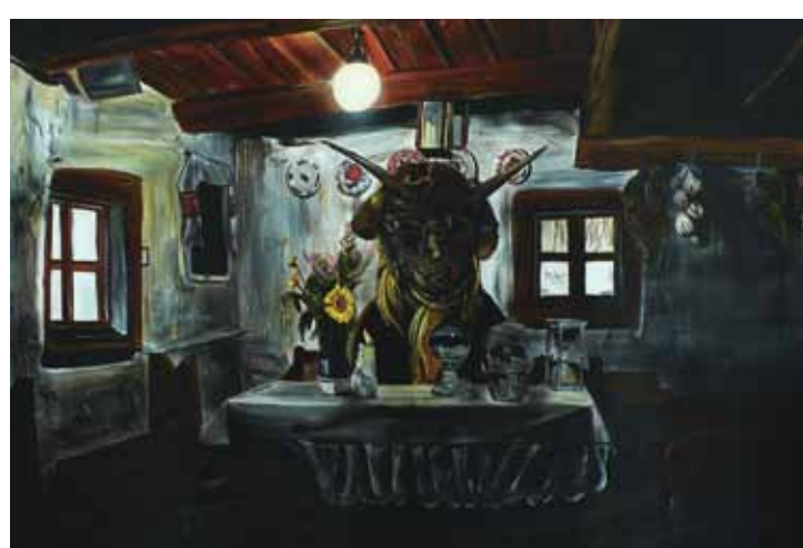
Black Sabbath, 2012, akryl na plátně, 150 × 220 cm