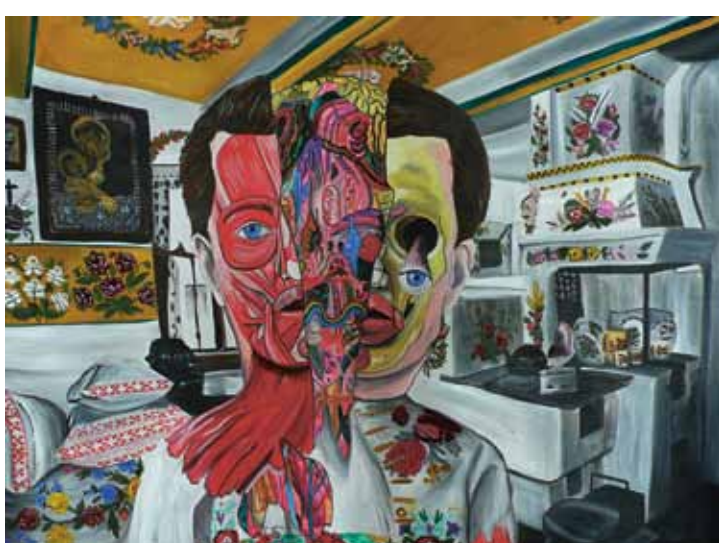
Total Recall, 2012, akryl na plátně, 140 × 200 cm