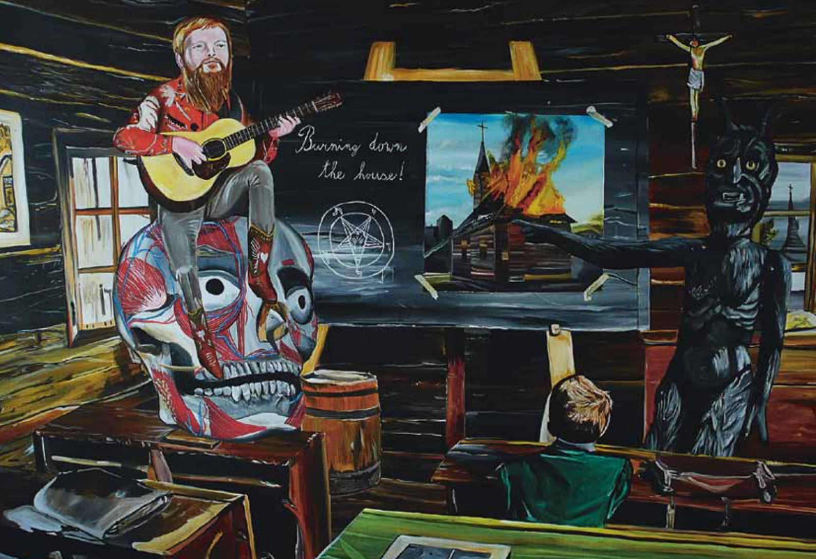
Jan Vytiska, Burning down the house, 2013, akryl na plátně, 180 × 140 cm