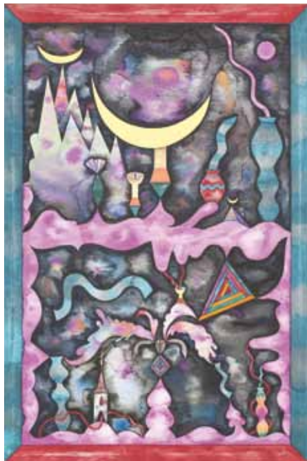
Anežka Hošková, South of Heaven, 2012, 120 x 80 cm, akvarel na plátně / Aquarell auf Lnw.

Ve sbírkách GAVU Cheb se nachází výjimečný soubor prací malíře, karikaturisty a ilustrátora Antonína Pelce (1895–1967), vztahujících se k jeho exilu v období druhé světové války. Vedle několika olejů obsahuje i malířské studie v technice olejové tempery na papíru, jež mu sloužily jako podklad pro definitivní obrazy.