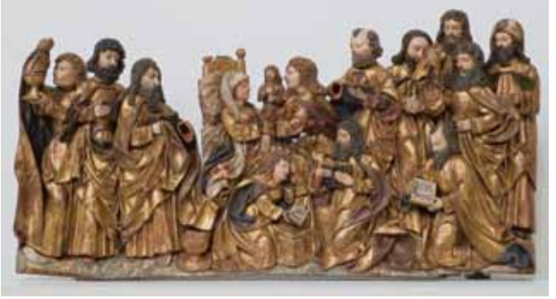
Smrt Panny Marie z Házlou, první čtvrt. 16. st., lipové dřevo, původní polychromie / Marientod aus Haslau, erstes Viertel des 16. Jahrhunderts, Lindenholz, originale Polychromie, GAVU Cheb