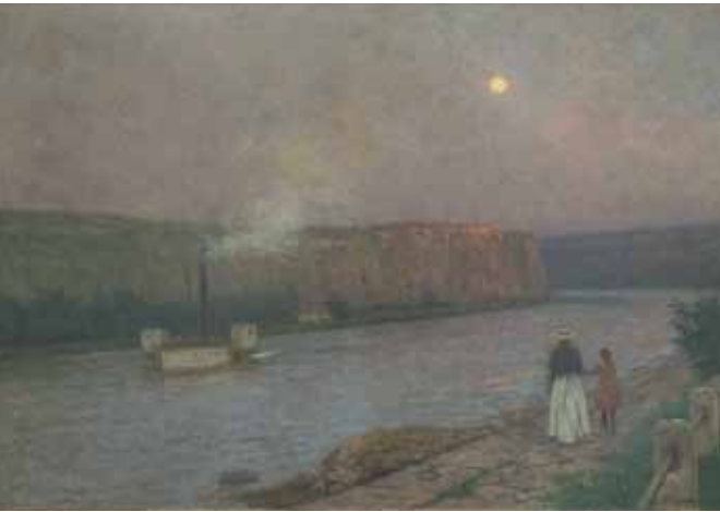
Jakub Schikaneder, Údolí řeky / Flusstal, 1915, olej, plátno / Öl auf Lnw., 85 x 122 cm, GAVU Cheb

Adam Hnojil se ve svém cyklu posune do období závěru 19. a prvních let 20. století. V první přednášce představí Jakuba Schikanedera (1855–1924), autora známých pražských nocturn, který však začínal jako malíř poučený soudobým francouzským uměním, v jehož duchu vytvářel naturalistické scény se silným sociálním akcentem. Schikanederovým vrstevníkem je zakladatel moderního českého sochařství Josef Václav Myslbek (1848–1922). V jeho díle se prolínají vlivy klasicismu, moderního realismu, mánesovského idealismu i secese. Vrcholem jeho tvorby je jezdecký pomník sv. Václava, na němž pracoval více než třicet let.