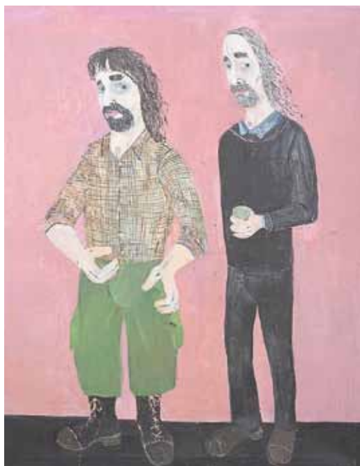
Hana Puchová, Petr a Pavel / Petr und Pavel, 2012, 120 x 100 cm, akryl na plátně / Acryl auf Lnw.