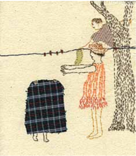
Eva Volfová, Z domu a zahrady / Aus Haus und Garten, ilustrace / Illustration

Museum Café, 4. 4.–29. 9. 2013 Kurátorka / Kuratorin: Veronika Lochmanová Vernisáž 3. dubna, 17.00.