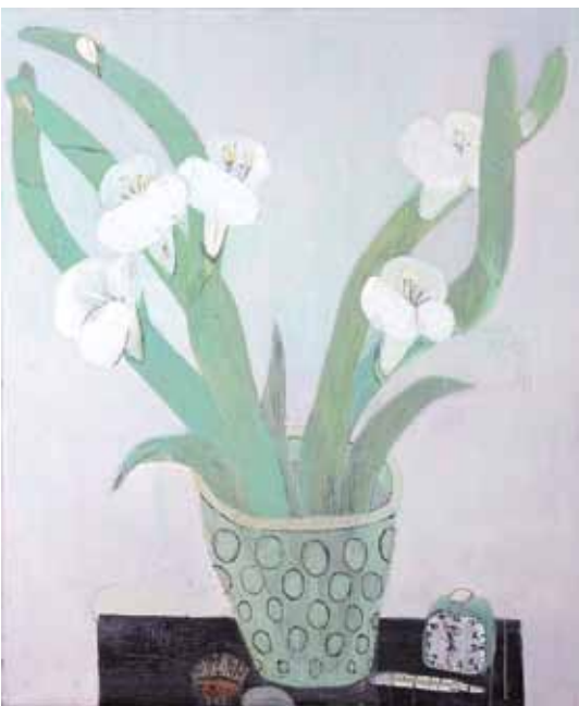
Zátíší s teploměrem / Stilleben mit dem Fiebermesser, 2010, 120×100 cm, akryl na plátně / Acryl auf Lnw.

Malá galerie / Kleine Galerie 14. 3.- 5. 5. 2013 Kurátor / Kurator: Pavel Netopil Vernisáž 13. března, 17.00