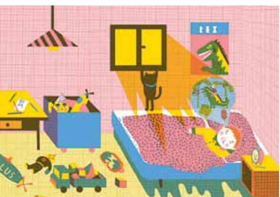
Eva Maceková, 12 hodin s Oskarem / 12 Stunden mit Oskar, ilustrace / Illustration

Museum Café, 10. 1.–31. 3. 2013 Kurátorka / Kuratorin: Veronika Lochmanová Vernisáž 9. ledna, 17.00