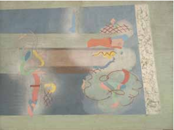
Jindřich Štyrský, V mlze / Im Nebel, 1927, olej a tempera na plátně / Öl, Tempera auf Leinwand, 47 x 62,5 cm

Hlavní budova, Výstavní sál 1. patro / Hauptgebäude, Ausstellungsräume 1. St. Kurátoři / Kuratoren: Marcel Fišer, Ondřej Chrobák