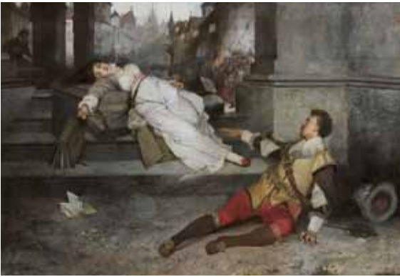
Václav Brožík, Anežka Steinhäuserová a Zikmund ze Švamberka (Ve smrti spojení) / Anežka Steinhäuser und Zikmund von Schwamberg (Im Tode vereint), 1875, olej, plátno / Öl auf Lnw., 119,5×174,5 cm, Západočeská galerie v Plzni

Opus magnum, 10. 1.-31. 3. 2013 Kurátor / Kurator: Roman Musil Vernisáž 9. ledna, 17.00