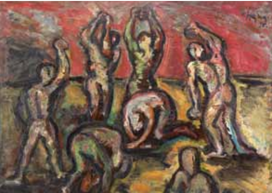
Kamenování / Steingung, 1936, olej, plátno / Öl, Leinwand, 100×131 cm, Galerie hlavního města Prahy

Velká galerie / Grosse Galerie 10. 1.–31. 3. 2013 Kurátor / Kurator: Harald Tesan Vernisáž 9. ledna, 17.00