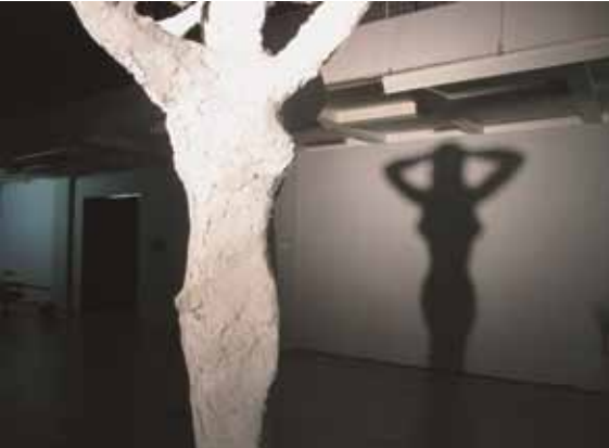
Ve stínu androgyna / Im Schatten des Androgynos, 2012, výstava / Ausstellung Useless, Divus Prager Kabarett, Berlin / Berlin