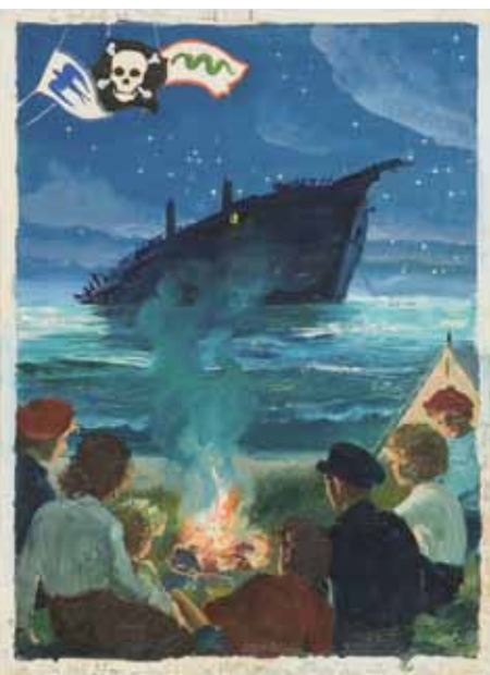
Zdeněk Burian, Trosečníci z Vlastovky (návrh knižní obálky ze souboru ilustrací ke knize A. Ransoma Tábora U tajuplného moře), 1948, olej, papír, plátno, 443 x 325 mm

Výstava z depozitáře / Die Ausstellung aus dem Depot 10. 1.-31. 3. 2013 Vernisáž 9. ledna, 17.00