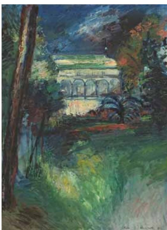
Jan Bauch, Belveder, 1941, olej, plátno, 85 x 62 cm Jan Bauch (1898–1995) – malíř a sochař, známý především svým svěbytným expresionismem.

Nejsem historik ani znalec umění, proto tato noticka bude pouze o mých pocitech. Tento obraz jsem vybrala především kvůli tomu, že při pohledu na něj jsem pocítila radost ze života. Tím, že žijeme v době uspěchané, nervózní a ze všech stran na nás útočí stres a starosti, mám potřebu, při pohledu na jakýkoliv obraz, cítit radost, barevnost a jasnou zprávu. Protože musím myslet na spoustu nezávazných věcí, čekám od obrazů, že mi do žil nalijí optimismus, což toto dílo beze zbytku splnilo. Doufám, že stejné pocity jako já budou mít i ostatní, kteří pohlédnou na krásnou „Kytici tulipánů“ od Václava Špály.