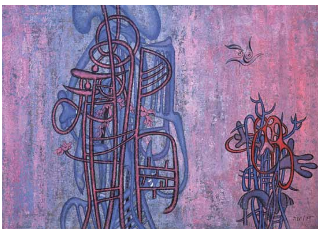
Václav Tikal, Postava podpíraná větrem s ptáčkem neuzitečným, 1965, tempera, lepenka, 35 x 50 cm Václav Tikal (1906–1965) – malíř, člen Skupiny Ra, významný představitel druhé generace Českého surrealismu

Dva nevelké obrázky od Václava Tikala vznikly na sklonku autorova života.