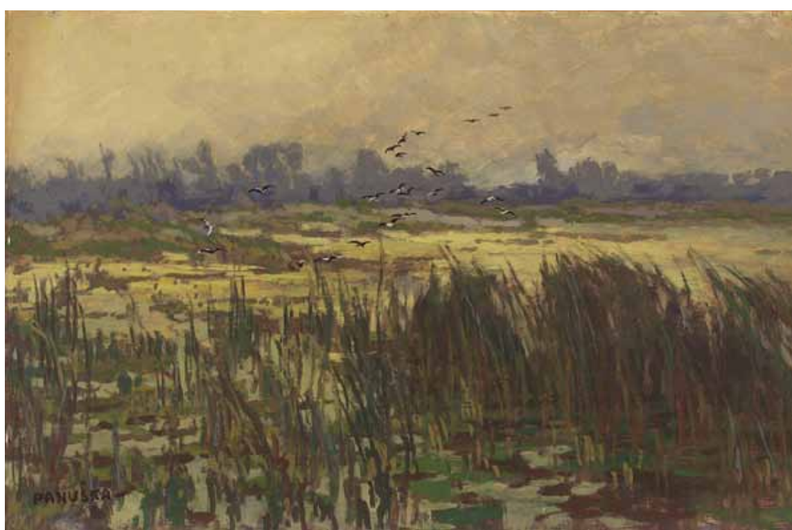
Jaroslav Panuška, Krajina, olej, plátno, 35 x 50 cm Jaroslav Panuška (1872–1958) – malíř, ilustrátor, příslušník krajinářské generace tzv. mařákovců, zároveň čelní představitel českého symbolismu.

Odmalička mě fascinovala fialová barva. Myslím, že svou vášní pro její levandulový odstín jsem přímo proslula. A právě melancholický tón oblohy Panuškovy krajiny byl tím prvním, co mě na obraze upoutalo. Přestože nepatřím mezi klasické cítěle krajinomalby, malířovo přírodní zákoutí si mě získalo svou nenápadností a nevtíravou kombinací barevných přechodů. Barvy se „neperou“ o své místo na slunci, jen se nenásilně a ohleduplně doplňují. Obraz na diváka nekřičí, spíše šeptá, vábí a kolébá. Setkání s Panuškovou Krajinou pro mne bylo láskou na první pohled.