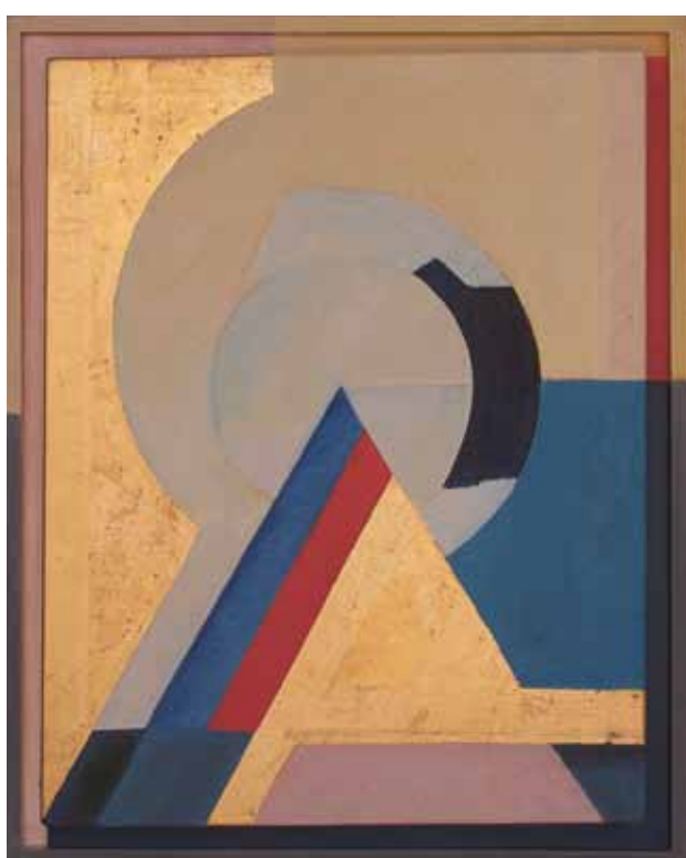
Otto Herbert Hájek, Obraz 93 A (z cyklu Dynamický pohyb – VII), 1985, olej, plátno, 115 x 94 cm Otto Herbert Hájek (1927–2005) – významný německý abstraktní malíř, grafik a sochař, narodil se v někdejší Československu.

Na obálce: Václav Tikal, Pohyblivé iluze, 1964, olejová tempera, překližka, 35 x 50 cm