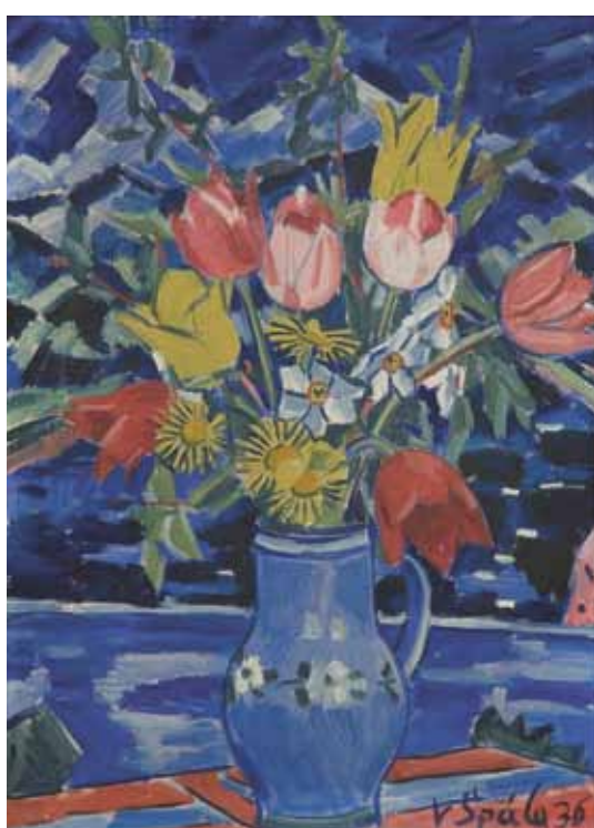
Václav Špála, Kytice tulipánů, 1936, olej, plátno, 73 x 55 cm Václav Špála (1885–1946) – malíř, vyšel z kubismu, později si vyvinul svůj osobitý styl, v němž dominují odstíny syté modré barvy.