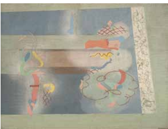
Jindřich Štyrský, V mlze / Im Nebel, 1927, olej a tempera na plátně, Öl, Tempera auf Leinwand, 47 x 62,5 cm