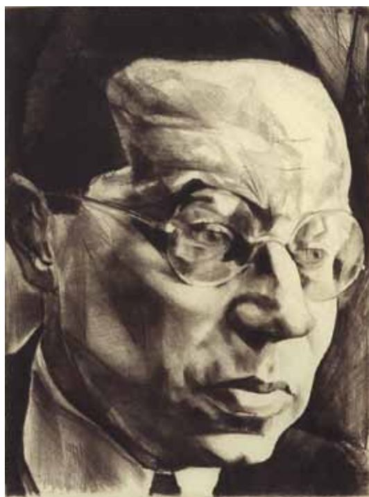
Lion Feuchtwanger, kolem / um 1922, lept / Radierung, 23,5×17,5 cm

Velká galerie / Grosse Galerie 28. 6.–30. 9. 2012 Kurátor / Kurator: Jan Placák Vernisáž 27. června, 17.00