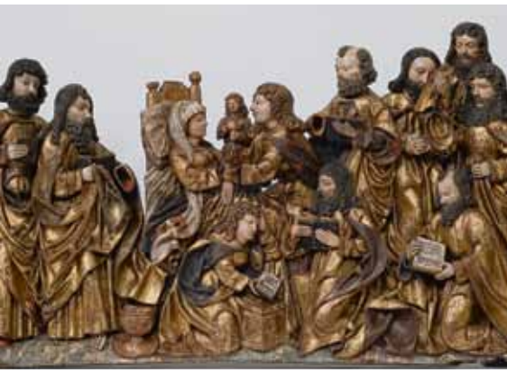
Smrt Panny Marie z kostela Povýšení sv. Kříže v Házlově, Franky nebo Horní Falc, první čtvrtina 16. století, lipové dřevo, původní polychromie / Marien Tod aus der Kreuzerhebungskirche in Haslau, Franken oder Oberpfalz, erstes Viertel des 16. Jahrhunderts, Lindenholz, originale Polychromie, detail