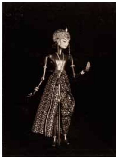
Loutka Kiai Ageng z představení „Nawang Wulan“ / Stabpuppe Kiai Ageng aus dem Stück „Nawang Wulan“, 1912, lípa, kostým: hedvábí, látky z Wiener Werkstätten / Lindenholz, Kostüm: Seide, Stoff aus den Wiener Werkstätten, v. 46 cm, s mechanikou 66 cm / H. 46 cm, mit Mechanik 66 cm. ÖTM Wien.

Opus magnum 28. 6.–30. 9. 2012 Kurátor / Kurator: Kurt Ifkovits Vernisáž 27. června, 17.00