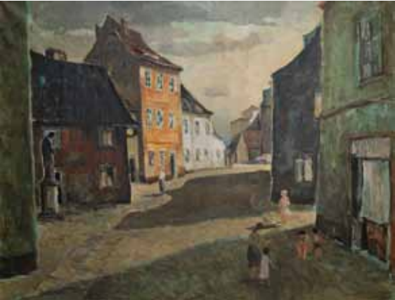
Starý Cheb (ulice Trčky z Lípy) / Das Alte Eger (Trčka z Lípy Str.), 1959, olej, plátno / Öl, Lnw., 113×86 cm, Pozemkový úřad Cheb

12. září, 17.00, vzpomínkový večer, vernisáž druhé části výstavy