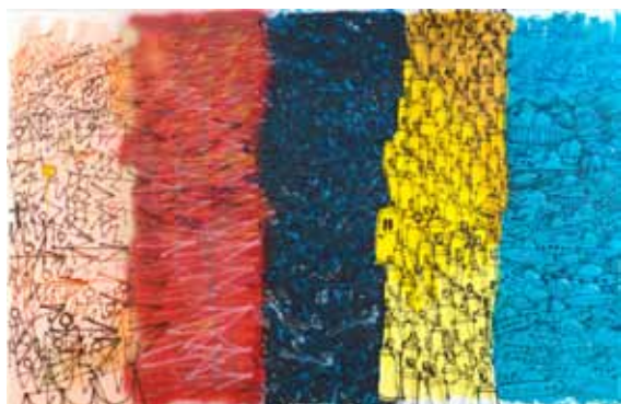
Versus, 2011, akryl, sprej a airbrush na plátně / Acryl, Spray und Airbrush auf Lnw., 200×130 cm

Malá galerie / Kleine Galerie, Videoroom 1. 7.–26. 8. 2012 Kurátor / Kurator: Jiří Gordon Vernisáž 30. června, 17.00