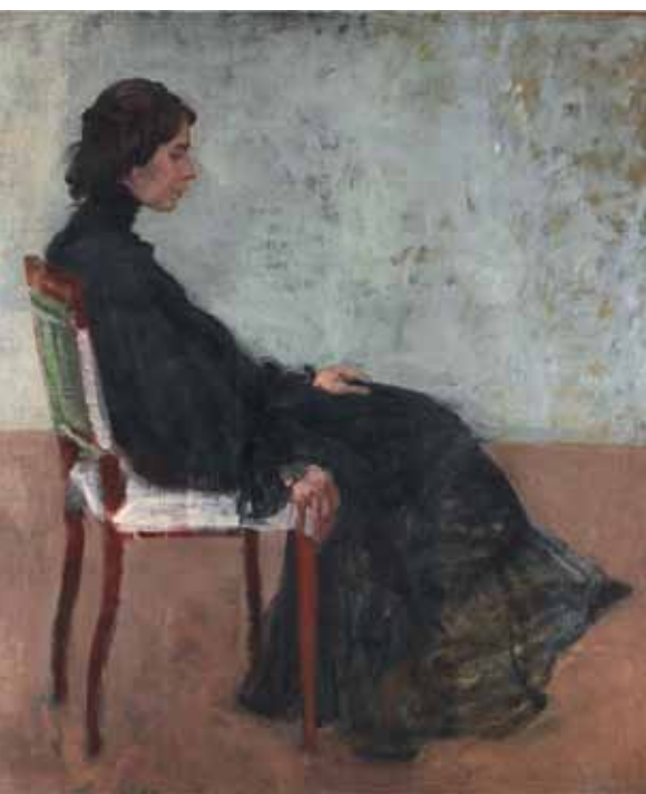
Podobizna snoubenky / Portrait of Fiancée, 1905–1906 olej, plátno / oil, canvas, 115,5 x 100 cm Národní galerie v Praze