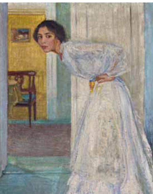
Bílá studie III / White Study III, 1910 olej, plátno / oil, canvas, 99 x 80,5 cm soukromá sbírka / private collection