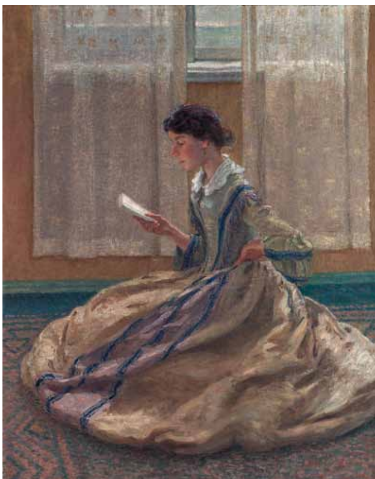
Čtenářka / Lady Reader, 1908 olej, plátno / oil, canvas, 135,5 x 110 cm Národní galerie v Praze

Folklore themes were also found in Jiránek's work; these were linked to his enchantment with Moravian Slovakia that he first visited as a member of a delegation accompanying August Rodin. He stayed in Velká and Nové Lhotky where he painted the local landscape and people in a style similar to that of Joža Uprka. Yet Jiránek's initial ideas on finding an authentic, pure approach to life and the harmonic relation of man with nature gradually dissipated.