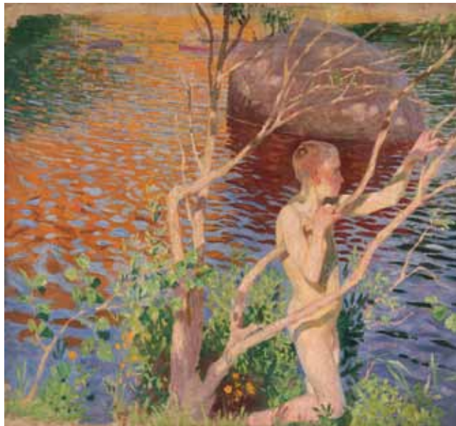
Koupání (Hoch z Velké) / Bathing (Boy from Velká), 1902 olej, plátno / oil, canvas, 71,5 x 94,5 cm Galerie výtvarného umění v Ostravě

Kolem roku 1900 Jiránek maloval náměty, čerpané ze života moderního města (kavárna Metropol, pražská periferie, fotbal). Rozvíjel v nich svůj tvůrčí přístup, postavený na optickém vnímání reality – na čisté zrakovosti. Z toho důvodu byl také Jiránek nejčastěji srovnáván s impresionisty, aniž by v malbě užíval ryzí impresionistickou techniku. Linie aktuálních moderních motivů vygradovala v roce 1903 obrazem Sprchy v pražském Sokole , který umělec považoval za jedno ze svých nejpodstatnějších děl. Jeho přijetí dobovou kritikou však bylo rozporuplné, a to pravděpodobně i proto, že bylo interpretováno homoeroticky.