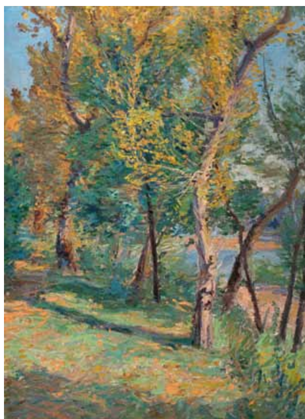
Zahrada (Jelení příkop) / Garden (Jelení Moat), 1908–1910 olej, plátno / oil, canvas, 94 x 70 cm Moravská galerie v Brně