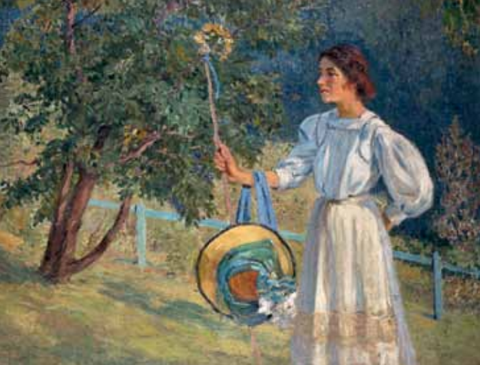
Velké pastorále / Great Pastoral, 1906–1907 olej, plátno / oil, canvas, 87 x 114 cm Galerie výtvarného umění v Ostravě