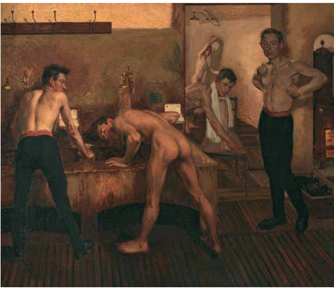
Sprchy v pražském Sokole / The Showers at the Sokol in Prague, 1901–1905 olej, plátno / oil, canvas, 140 x 169 cm Národní galerie v Praze