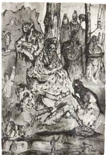
Oběti zla / Die Opfer des Bösen, 2010, tuš na ručním papíře / Tusche auf Bütteln, 100×70 cm