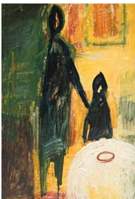
U stolu / Beim Tisch, 1958, olej, překlíčka / Öl, Sperrholz, 73×50 cm, Galerie Zlatá Husa

Přednáška: 16. listopadu, 17.00, Jan Rous: Jiří Balcar a umění 60. let