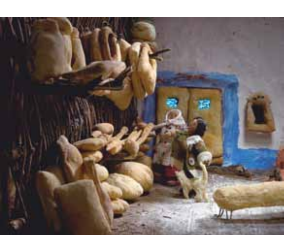
Ilustrace z knihy Chlebová Lhota / Illustration aus dem Buch Chlebová Lhota