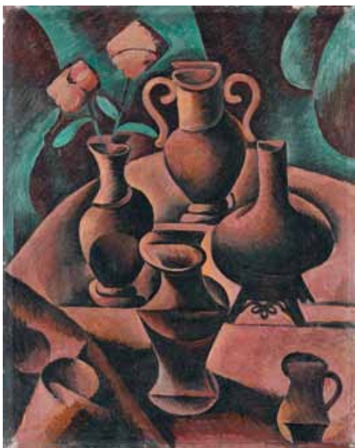
Zátíší s vazami / Stillleben mit den Vasen, 1911, olej, plátno / Öl auf Leinwand, 87×70 cm, Západočeská galerie, Plzeň

Přednáška: 19. října, 17.00, Mahulena Nešlehová: Život a dílo Bohumila Kubišty