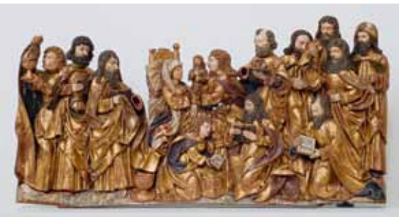
Smrt Panny Marie z kostela Povýšení sv. Kříže v Házlově, Franky nebo Horní Falc, první čtvrtina 16. století, lipové dřevo, původní polychromie / Marientod aus der Kreuzerhebungskirche in Haslau, Franken oder Oberpfalz, erstes Viertel des 16. Jahrhunderts, Lindenholz, originale Polychromie